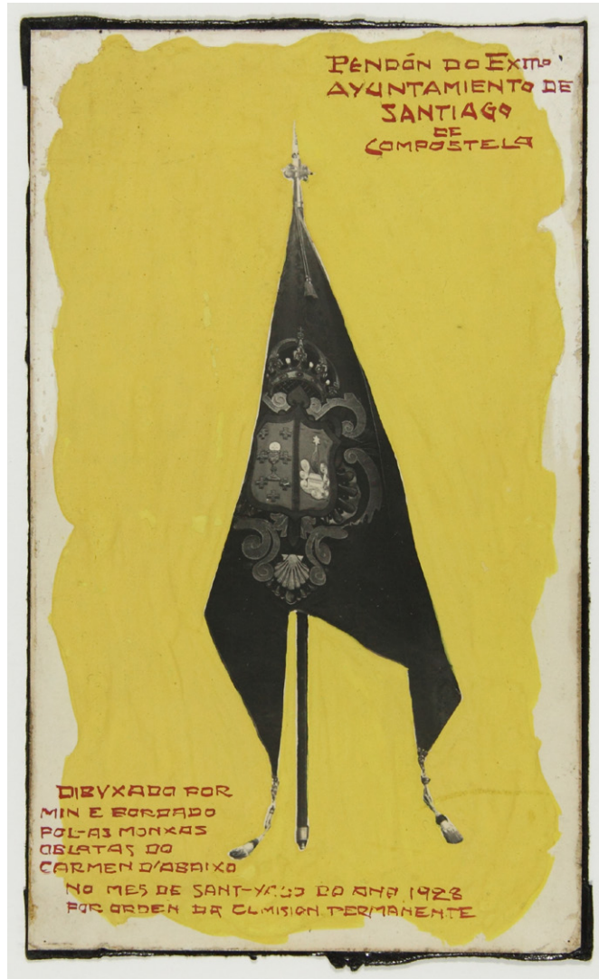
Figura 7. Camiño Díaz Baliño. Cartel del Pendón municipal , 1928.

En 1937 realizó una obra conmemorativa para el dictador Francisco Franco (1892-1975) con motivo de su nombramiento de Hijo Predilecto de su villa natal, Ferrol, encargada por su Ayuntamiento y otorgada por el alcalde Antonio Vázquez Permuy. El periódico publicó una fotografía (Figura 8), que a pesar de su mala calidad nos permite conocer la obra, además de su cuidadosa descripción, que indica que fue parte de la exposición del Homenaje al Ejército ese año en el Casino ferrolano. La placa iba montada sobre respaldo de caoba y estaba protagonizada por “el escudo