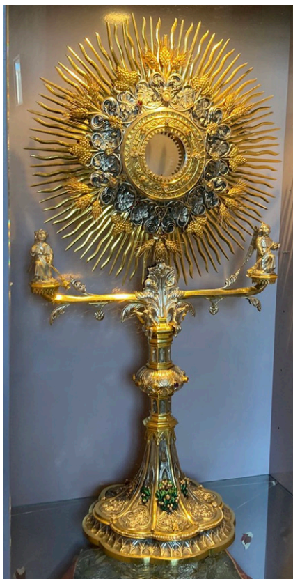
Figura 4. Augusto Otero Martínez, Custodia , 1928, Santa María a Maior, Pontevedra, © Ana Pérez Varela.