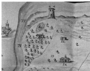
Lám. 4. Venta la Berraca (nº 25) y hacienda con capilla (nº 24).