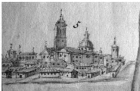
Lám. 2. Detalle de la ciudad de Sanlúcar en el plano de Díaz Pinto.