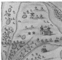
Lám. 5. Santuario del Rocío (nº 55) y alrededores.