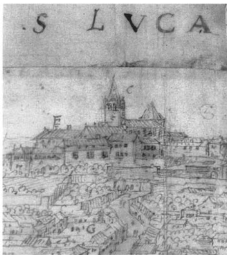
Lám. 3. Sanlúcar de Barrameda en el plano de Antón Van den Wyngaerde.