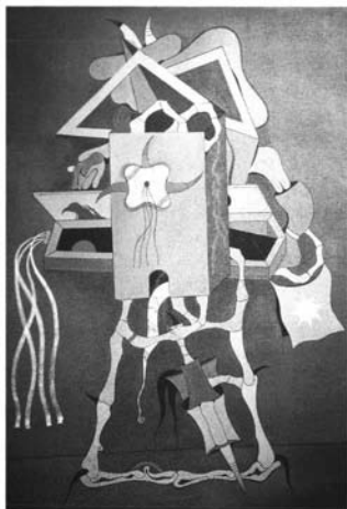
Fotografía 3: Jorge Camacho. "El Acto de Oro". 1968