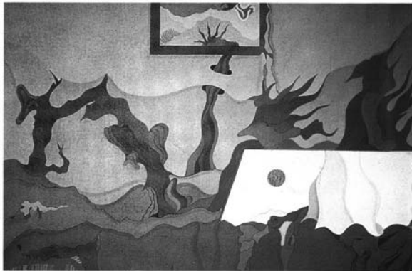
Fotografía 4: Jorge Camacho. "Bodegón N° 9". La Pintura. 1991