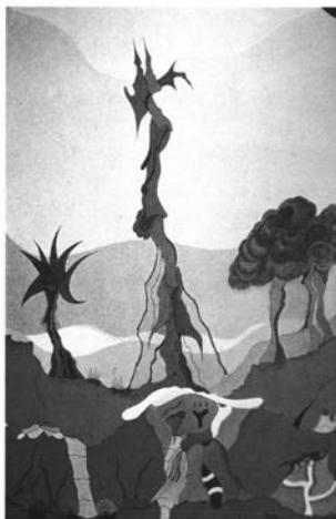
Fotografía 5: Jorge Camacho. "Paisaje Cristalino", 1993