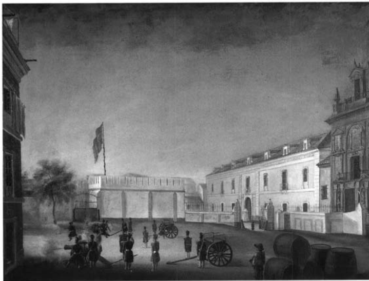
Fig. 2. Anónimo. Real Maestranza de Artillería de Sevilla. Colección particular. Madrid.