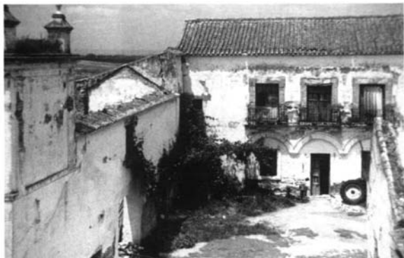
Lám. 7. Señorío y almazara de Cañada Honda.

torno a un segundo patio, en la actualidad muy menoscabado 25 . Mención especial merecen sus monumentales zahúrdas, que cuentan con una cuidada fachada y un racionalizado interior. (Lám. 9).