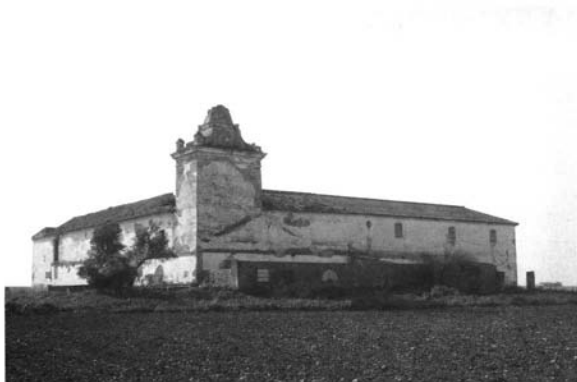
Lám. 5. Hacienda de Aguirre, Carmona.

Muy semejante a Córdoba es la inédita hacienda conocida actualmente como Los Guirris, degeneración de su nombre original: Aguirre. Se encuentra muy próxima a la carretera Carmona-Brenes y en la actualidad su imponente caserío está en ruinas, a pesar de lo cual es evidente su íntimo parentesco con Córdoba, por lo que sospechamos que la levantaría el mismo alarife local, también a finales del siglo XVIII 23 . (Lám. 5).