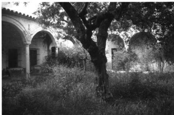
Lám. 1. Señorío de la hacienda El Cadoso, Carmona

El primero, de aires marcadamente rústicos, antecede al patio en torno al cual se dispone el referido señorío, de una arquitectura mucho más sutil y elegante, ya que se articula mediante arcadas sostenidas por columnas de mármol y que recuerda al señorío de la hacienda Benazuza en Sanlúcar la Mayor. A ello se suma un tercer patio añadido a la estructura original y de menor interés. En cualquier caso, el caserío de El Cadoso, no parece tener consecuentes claros ni configurar un modelo. (Lám. 1)