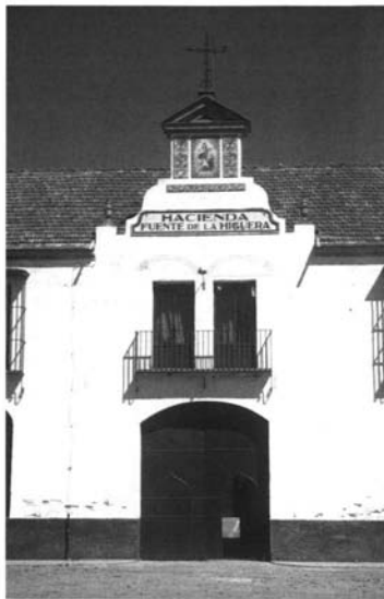
Lám. 12. Portada de Fuente de la Higuera, Carmona

Un caso excepcional dentro del modelo de hacienda industrial es el de Menguillán, al pie de la carretera A 92 y en plena Vega de Carmona. De su caserío, que lamentablemente se encuentra abandonado y semiarruinado, se deduce que debió dedicarse tradicionalmente al cereal, para convertirse –al menos en parte– en explotación olivarera sólo a principios del siglo XX. En su estado actual tiene dos grandes núcleos edificatorios. El primero, de incierta pero segura antigüedad y funcionalidad ganadera, debió formar parte del primitivo cortijo, y está formado por un gran tinajo, unas zahúrdas y unas cuadras. El segundo núcleo de Menguillán y su verdadero corazón es el olivarero, que se articula en torno a varios patios levantados a principios del siglo XX. El patio central es el del señorío, el cual se ubica en fachada, contando en su planta baja con una galería acristalada,