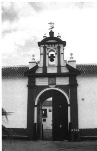
Lám. 10. Portada de la hacienda La Nava, Carmona.

y cuyas torres de contrapeso en esta ocasión se ubican al fondo del edificio, siendo una de ellas también mirador 30 .