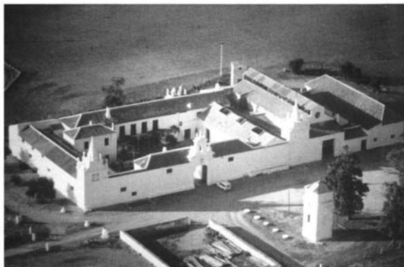
Lám. 9. Hacienda La Plata, Carmona.

quizás relacionarlo con los pioneros edificios industriales levantados por el real cuerpo de ingenieros. Está articulada en torno a un gran patio principal, que sigue el esquema al que nos venimos refiriendo, y otro de labor que muestra una importante presencia ganadera 29 . (Lám. 10).