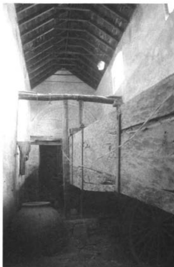
Lám. 8. Viga de la prensa de la hacienda Tavera, Carmona.

moderna, simétrico, con muchas comodidades y capilla ", por lo que cabe fecharla próxima a la mitad del siglo XIX. De esta manera La Nava parece estar teñida ya de la racionalidad propia del mundo contemporáneo y su austero neoclasicismo cabría