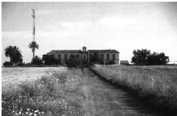
Lám. 11. Guadalbardilla, Carmona

Menguillán 40 . El primero, también llamado Negrete, está en un paraje privilegiado, entre el canal del Bajo Guadalquivir y la carretera Brenes-Los Rosales. Históricamente fue una de las propiedades de los Lasso de la Vega, dándole su actual configuración a principios del siglo XX el marqués de Tablantes, lo que explica el carácter regionalista de buena parte de su arquitectura, como se ve en su capilla, señorío –que goza de una vista extraordinaria–, jardín y almazara. Acerca de la cronología de todo ello puede dar una pista el documento que aún se conserva en la capilla por el que el cardenal Almaraz, arzobispo de Sevilla, el 7 de diciembre de 1920 concedió doscientos días de indulgencias a los que rezasen “ a las sagradas imágenes del Santo Cristo, Purísima Concepción y Patriarca San José que se veneran en la capilla de la Hacienda El Cerro, propiedad del excelentísimo señor marqués de Tablantes ”. No obstante, sospechamos que en parte el edificio puede ser anterior y que quizás su núcleo original, de carácter básicamente ganadero, debió encontrarse en el actual patio de labor, lo que explicaría que en el mismo esté la portada principal del edificio. En cualquier caso, es el segundo patio, más cuidado que el anterior, el que sigue el modelo de hacienda industrial. Ocupa su fachada el amplio señorío de dos plantas, mientras que el resto del patio está destinado a almazara, cubierta por una interesante y compleja viguería.