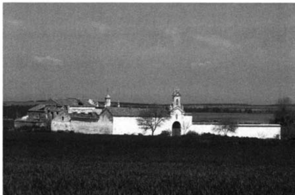
Lám. 6. Hacienda Cañada Honda, Carmona.

su capilla; Cañada Honda, con un elegante caserío que empieza a dar señales de ruina; Las Cárdenas, reformada en el XIX; Castilleja o La Atalaya Baja, con un monumental señorío; La Compañía o La Atalaya Alta, cuya notable portada neoclásica hemos comparado con la del sevillano palacio de las Dueñas; La Florida, en la actualidad pintada de almagra y con un importante señorío; Los Graneros, con dos almazaras semiarruinadas; Los Molinillos, actualmente en restauración; Los Nietos, inédita y articulada en torno a patio y corral; Nueva de San José, también inédita pese a su interés y perfecta conservación; Palmagallarda, contemporánea de Vistahermosa y pieza clave del imperio agrícola de los Lasso de la Vega 24 ; El Rosario, con doble almazara y muy descuida en la actualidad y, para terminar una lista que se podría alargar considerablemente, Tavera, que aún conserva la viga de su prensa. (Láms. 6, 7 y 8).