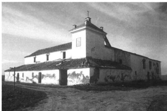
Lám. 4. Hacienda de Córdoba, Carmona