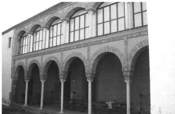
Lám. 2. Señorío de la hacienda El Corzo, ¿Circa 1578?

Esta expansión olivarera se hizo en gran parte de manera fraudulenta, como prueba un interesante documento de finales de dicho siglo que denunciaba “ que el año pasado de 1794 y principios de 1795 varios vecinos, hasta el número de más de treinta, ocuparon porciones de terreno valdío que empezaron a desmontar y plantar de estacas de olivos, siguiendo en esto el ejemplo de otros muchos que en los años anteriores hicieron ocupaciones iguales y a quienes se concedió título de propiedad ”. Ello ocasionó “ no haver quedado en el término valdíos bastantes para la conversión y cría de ganados ”, en clara referencia a las siempre complejas relaciones de ganaderos y labradores 20 .