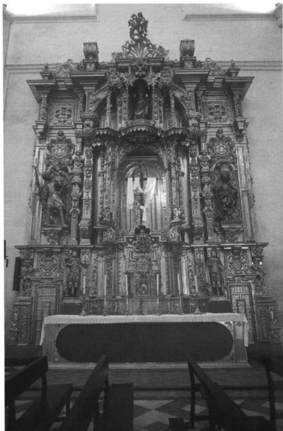
Jerez de la Frontera. San Juan de los Caballeros. Muro del evangelio donde se encontraba el altar y retablo de Santa María de la Paz.