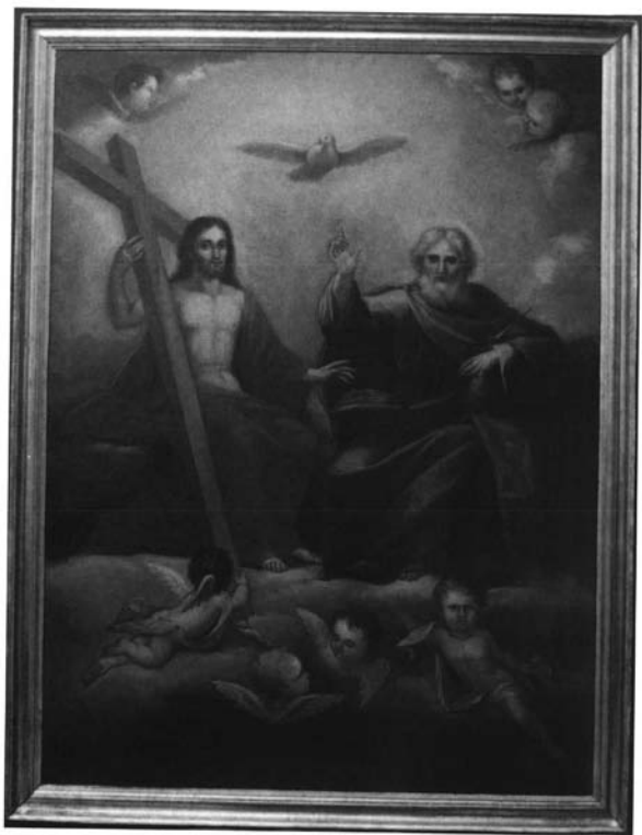
1. José María Arango. La Santísima Trinidad . 1833. Capilla de San Andrés. Sevilla.