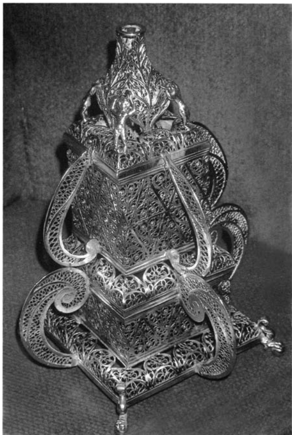
Figura 2. Perfumador, siglo XVII. Estado actual. Colección Particular. Sevilla.