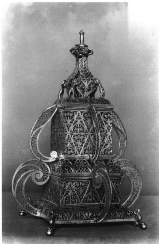
Figura 1. Perfumador, siglo XVII. Aspecto que presentaba en 1950..