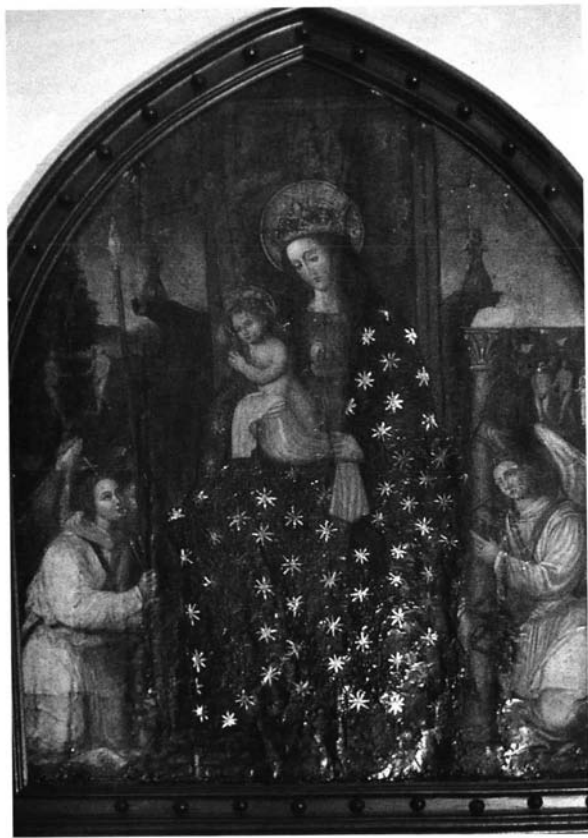
Fotografía 1. ¿Alonso de Villanueva? Virgen de los Remedios. Úbeda. Excmo. Ayuntamiento