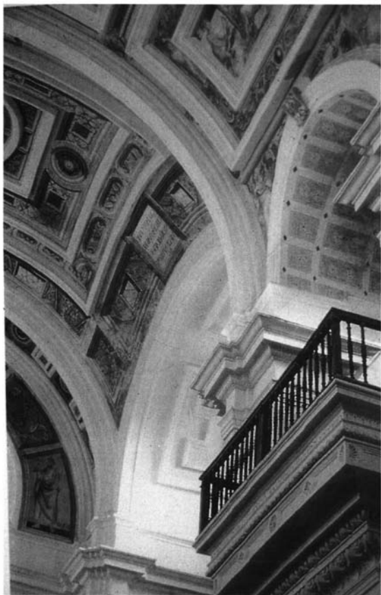
Fotografía 10. Hospital de Santiago. Capilla.