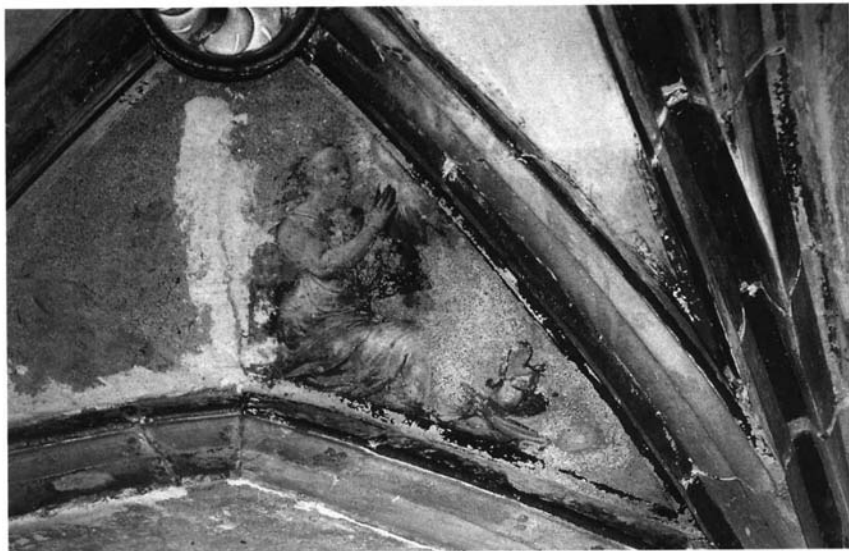
Fotografía 3. Capilla del Camarero Vago. Úbeda. Iglesia de S. Pablo.