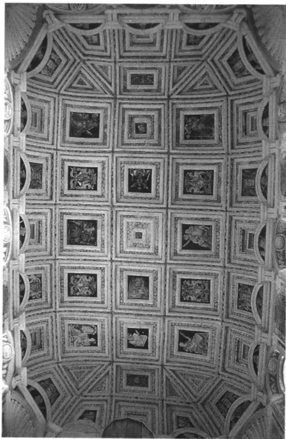
Fotografía 9. Hospital de Santiago de Úbeda. Bóveda de la escalera.