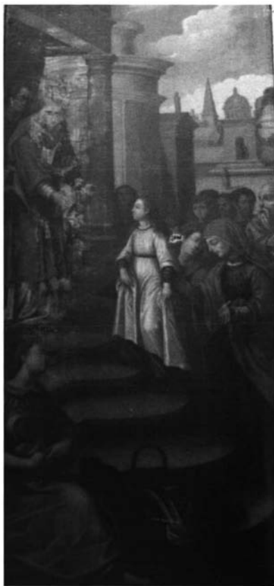
Fotografía 6. Pedro de Raxis. Presentación de la Virgen. Úbeda. Iglesia de S. Pedro.