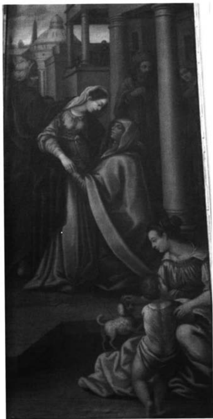
Fotografía 5. Pedro de Raxis. Visitación de la Virgen a Sta. Isabel. Úbeda. Iglesia de S. Pedro