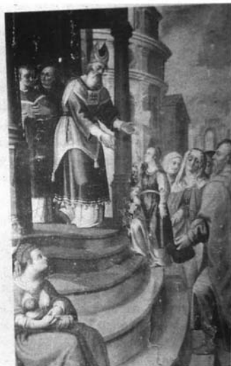
Fotografía 8. Pedro de Raxis. Presentación de la Virgen. Granada. Catedral