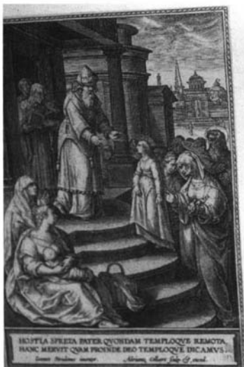
Fotografía 7. Adrian Collaert. (Presentación de la Virgen. Grabado)