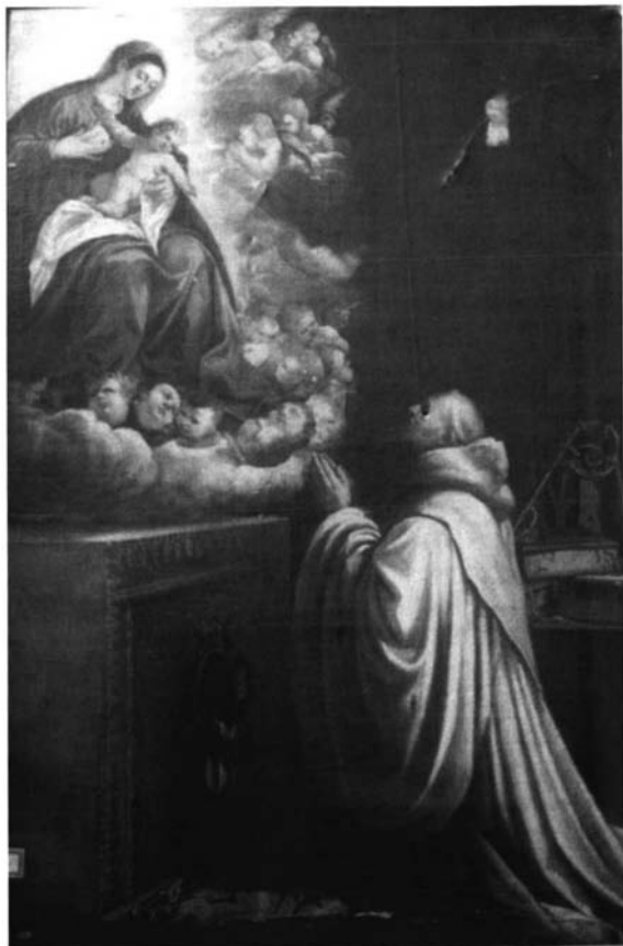
Fotografía 4. Pedro de Raxis. Lactatio de S. Bernardo. Úbeda. Iglesia de S. Pedro.