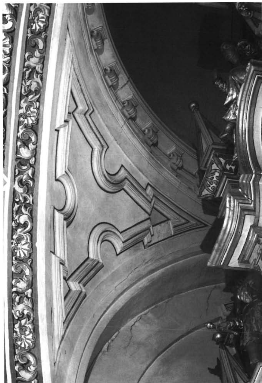
Lám.5: Écija. Iglesia de Santa María. Capilla del Sagrario. Presbiterio, detalle de la pechina.