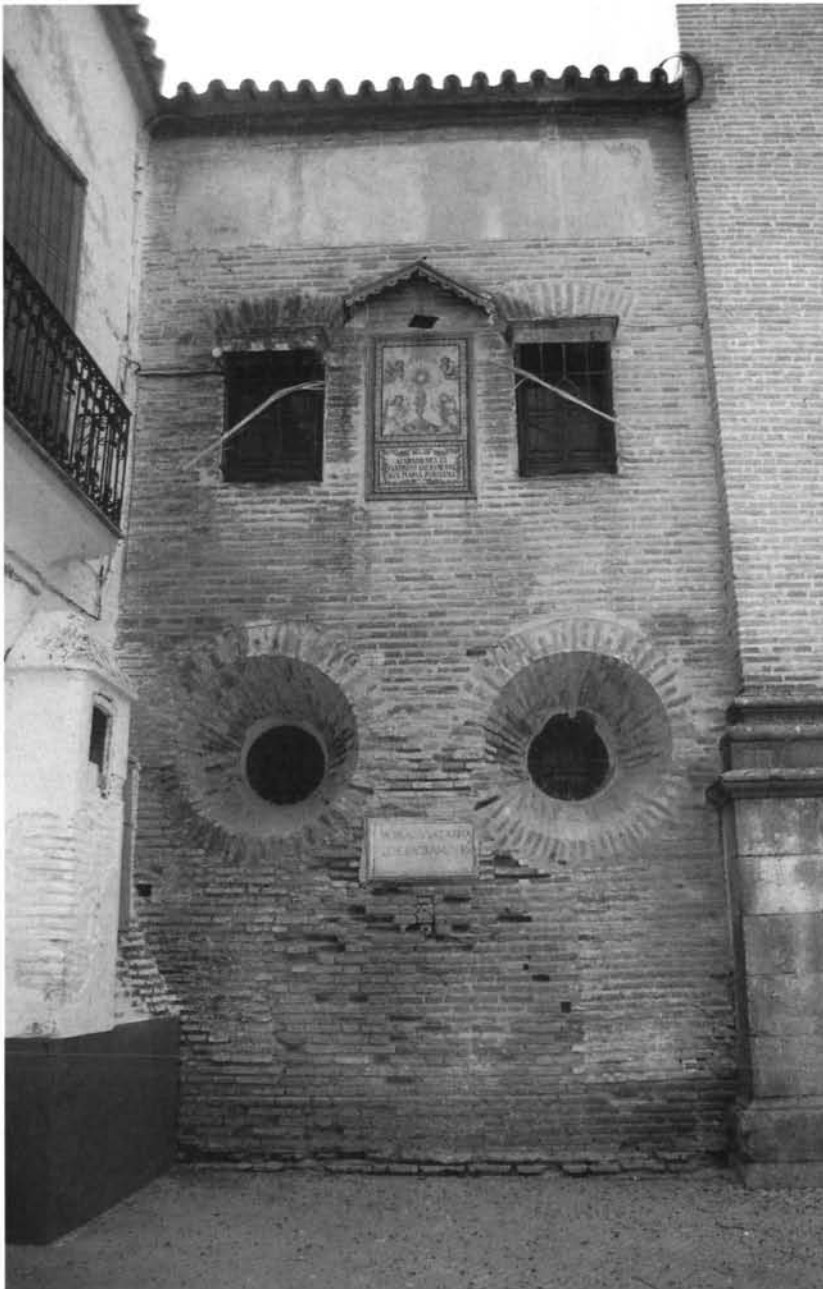
Lám.3: Écija. Iglesia de Santa María. Exterior del Vestuario.