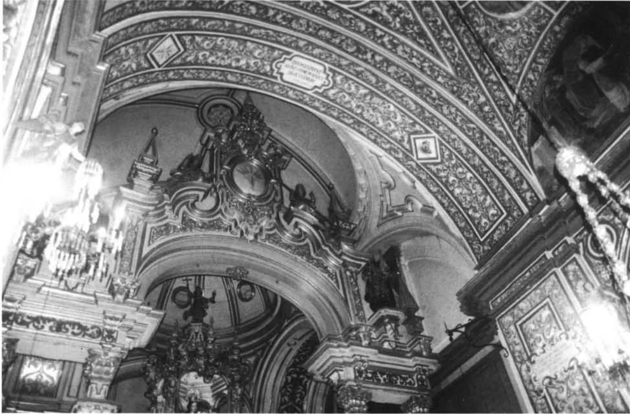
Lám.4: Écija. Iglesia de Santa María. Capilla del Sagrario. Bóveda del presbiterio.