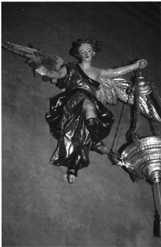
Fotografía 5. Marcelino Roldán Serrallonga. Ángel Lamparero . 1747. Parroquia de San Vicente Mártir de Sevilla.