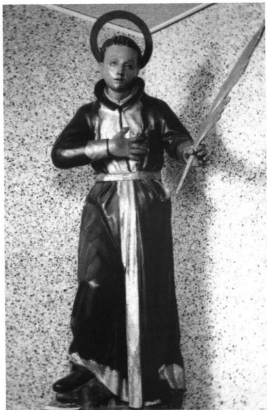
Fotografía 1. Marcelino Roldán Serrallonga. San Juan de Goto . 1732. Museo de los 26 Santos Mártires de Nagasaki.