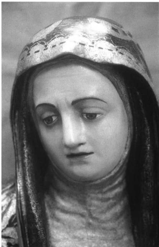
Fotografía 10. Marcelino Roldán Serrallonga. Nuestra Señora de la Soledad (detalle del rostro). 1724. Retablo del Cristo del Perdón de la Catedral de Sevilla.