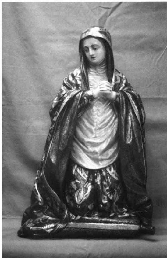
Fotografía 9. Marcelino Roldán Serrallonga. Nuestra Señora de la Soledad . 1724. Retablo del Cristo del Perdón de la Catedral de Sevilla.