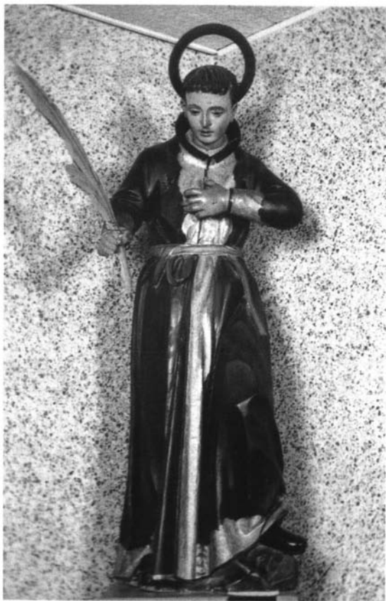
Fotografía 2. Marcelino Roldán Serrallonga. San Pablo Miki . 1732. Museo de los 26 Santos Mártires de Nagasaki.