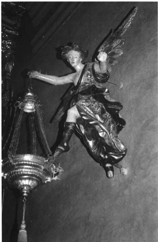
Fotografía 6. Marcelino Roldán Serrallonga. Ángel Lamparero . 1747. Parroquia de San Vicente Mártir de Sevilla.