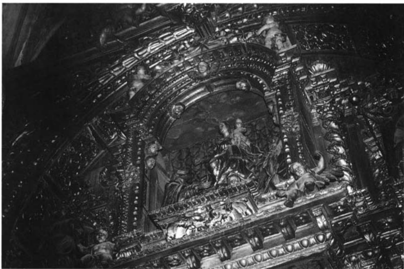
Lám. 6. Cristóbal de Guadix (1707). Retablo de la capilla del Calvario (detalle). Parroquia de la Magdalena (Sevilla)