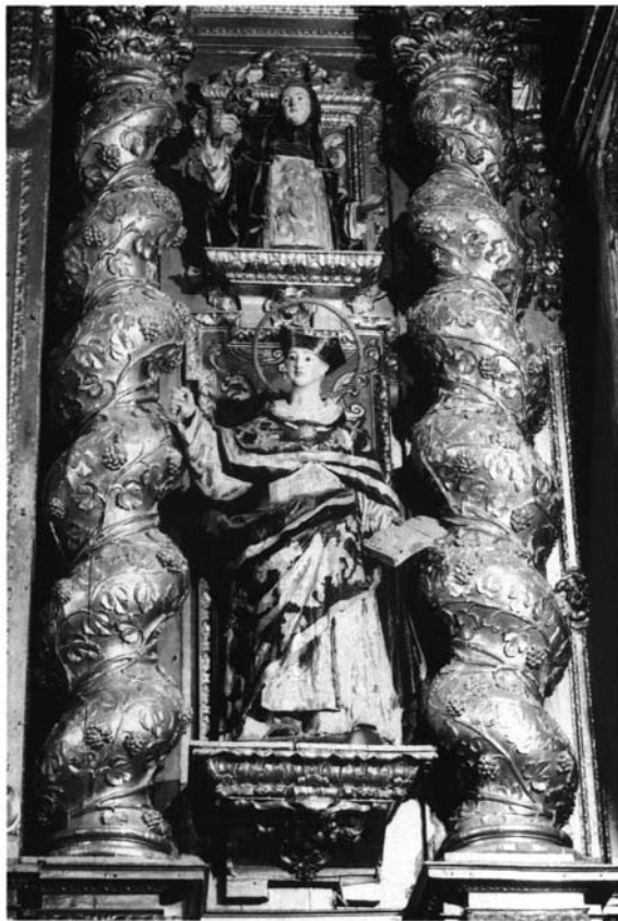
Lám. 3. Cristóbal de Guadix (1693). Retablo mayor (detalle). Convento del Rosario (Arahal, Sevilla)