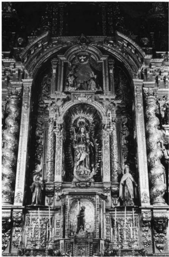
Lám. 2. Cristóbal de Guadix (1693). Retablo mayor (detalle). Convento del Rosario (Arahal, Sevilla)