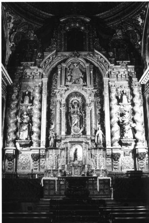
Lám. 1. Cristóbal de Guadix (1693). Retablo mayor. Convento del Rosario (Arahal, Sevilla)