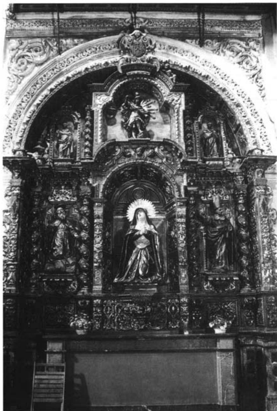
Lám. 7. ¿Cristóbal de Guadix? (h. 1700). Retablo de la Virgen de la Antigua. Parroquia de la Magdalena (Sevilla)