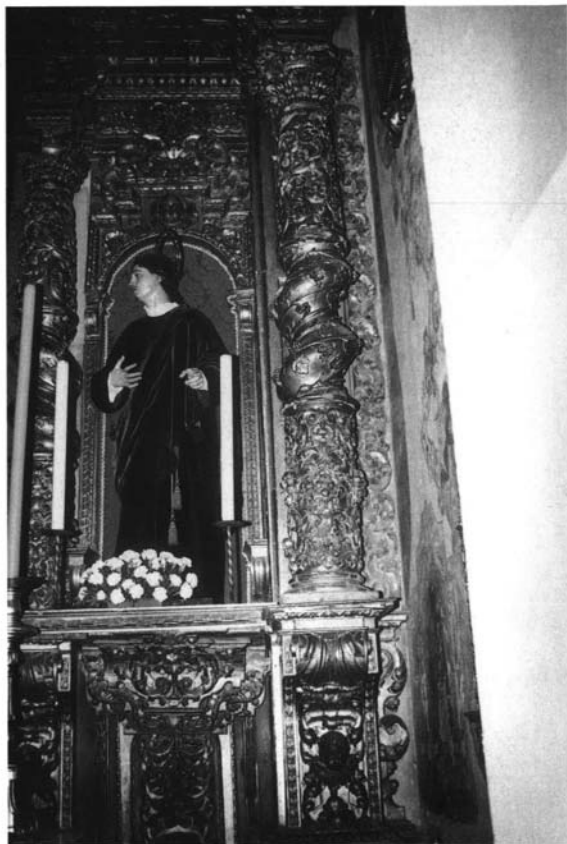
Lám. 5. Cristóbal de Guadix (1707). Retablo de la capilla del Calvario (detalle). Parroquia de la Magdalena (Sevilla)