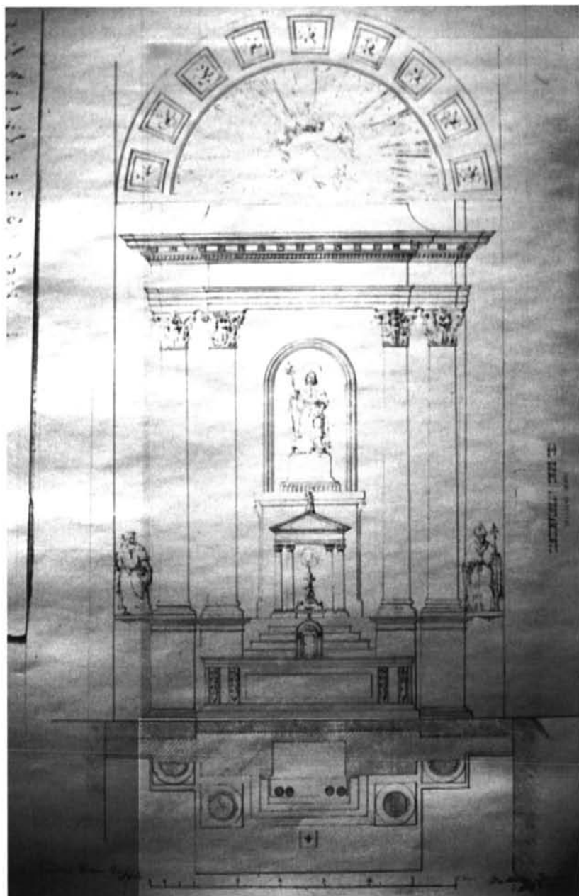
Lám. 2. Balbino Marrón y Ranero. Diseño del retablo mayor de la parroquia de San Roque . 1850.