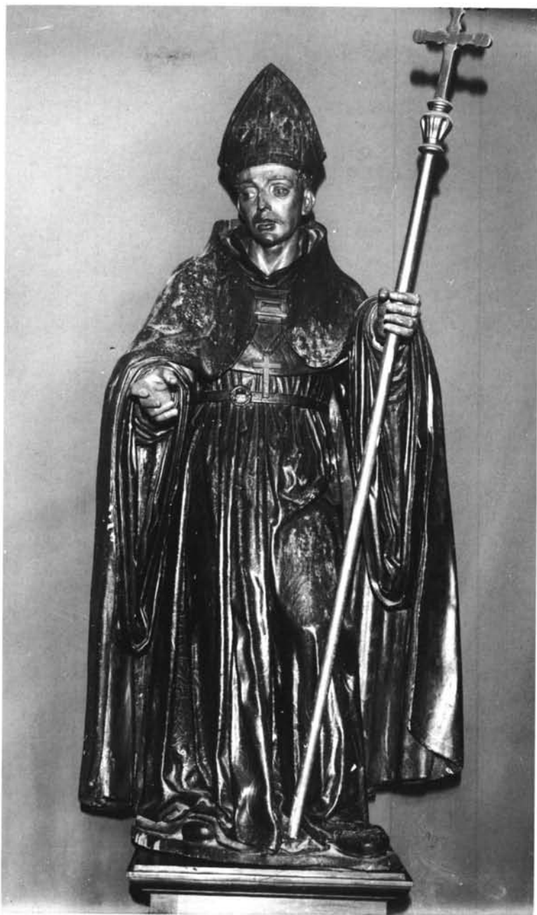
Lám. 5. Santo Tomás de Villanueva.