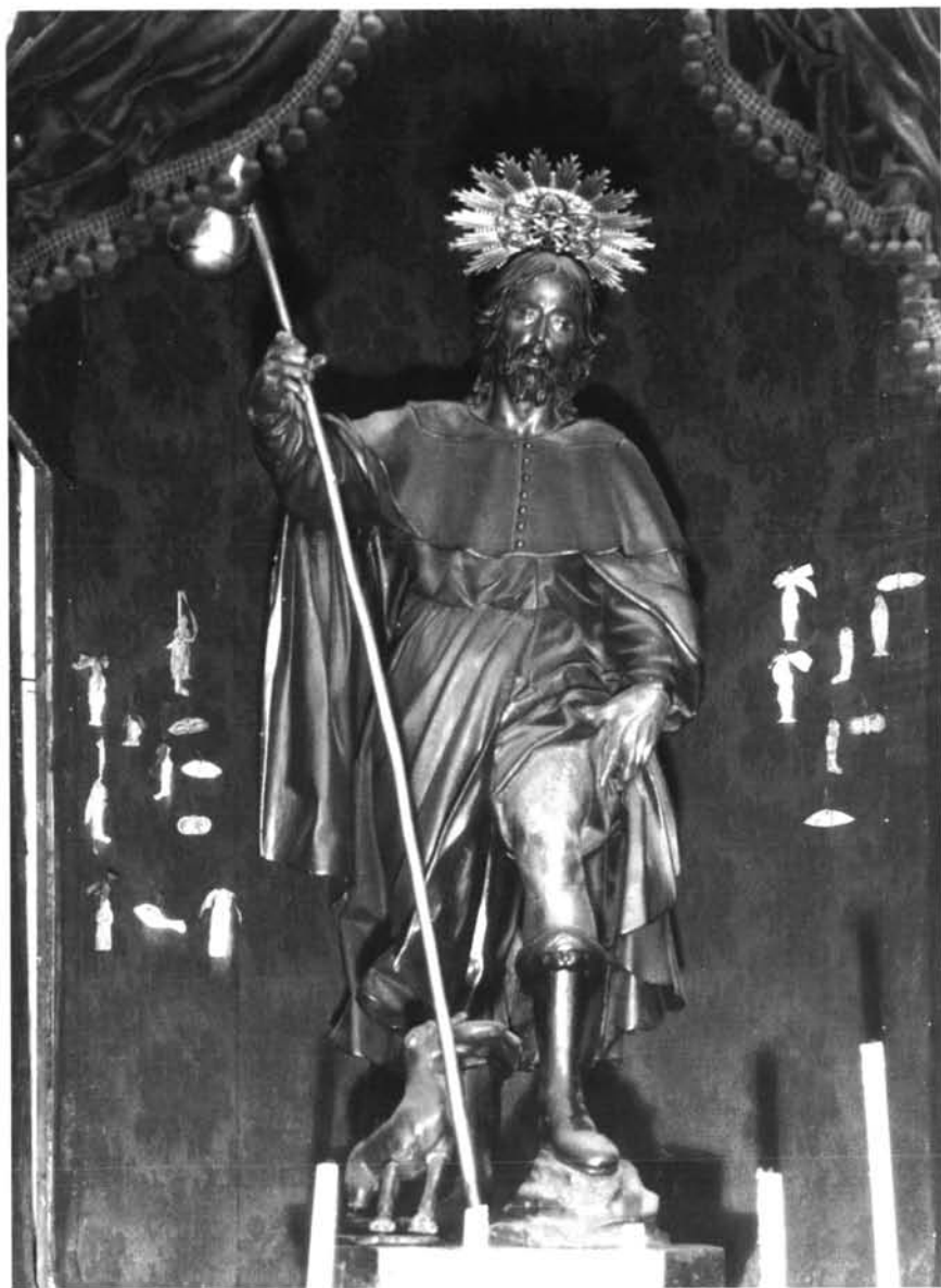
Lám. 4. San Roque.