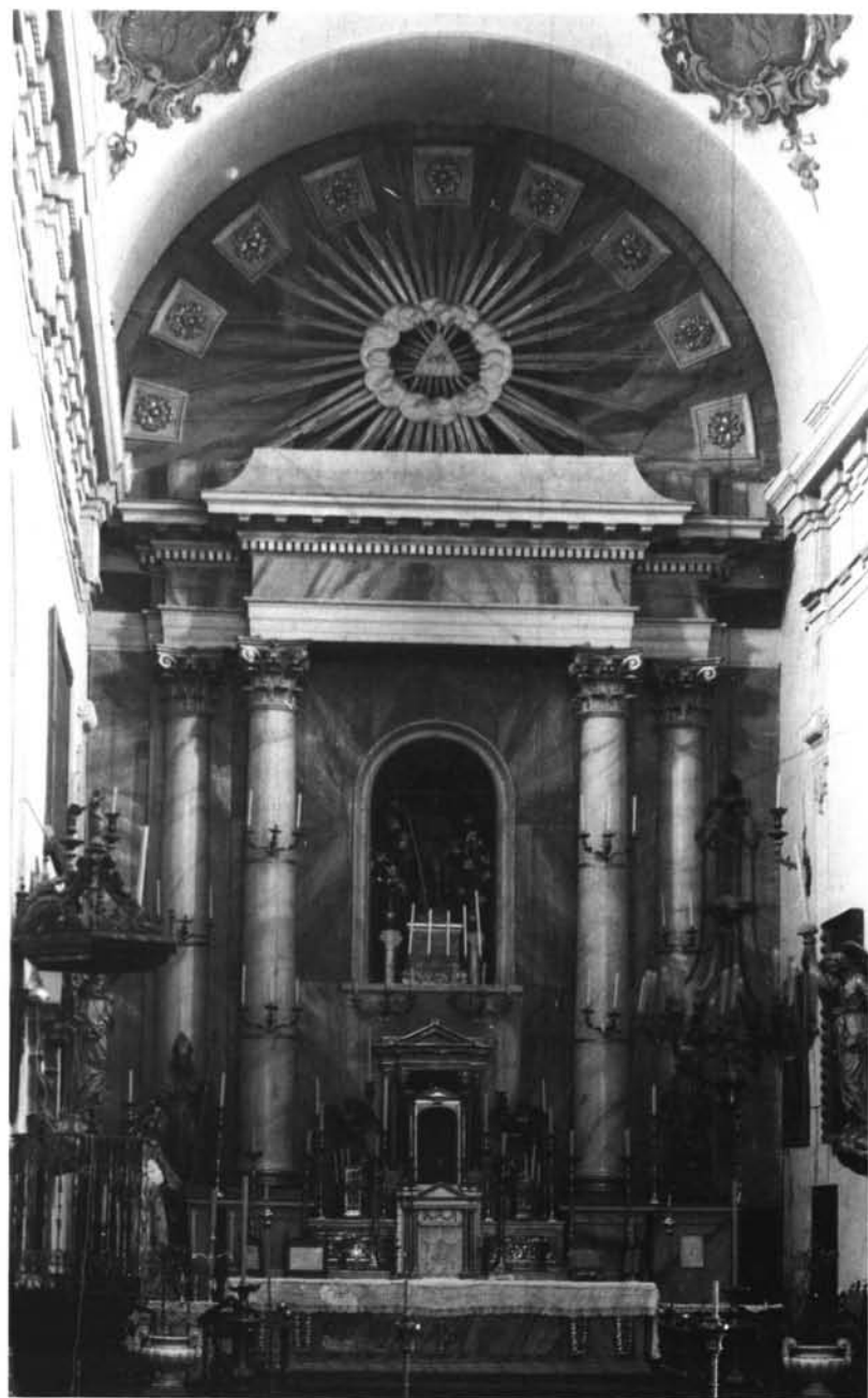
Lám. 3. Gabriel Astorga. Retablo mayor de la parroquia de San Roque . 1850.