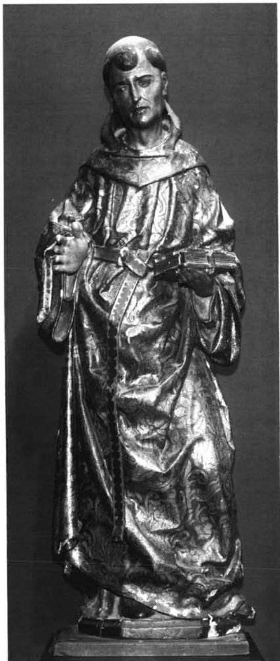
Lám. 6. San Nicolás de Tolentino.