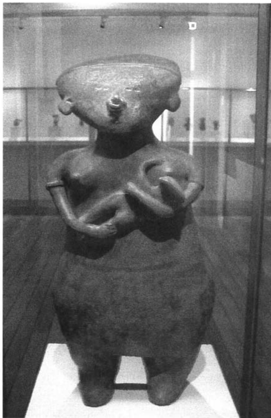
"Mujer con niño". Cultura Nayarit. Periodo preclásico. Occidente de México.