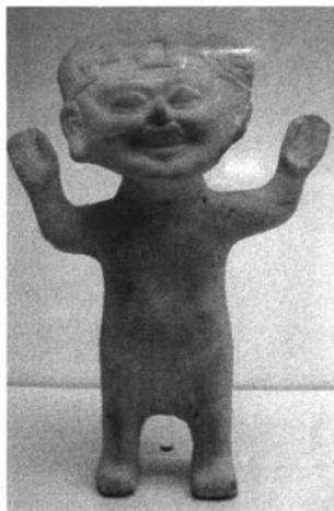
"Figura sonriente". Periodo preclásico. Cultura Totonaca. Golfo de México. Veracruz.