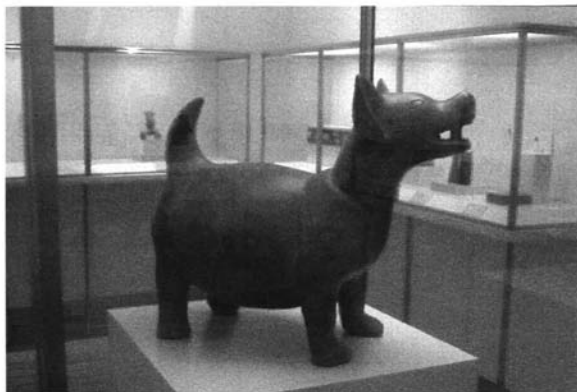
"Perro". Cultura Colima. Periodo clásico. Occidente de México.