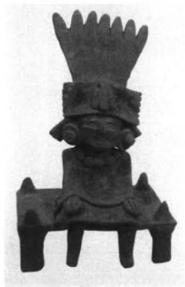
“Xipe-Tlasolteotl”. Periodo clásico. Cultura Tajín.