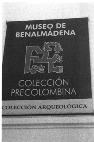
Museo precolombino de Benalmádena. "Cartela del Museo. Logotipo". 2005