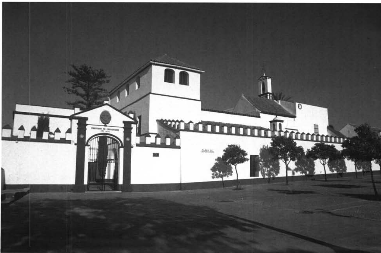
Lámina 1. Fachada del convento hacia la plaza de Capuchinos