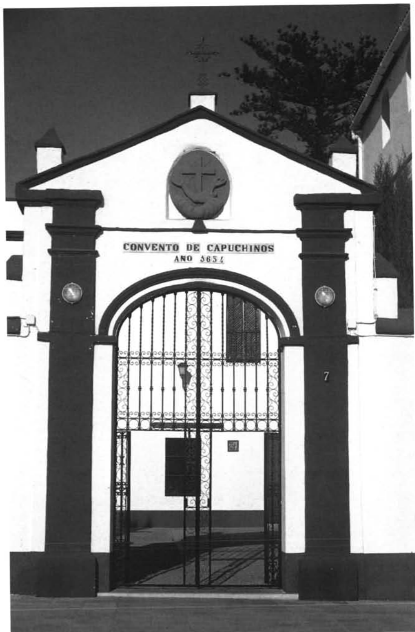
Lámina 2. Portada del compás