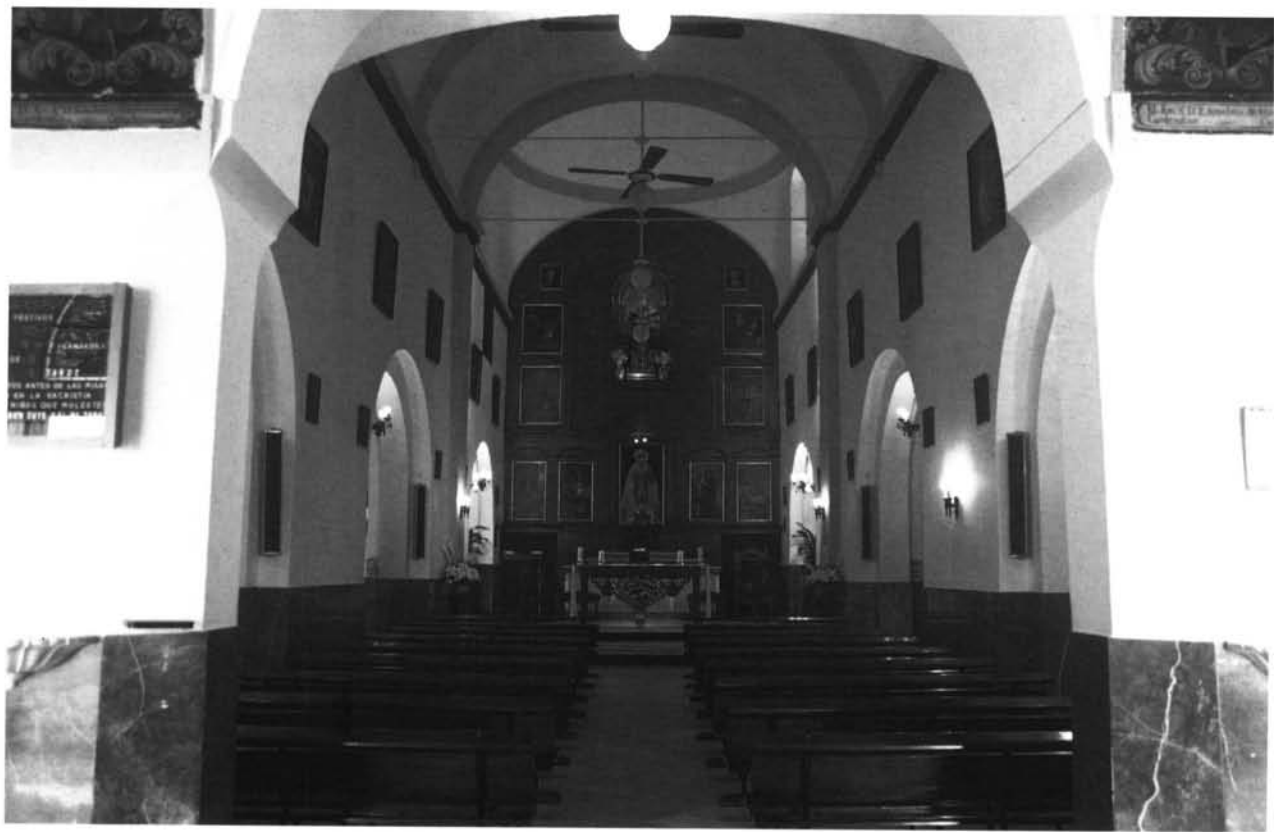
Lámina 5. Interior de la iglesia desde el sotocoro