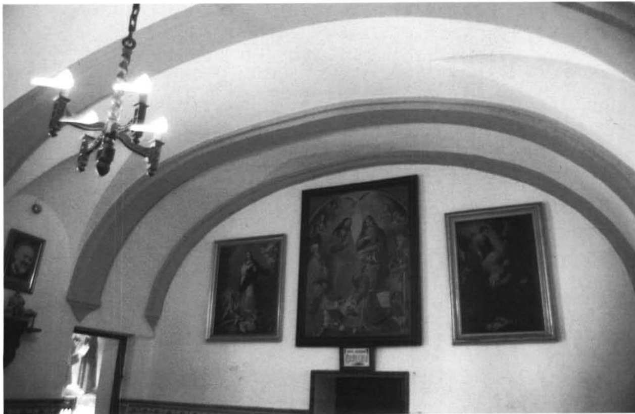
Lámina 6. Bóveda de la Sala " de profundis "