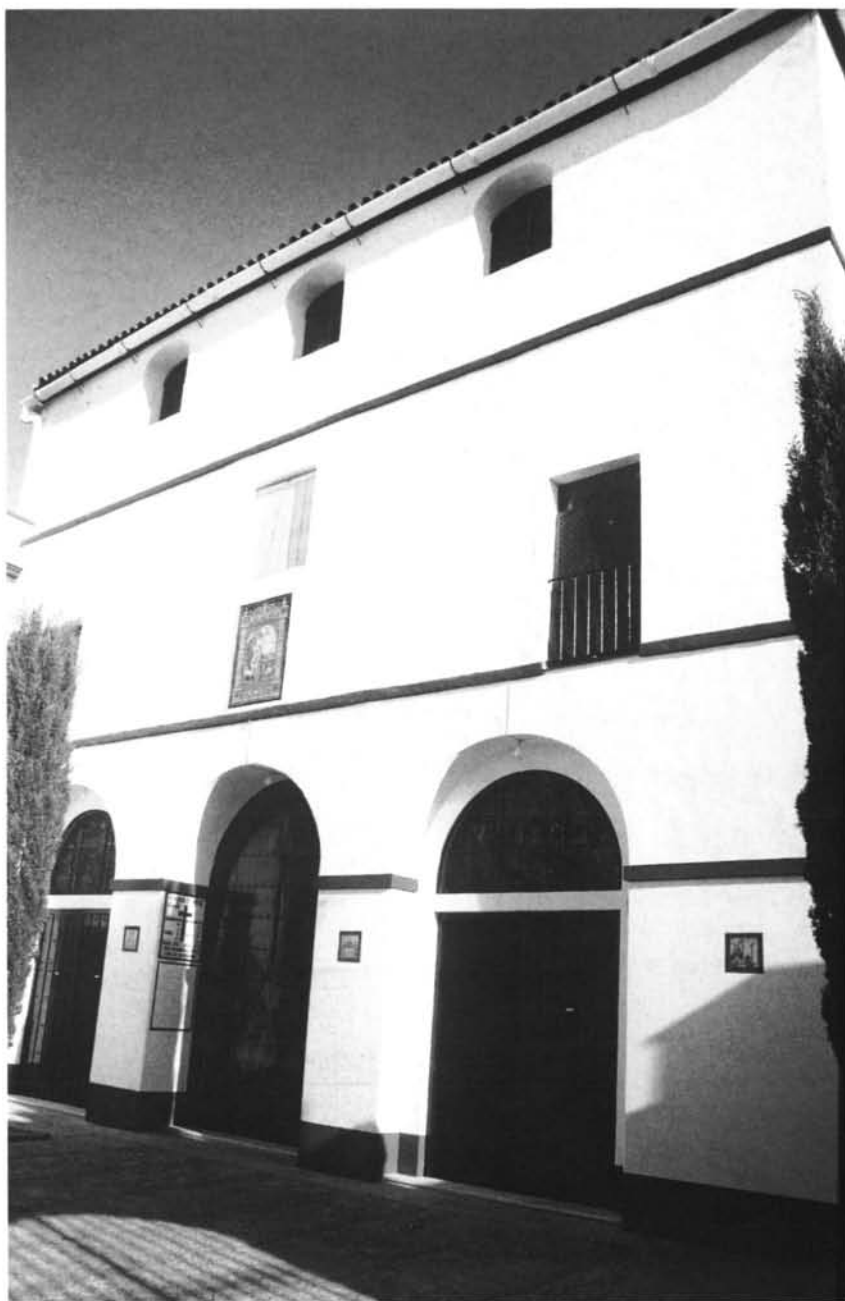
Lámina 3. Fachada de la iglesia