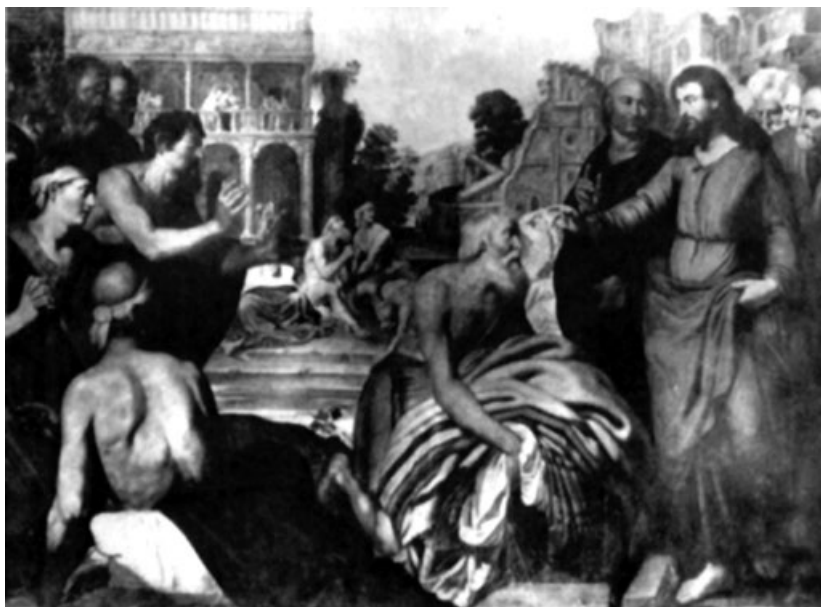
Figura 6 Artus Wolffort, La piscina de Bethesda , Poznan, Musee Narodowe.