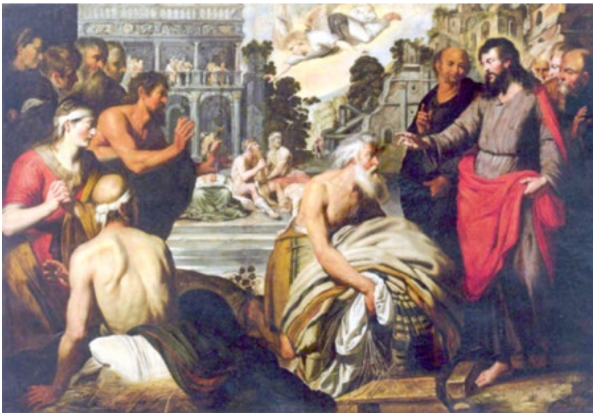
Figura 5 Artus Wolffort, La piscina de Bethesda , Londres, colección privada.