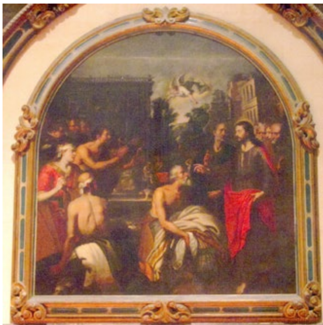
Figura 1 Artus Wolffort, La piscina de Bethesda , Sevilla, Catedral.