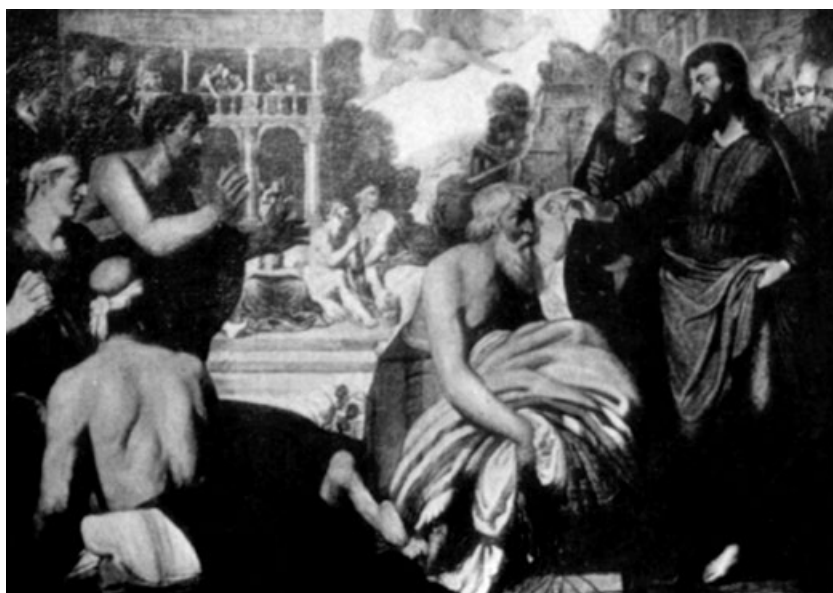
Figura 7 Artus Wolffort, La piscina de Bethesda , Londres, colección privada.