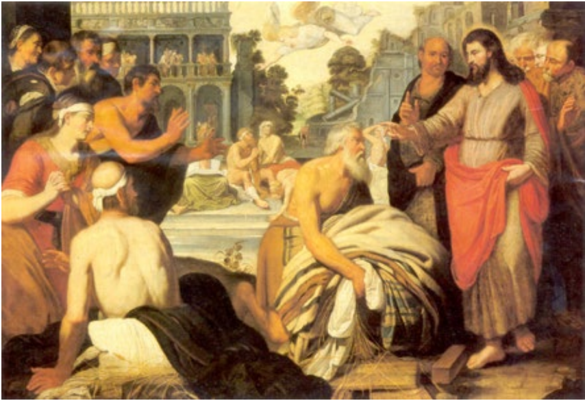
Figura 4 Artus Wolffort, La piscina de Bethesda , Londres, colección privada.