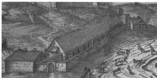
Foto 2: Joris HOEFNAGEL, Qui non ha visto Sevilla , ca. 1565, grabado calcográfico en J. Braun, Civitatis Orbis Terrarum , Colonia, 1598, t. V, p. 7. Detalle con faenas de burla en el encierro