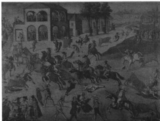
Foto 5: Anónimo, Encierro en el matadero sevillano, ca. 1770, ó/l. Madrid, colección particular (Apud. Morales Marín, J. L., Los toros en el arte . Madrid, 1987, p. 59)