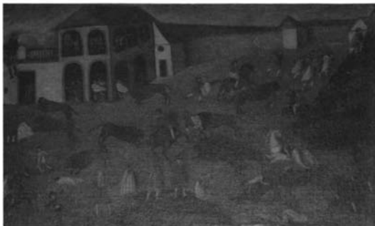
Foto 7: Anónimo, Encierro en el matadero sevillano , ca. 1770. Sevilla, colección particular