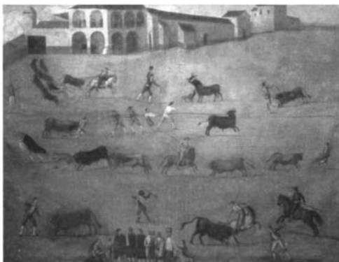
Foto 4: Anónimo, Escena de amarre en el matadero sevillano , ca. 1750, ól/l. Sevilla, colección particular. (Apud: L. Toro Buiza [1947] (2002), p. 157.)