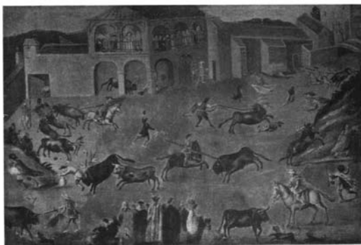
Foto 6: Anónimo, Encierro en el matadero de Sevilla , ca. 1780, ó/l. Colección L. Pickman (Apud: J. M. Cossío (1943), vol. II, p. 50.)