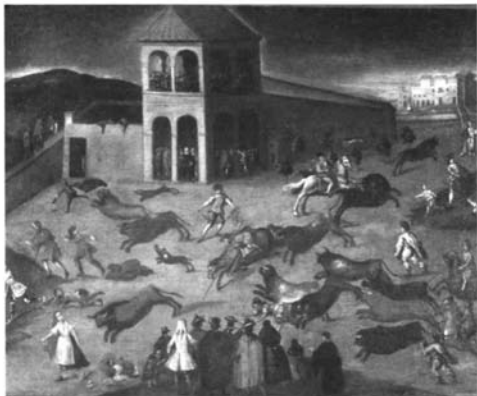
Foto 3: Anónimo, Escena de encierro en el matadero de Sevilla , ca. 1720, ól/l.. Ronda, Colección Real Maestranza de Caballería