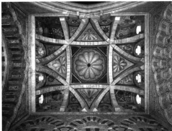
Lámina 4.- Córdoba, mezquita catedral: bóveda de nervios cruzados de la capilla de Villaviciosa

inmediata, motivaron el desmontaje de todos los retablos de la capilla y de las obras de restauración en la cubierta islámica. La intervención, dirigida por el arquitecto Felipe Saíenz de Varanda, fue muy polémica y dio lugar a numerosos problemas en los criterios de restauración que, afortunadamente, concluyeron cuando nombraron a Ricardo Velázquez Bosco arquitecto restaurador de la mezquita (1887-1923) 4 . En su primer informe y planimetría de 1891 todavía dibujó los tres altares de la capilla de Villaviciosa, pero en su proyecto de intervención de 1903, cuando abordó la restauración de esta capilla y su nave gótica, no incluyó partida presupuestaria para la cúpula porque, al parecer, dio por buena la realizada en 1881 5 (Lámina 4).