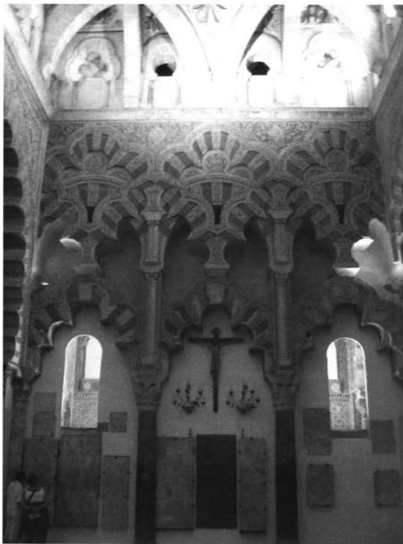
Lámina 5.- Córdoba, mezquita catedral; arquerías orientales de la capilla de Villaviciosa