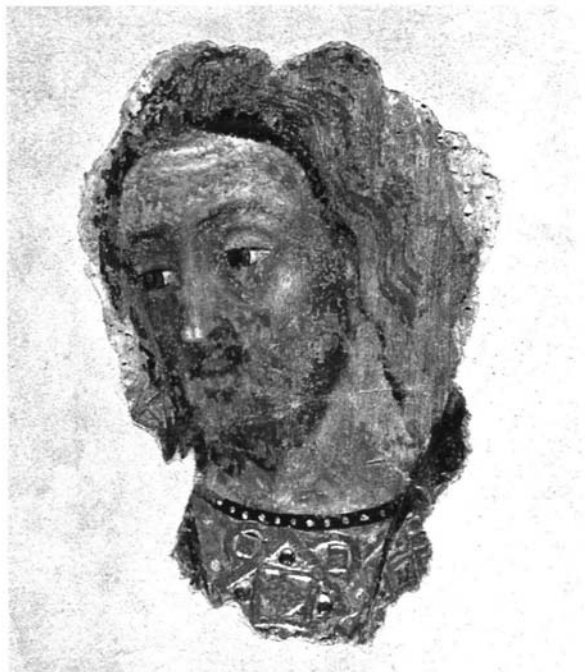
Lámina 1.- Museo de Bellas Artes de Córdoba, DO0037P. Cabeza masculina, 50 x 35 cm; procede la Capilla de Villaviciosa de la mezquita-catedral de Córdoba.

de la pintura medieval en Andalucía, destacó la temprana llegada de los modelos trecentistas a Córdoba y el interés de unos fragmentos de pintura mural gótica, conservados en el Museo de Bellas Artes de la ciudad de Córdoba (Láminas 1 y 2).