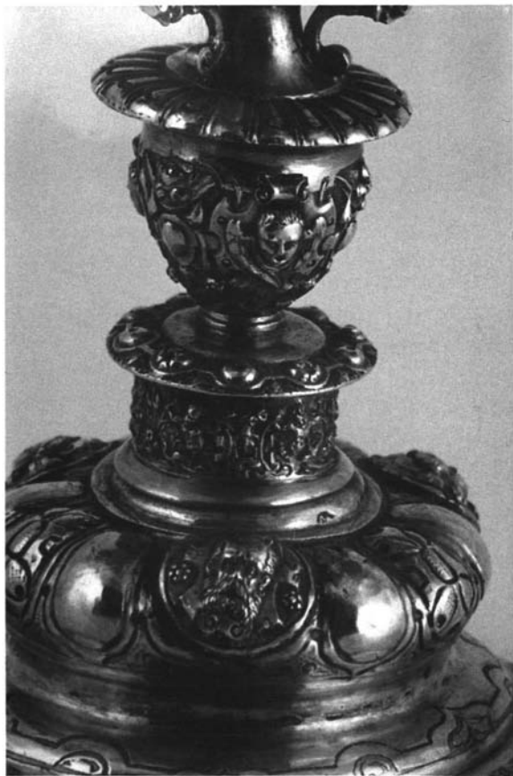
Figura 3.- Detalle, relicario de Santa Inés (Estepa). Siglo XVI