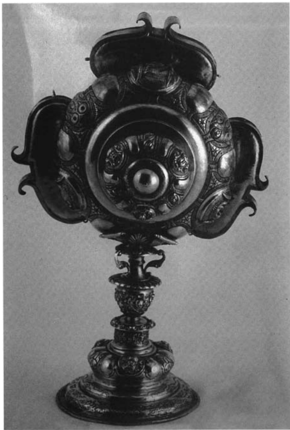
Figura 2.- Reverso. Relicario de Santa Inés (Estepa). Siglo XVI