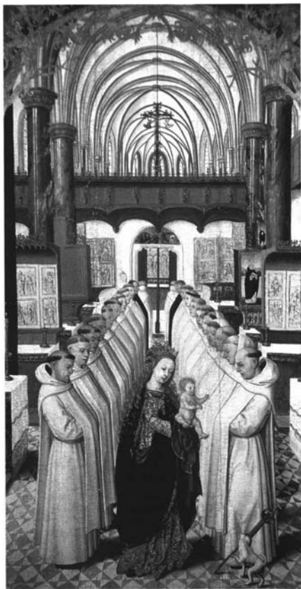
Fig. 2: AUTOR ANÓNIMO. La Virgen y el Niño entre los dominicos c. 1520. Convento de Sta. Catalina de Utrecht