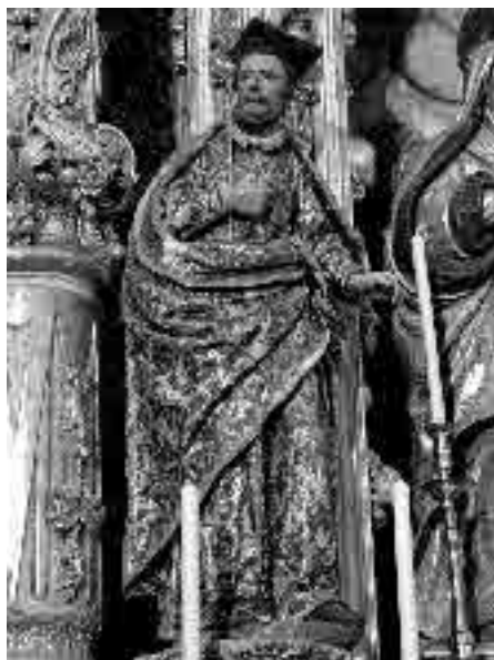
Láms. 7 y 8. Pedro Duque Cornejo y taller. San Francisco de Sales y San Felipe Neri . Retablo del Calvario. 1734-1735. Parroquia de Nuestra Señora de Consolación. Umbrete (Sevilla).