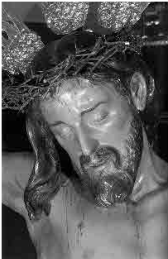
Lám. 11. Pedro Duque Cornejo. Cristo de Burgos (detalle).