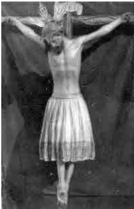
Lám. 9. Pedro Duque Cornejo. Cristo de Burgos . Segundo cuarto del siglo XVIII. Parroquia de Nuestra Señora de la Estrella. Chucena (Huelva).