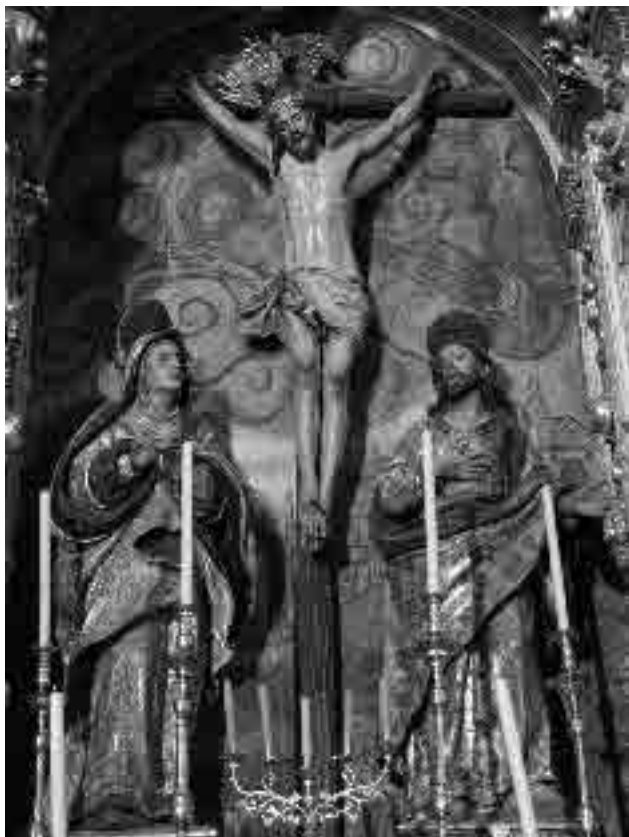
Lám. 3. Pedro Duque Cornejo y taller. Crucificado, Dolorosa y San Juan Evangelista . Retablo del Calvario. 1734-1735. Parroquia de Nuestra Señora de Consolación. Umbrete (Sevilla).