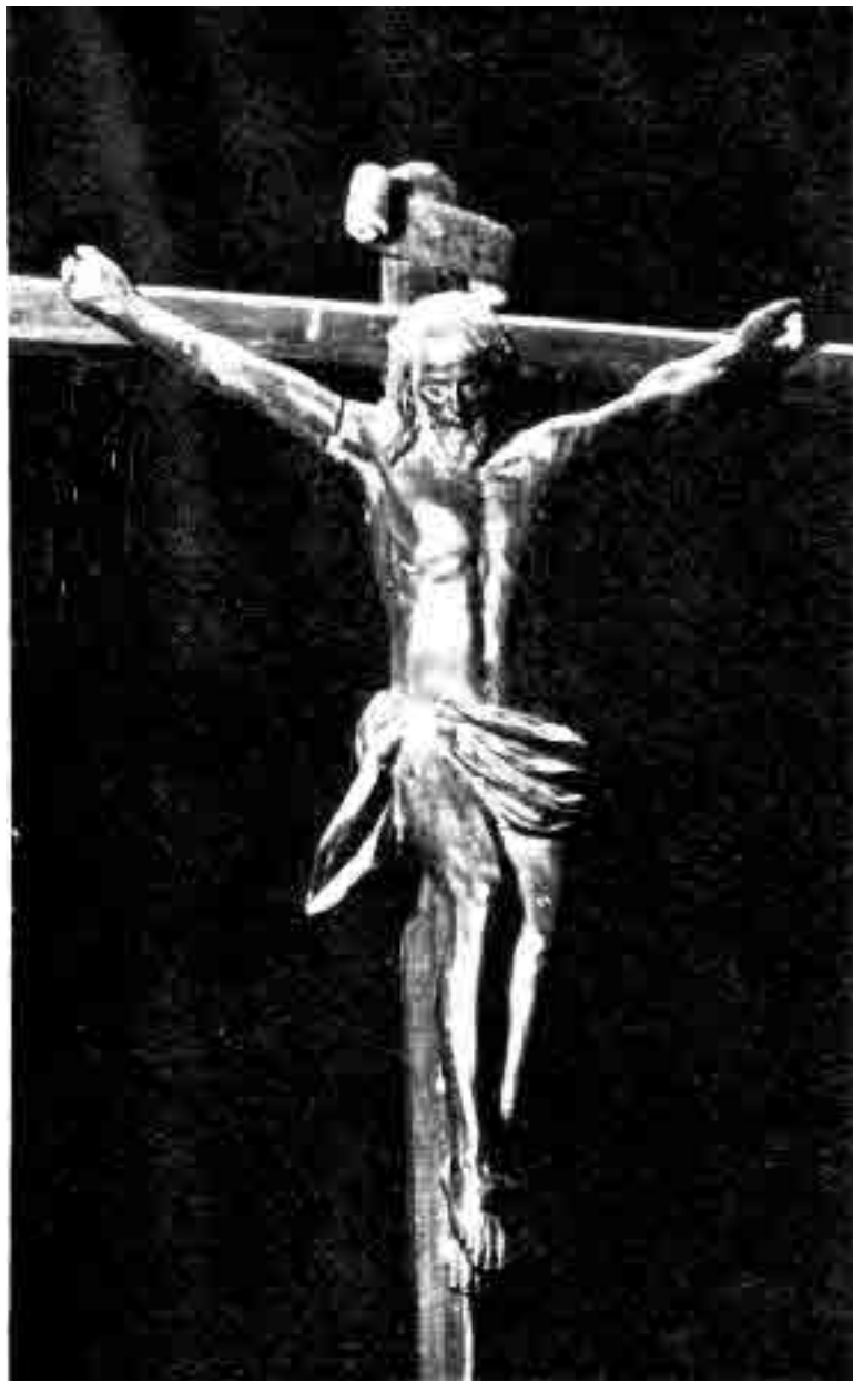
Lám. 13. Pedro Duque Cornejo. Crucificado . Hacia 1754-1757. Facistol de la sillería de coro de la Catedral de Córdoba.