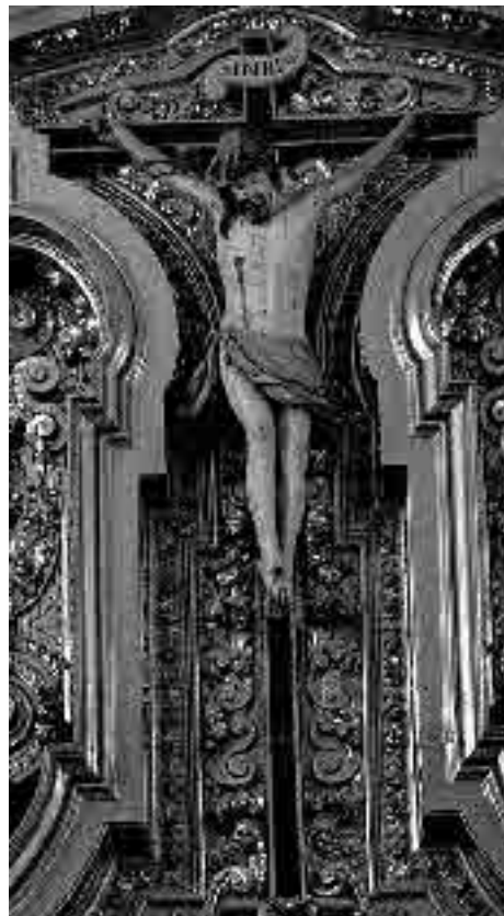
Lám. 12. Pedro Duque Cornejo y taller. Crucificado . Hacia 1752. Retablo mayor de la parroquia de San Andrés. Córdoba.