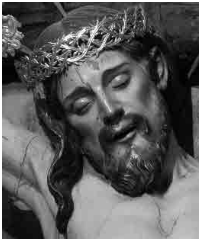
Lám. 4. Pedro Duque Cornejo y taller. Crucificado (detalle) . Retablo del Calvario. Umbrete.