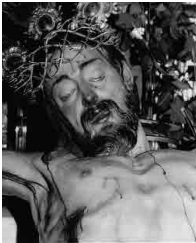
Lám. 2. Pedro Duque Cornejo. Cristo de la Sangre (detalle).