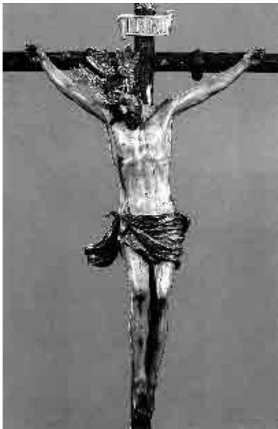
Lám. 1. Pedro Duque Cornejo. Cristo de la Sangre . 1737. Santuario de Nuestra Señora de la Paz. Ronda (Málaga).