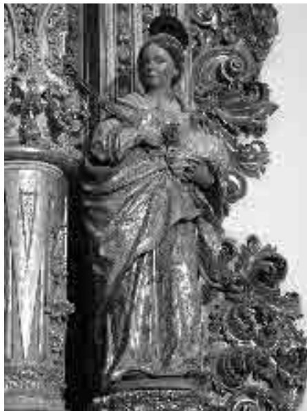
Láms. 5 y 6. Pedro Duque Cornejo y taller. Santa Teresa de Jesús y Santa Inés . Retablo de la Virgen del Rosario. 1734-1735. Parroquia de Nuestra Señora de Consolación. Umbrete (Sevilla).