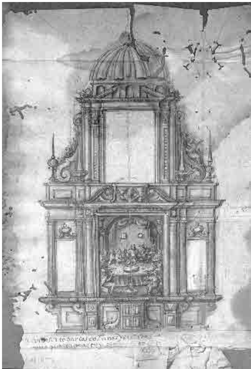
Lámina 2. Pedro Freile de Guevara. Proyecto de retablo para el Convento del Espíritu Santo. 1610. Archivo de Protocolos Notariales de Écija.