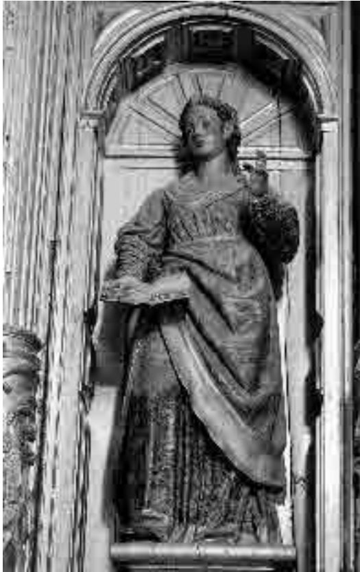
Lámina 7. Pedro Freile de Guevara. Retablo mayor del Convento de Nuestra Señora de la Merced (Santa Inés).