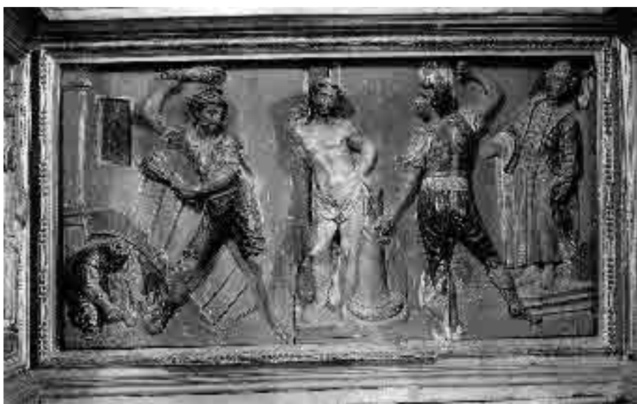
Lámina 4. Pedro Freile de Guevara. Retablo mayor del Convento de Nuestra Señora de la Merced (detalle del banco).