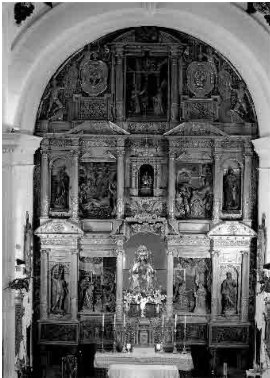
Lámina 1. Pedro Freile de Guevara, Juan de Ortuño y Felipe Vázquez de Ureta. Retablo mayor del Convento de Nuestra Señora de la Merced. 1615. Écija.