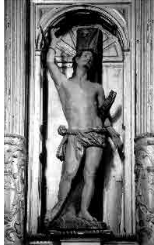
Lámina 8. Pedro Freile de Guevara. Retablo mayor del Convento de Nuestra Señora de la Merced (San Sebastián).