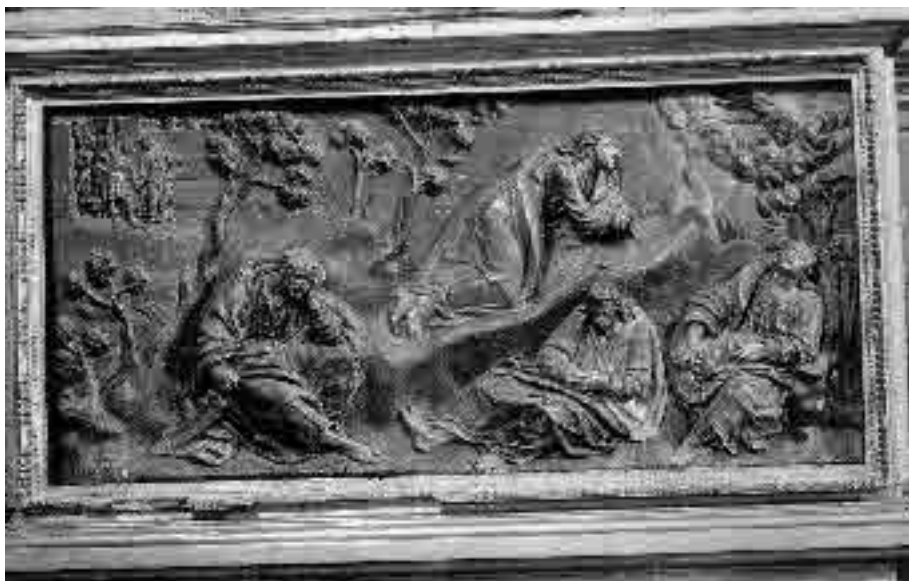
Lámina 3. Pedro Freile de Guevara. Retablo mayor del Convento de Nuestra Señora de la Merced (detalle del banco).