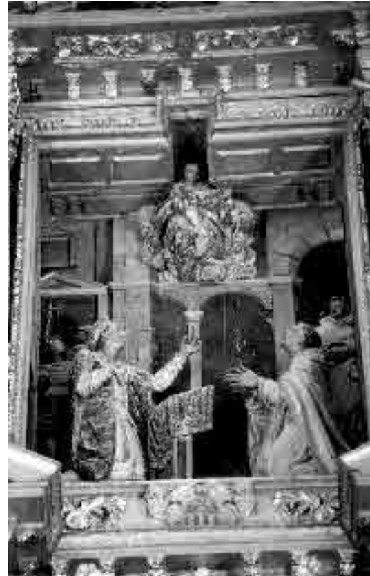
Lámina 10. Felipe Vázquez Ureta. Retablo mayor del Convento de Nuestra Señora de la Merced (Fundación de la Orden de la Merced).