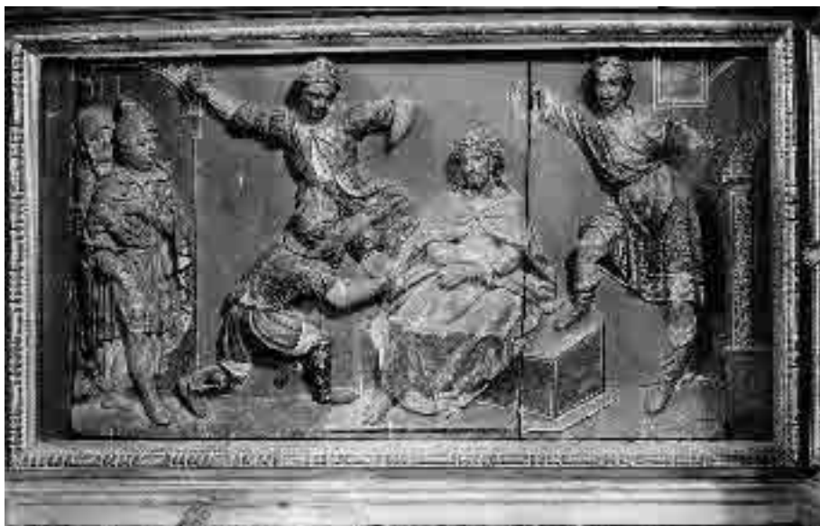
Lámina 5. Pedro Freile de Guevara. Retablo mayor del Convento de Nuestra Señora de la Merced (detalle del banco).