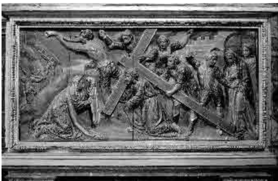
Lámina 6. Pedro Freile de Guevara. Retablo mayor del Convento de Nuestra Señora de la Merced (detalle del banco).