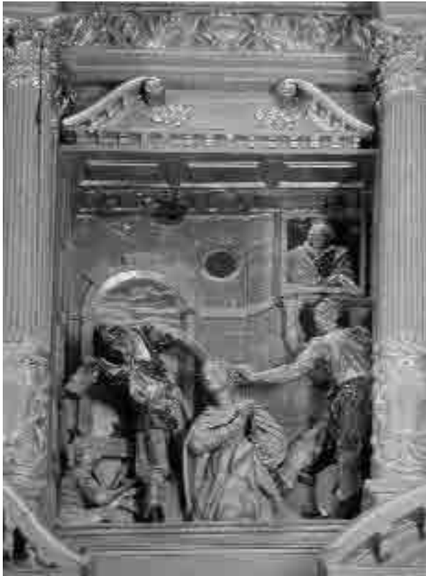
Lámina 9. Felipe Vázquez Ureta. Retablo mayor del Convento de Nuestra Señora de la Merced (Martirio de Santa Catalina).