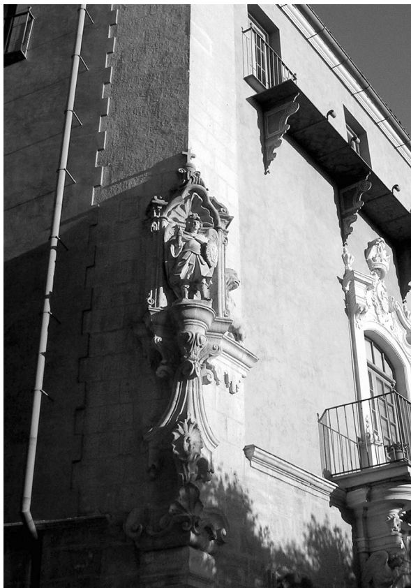
Ilustración 5: Esquina entre Empedrada y Cruz Vieja.