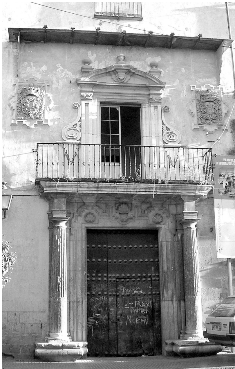
Ilustración 3: Portada a la Calle Empedrada.