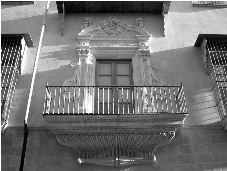
Ilustración 4: Balcón a la Calle Empedrada.