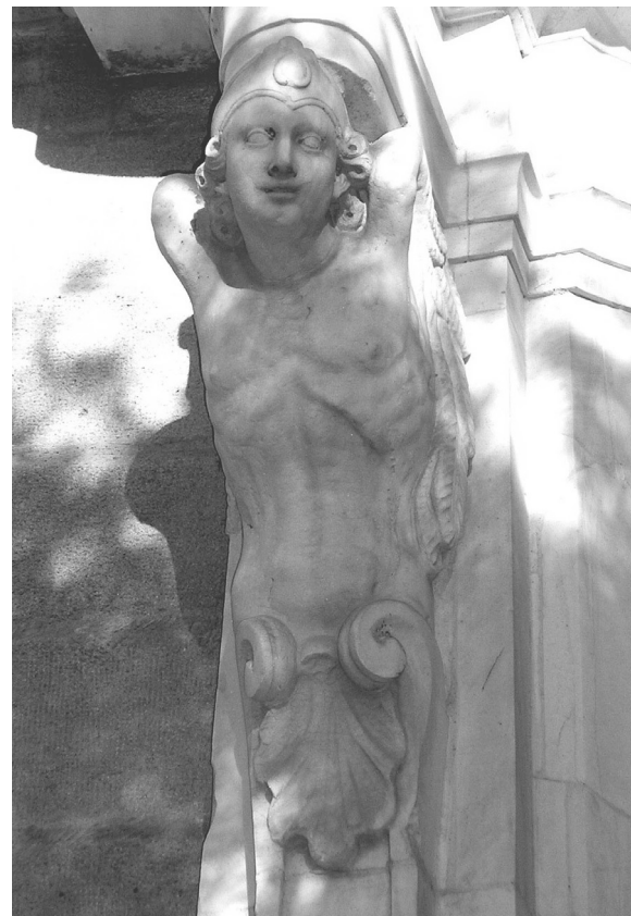
Ilustración 6: Atlante de la portada principal.