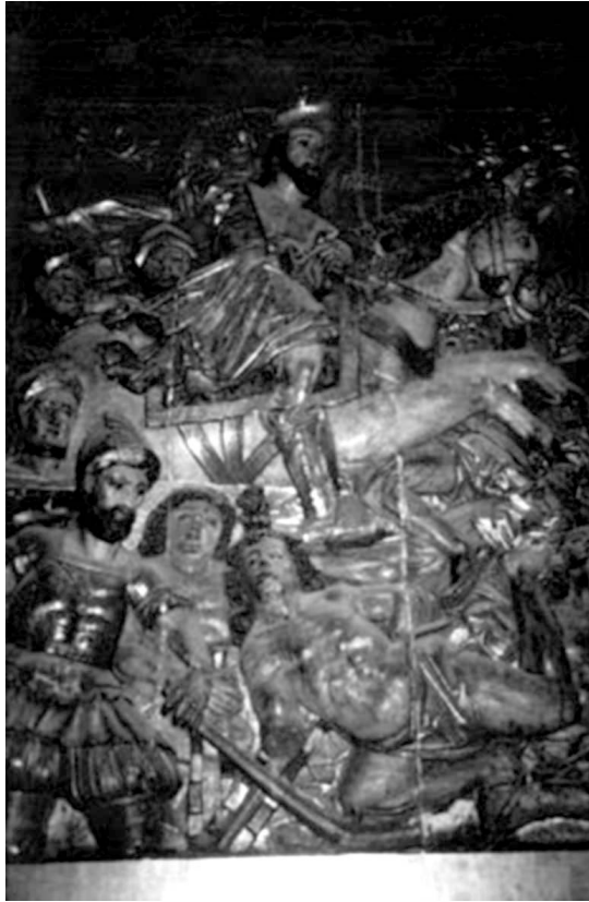
Ilustración 9. Santiago Mataindios. Retablo de Santiago de Tlatelolco. México (D.F.)