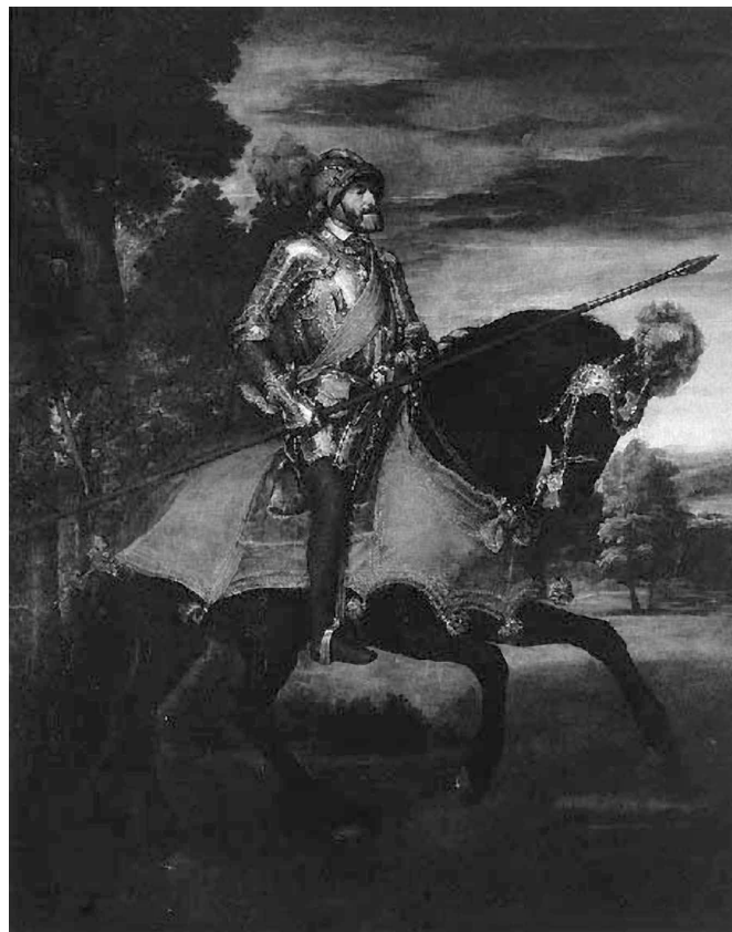
Ilustración 4. Triunfo de Carlos V en la batalla de Mühlberg por Tiziano (1548). Madrid, Museo del Prado.