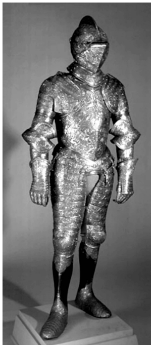
Ilustración 1. Armadura con los trabajos de Hércules y diversa figuración, perteneciente a Maximiliano II (1555). Viena, Kunsthistorisches Museum.