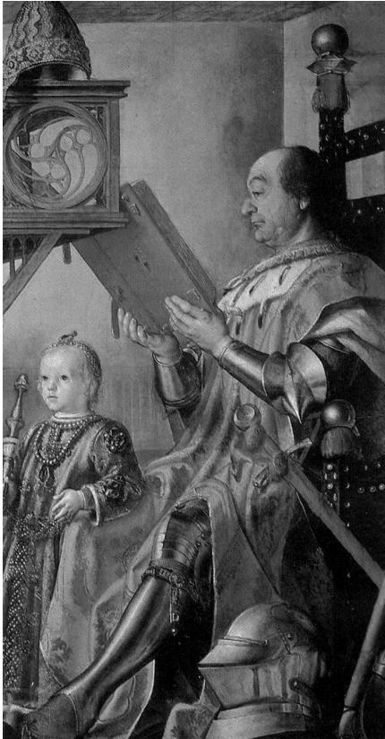
Ilustración 5. Federico de Montefeltro, Duque de Urbino por Pedro Berruguete (1480-81). Urbino, Galería Nacional de las Marcas