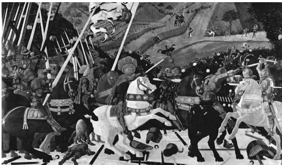
Ilustración 2. Batalla de San Romano (1450) por Paolo Uccello. Nicolás de Tolentino al frente de su tropa florentina. Londres, National Gallery.