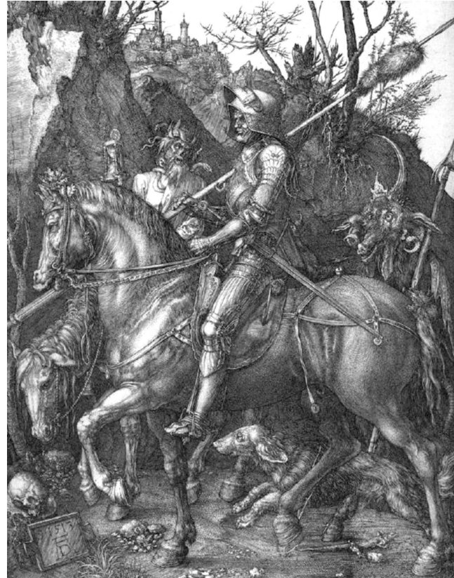
Ilustración 6. El caballero, la muerte y el diablo por Durero (1513). Museo Lázaro Galdiano de Madrid.