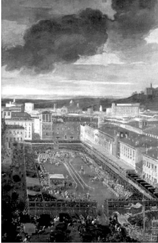
Ilustración 7. Justa celebrada el 25 de febrero de 1634 en Piazza Navona durante el carnaval (1634) por Andrea Sacchi (1599-1661). Museo de Roma. Roma, Palazzo Braschi.