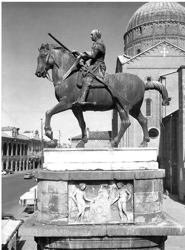
Ilustración 3. Gattamelata por Donatello (1447-1453). Padua, Plaza del Santo.