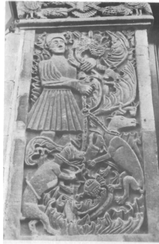
Ilustración 8. El hombre que mató al animal. Puebla (México).