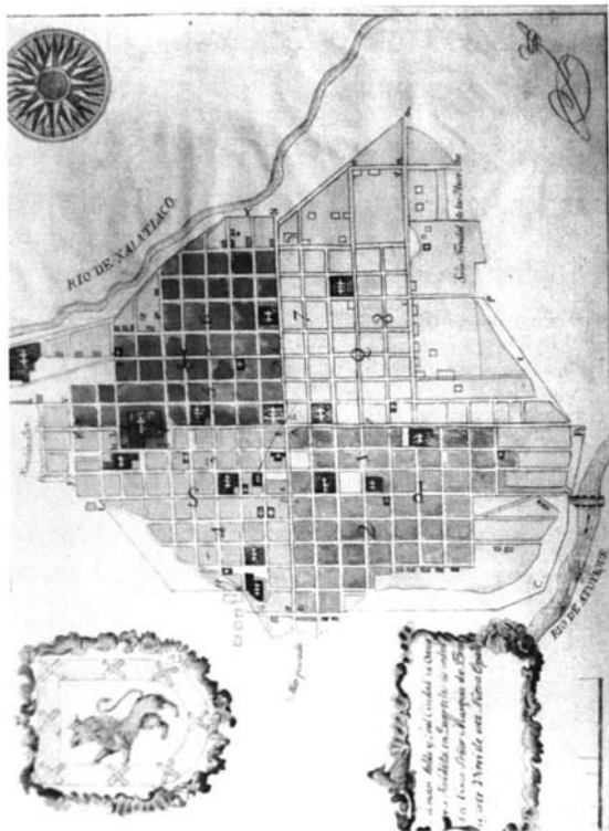
Figura 1. Plano de la ciudad de Oaxaca.