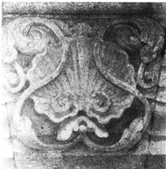
Figura 4. Portada de la casa de Hernán Cortés. Detalle de la concha.