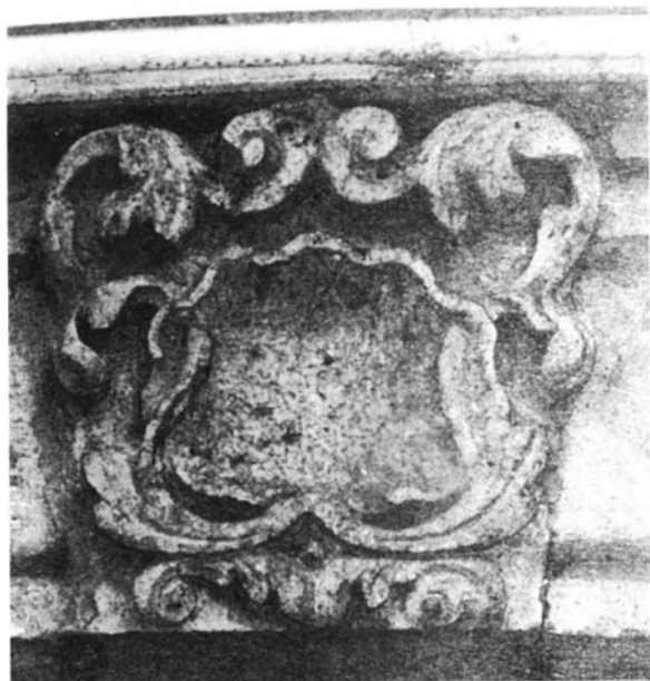
Figura 5. Concha en la puerta de la casa en la calle de Morelos y Alcalá.