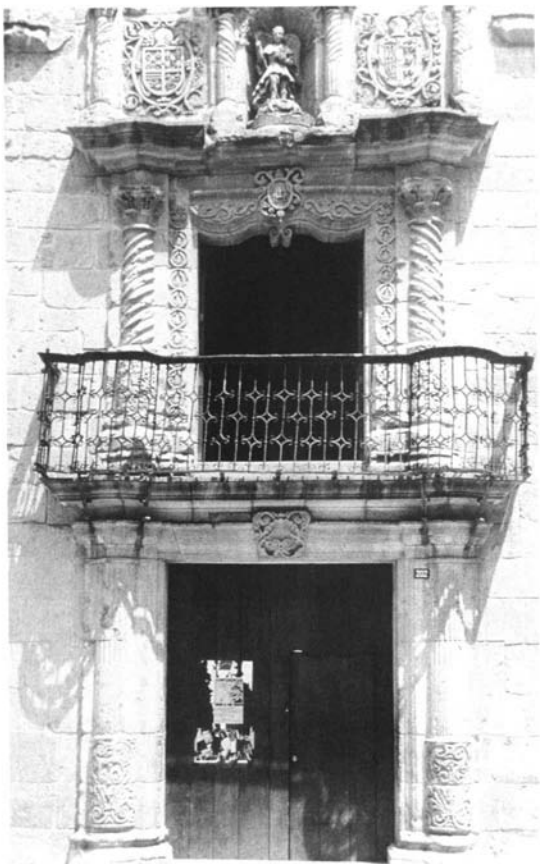
Figura 3. La llamada "casa de Hernán Cortés". Oaxaca.