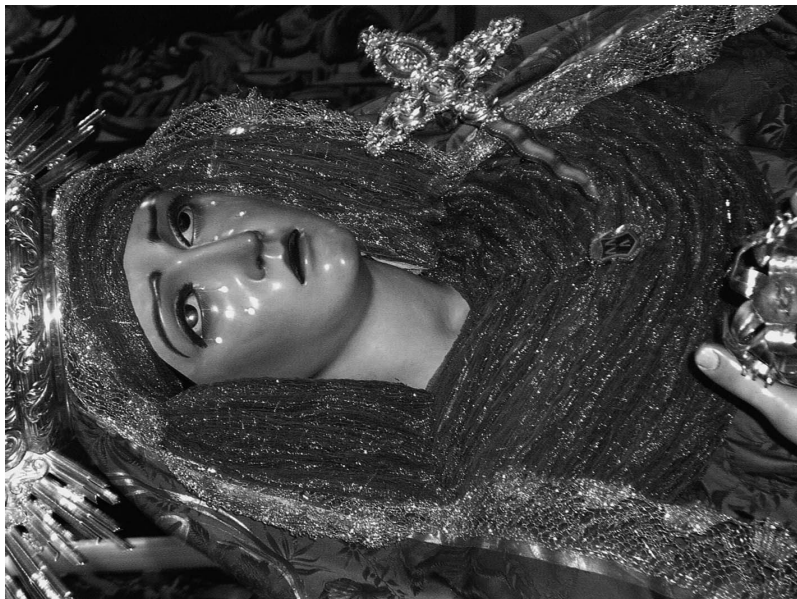
Figura 9. Ntra. Sra. del Amor.