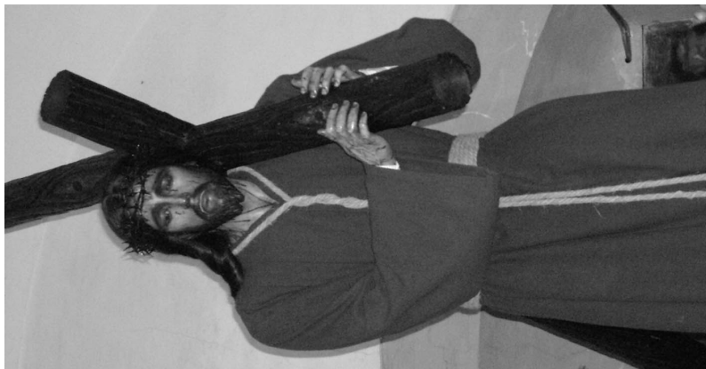
Figura 12. Ntro. Padre Jesús del Silencio.