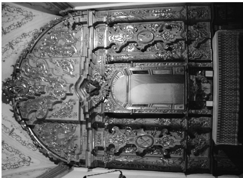
Lám. 11. Retablo de Ntro. Padre Jesús del Silencio.