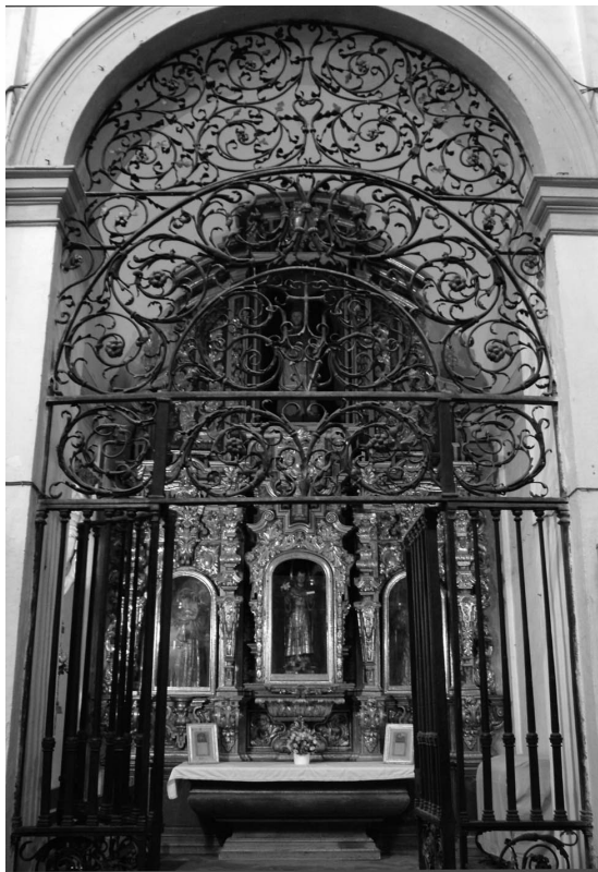
Figura 8. Capilla de San Antonio de Padua.