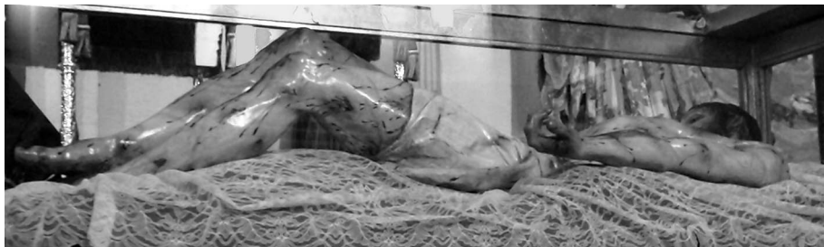
Figura 6. Cristo del Santo Entierro.