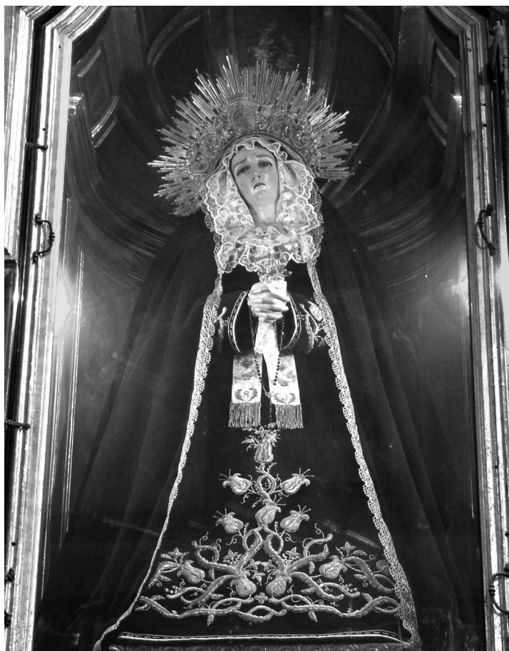
Figura 7. Ntra. Sra. de la Soledad.