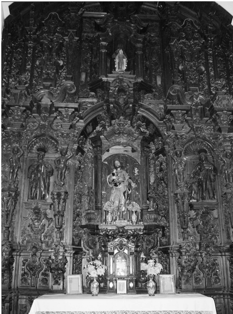
Figura 13. Retablo de San José.