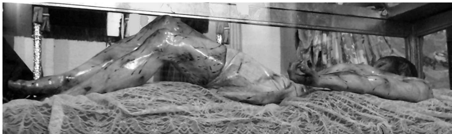
Figura 6. Cristo del Santo Entierro.