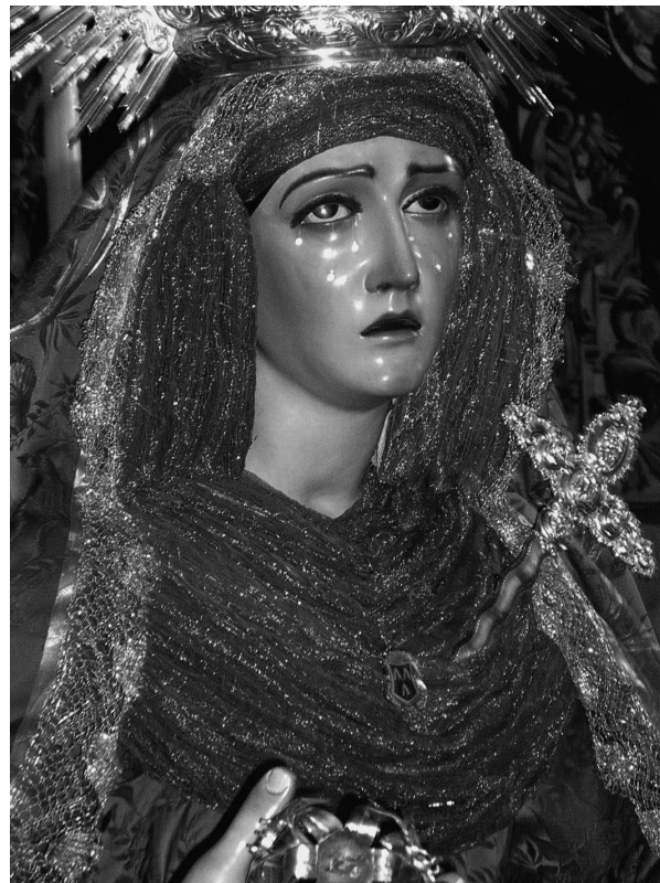
Figura 9. Ntra. Sra. del Amor.