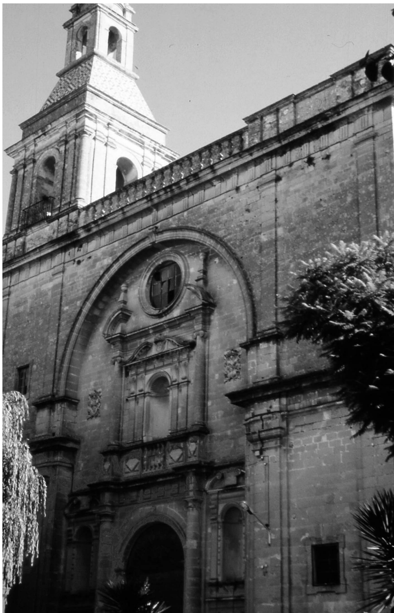
Figura 1. Exterior de la iglesia de San Francisco.