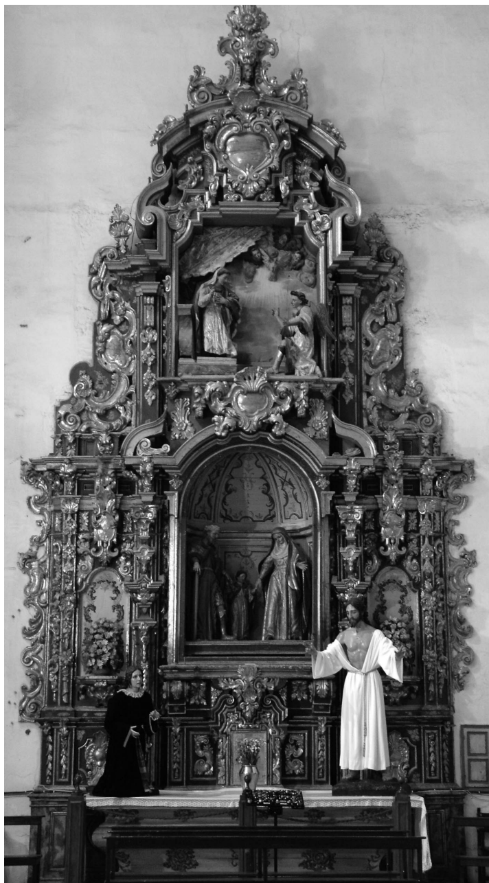
Figura 4. Retablo de la Sagrada Familia de la Virgen.