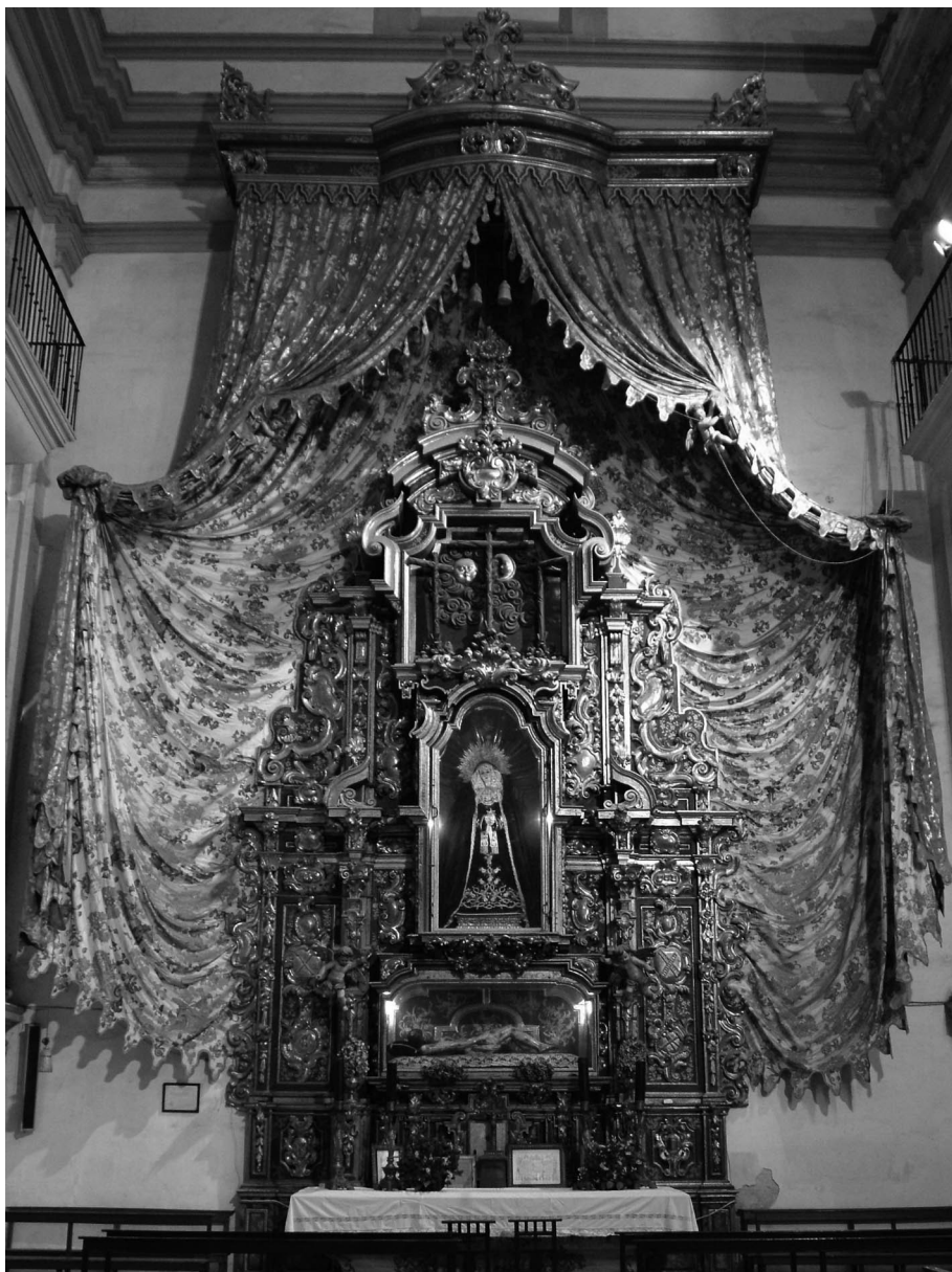
Figura 5. Retablo del Santo Entierro.