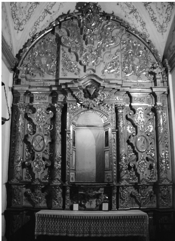
Lám.11. Retablo de Ntro. Padre Jesús del Silencio.