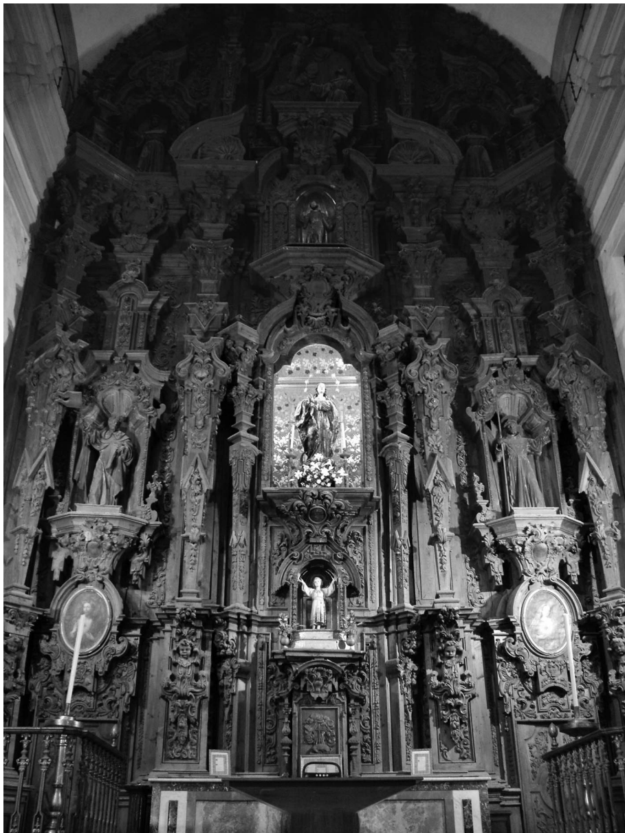
Figura 3. Retablo mayor.