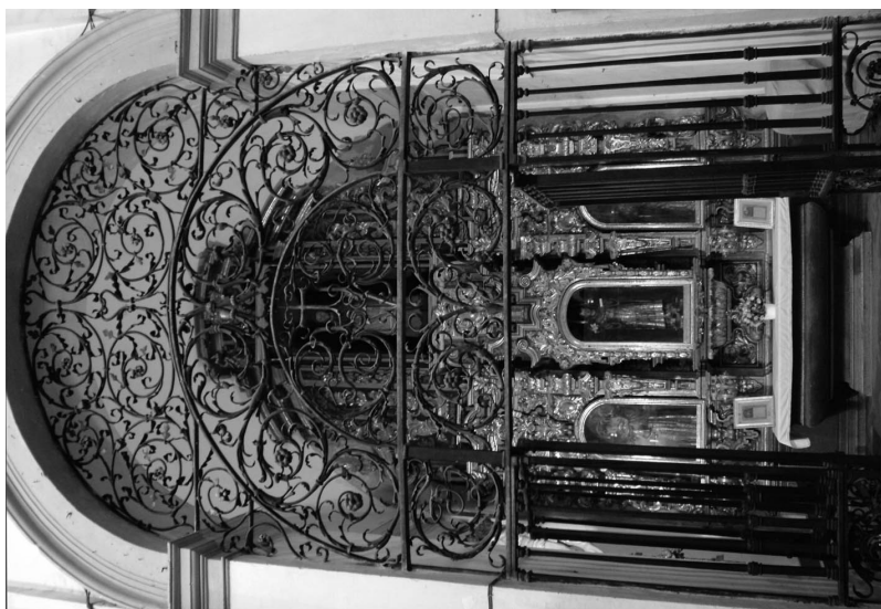
Figura 8. Capilla de San Antonio de Padua.