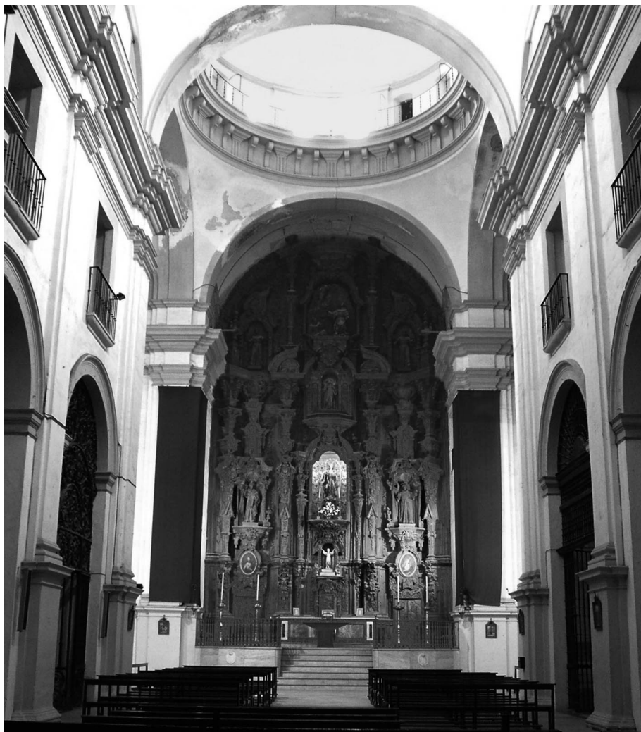
Figura 2. Interior hacia la capilla mayor.