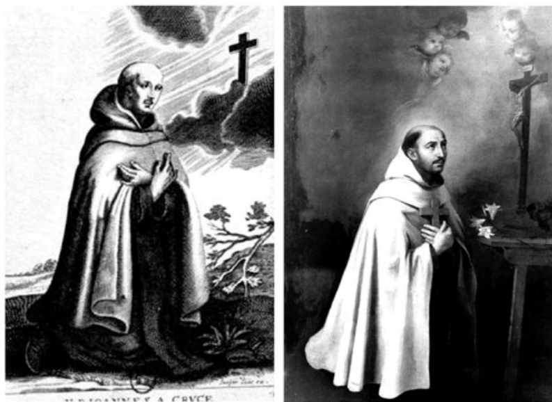
Figura 7. Verdadero retrato de san Juan de la Cruz . Estampa de Jaspar Isaac, Gabinete de Estampas de París, y pintura del Colegio de las Hermanas Inglesas de Brujas. Segundo cuarto del siglo XVII.