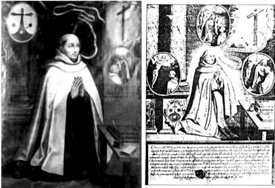
Figura 9. Retrato de san Juan de la Cruz, Carmelitas de México, y estampa de la que deriva inserta en el Manuscrito 12738 , Biblioteca Nacional, Madrid.