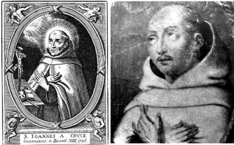
Figura 6. Verdadero retrato de san Juan de la Cruz . Estampa anónima derivada de la grabada por Cornelis van Merlen, Instituto Histórico del Teresianum de Roma (c. 1726) y Retrato de París , del primer cuarto del siglo XVII.