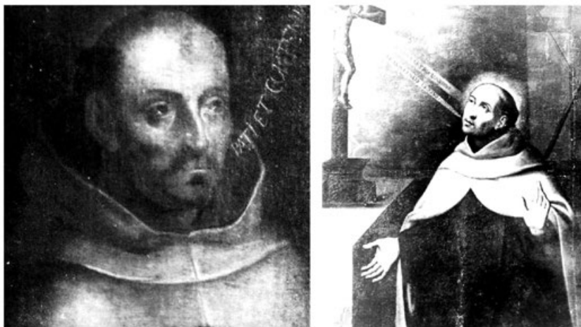
Figura 8. Verdadero retrato de san Juan de la Cruz asociado al Diálogo de Segovia . Ejemplares de los conventos de Carmelitas de Ypres y Valladolid. Primera mitad del siglo XVII.