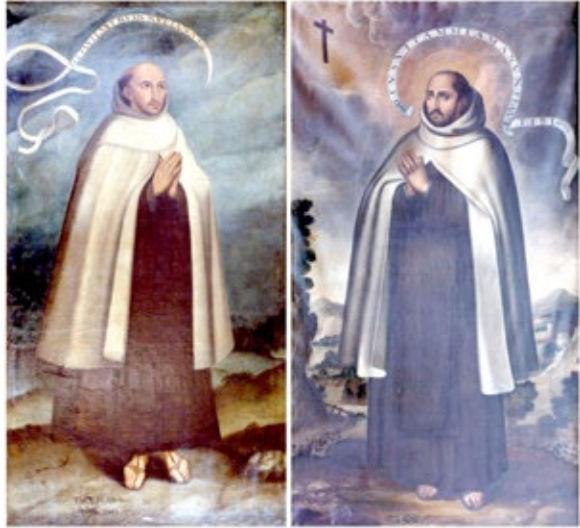
Figura 1. Verdadero retrato de san Juan de la Cruz . Siglo XVII. Ejemplares del Museo de MM.CC.DD. de Úbeda, Jaén y del Convento de San José, MM.CC.DD. “Las Teresas”, Sevilla .