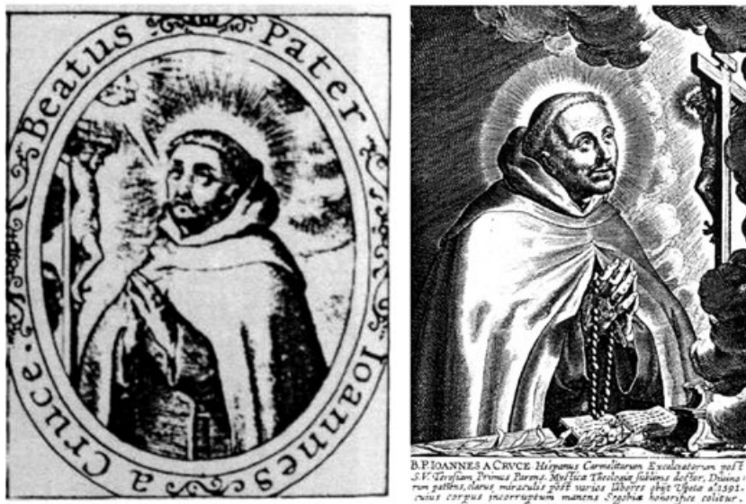
Figura 4. Anton Wierix III, Fragmento del Retrato de santa Teresa y san Juan de la Cruz y San Juan de la Cruz orando ante un crucifijo . c. 1622. Gabinete de Estampas de París.