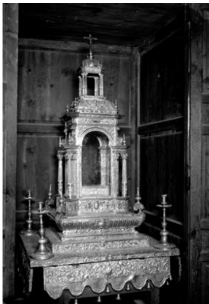
Figura 6. Josep Segers. Andas del Santo Cáliz (1691) (Desaparecida).