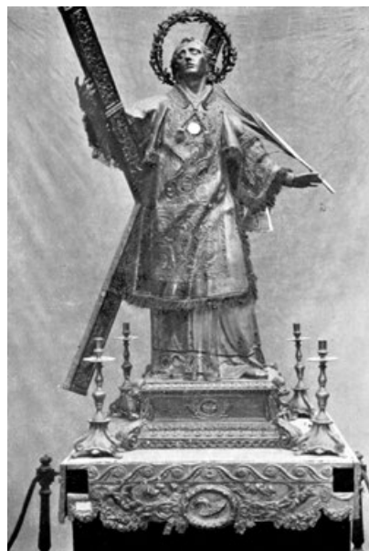
Figura 7. Bernardo Quinzà y Josep Carles Quinzà: Imagen (1800) y bambalinas de las andas (1806) de san Vicente Mártir (Desaparecidas).