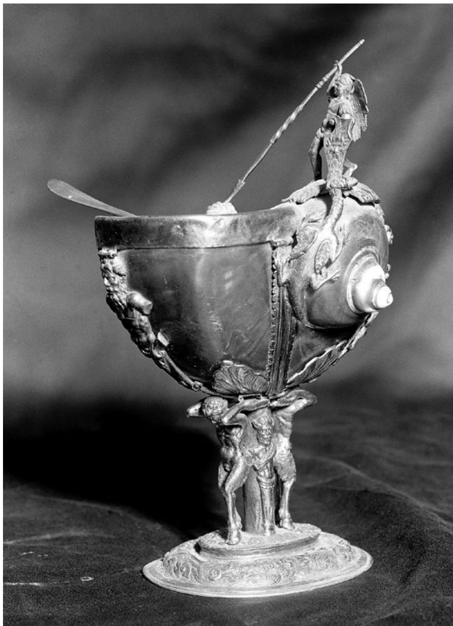
Figura 4. Anónimo alemán. Naveta del caracol (ca. 1560) (Desaparecida).