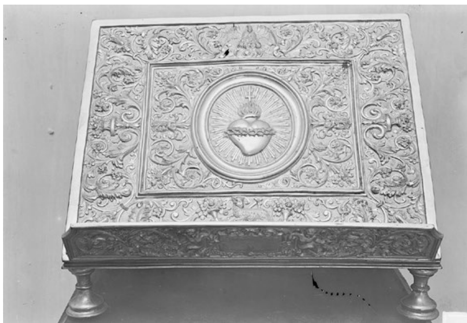
Figura 10. Anónimo. Atril ca. 1850 (Desaparecido).