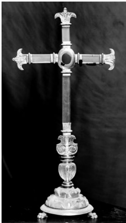
Figura 5. Anónimo italiano. Cruz-relicario de cristal de roca (ca. 1580) (Desaparecida).