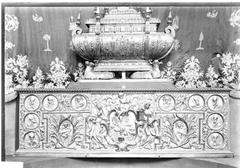
Figura 8. Anónimo romano. Frontal de Rocabertí (ca. 1677) y Lluís Puig. Urna del Monumento (1630) (Desaparecidas).