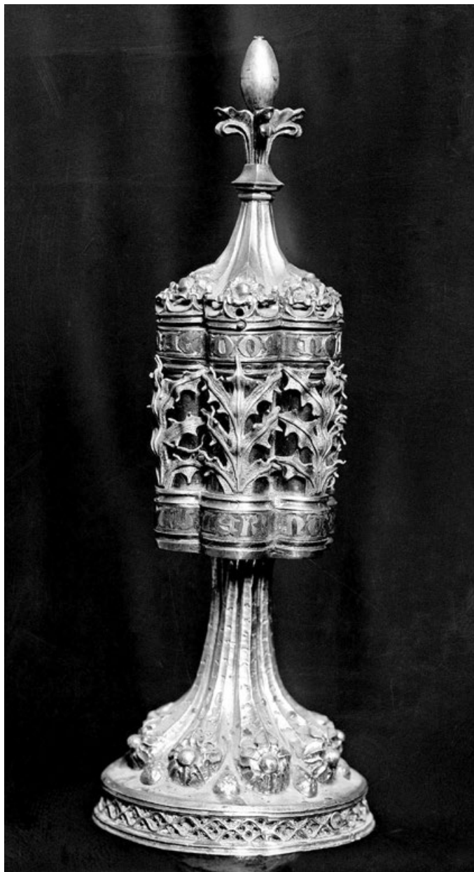
Figura 1. Anónimo alemán. Relicario de la Mirra (ca. 1460) (Desaparecido).