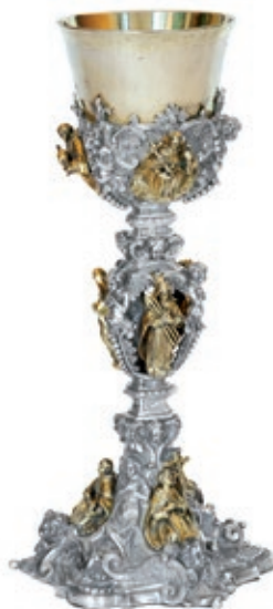
Figura 9. Anónimo napolitano. Cáliz de Rocabertí (Último cuarto del XVII) (Monasterio de Santa María de Gratia Dei (Zaidía). Benaguasil (Valencia).