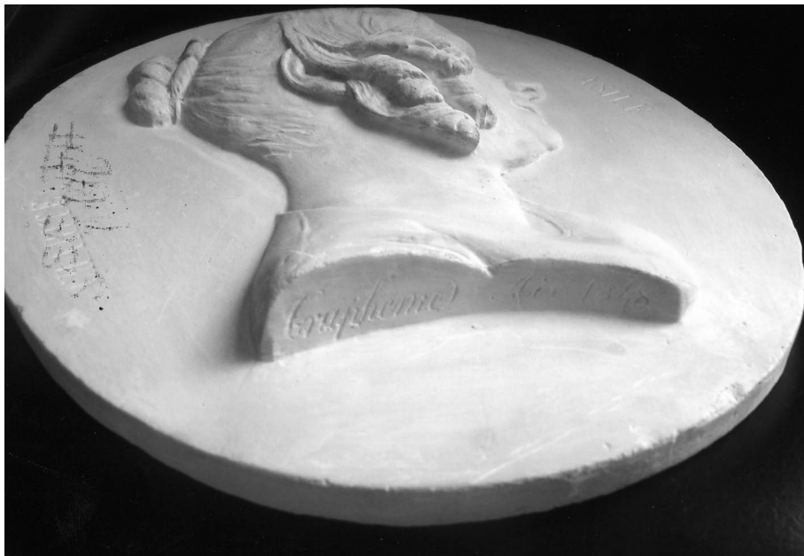
Figura 4. Firma "Trupheme Aix 1848".