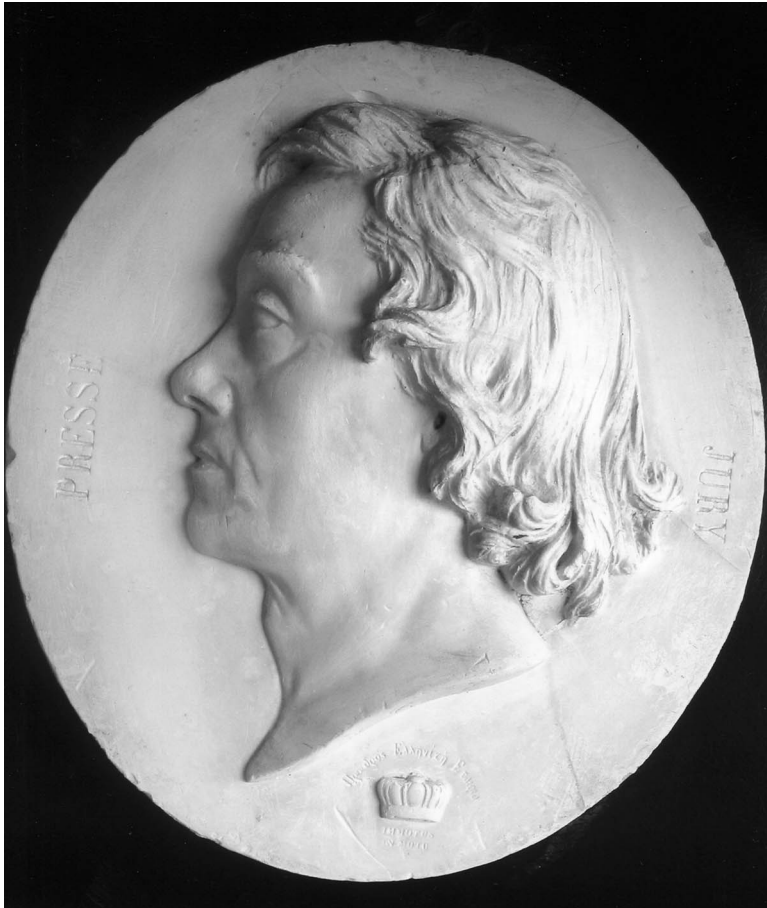
Figura 1. Retrato de caballero.