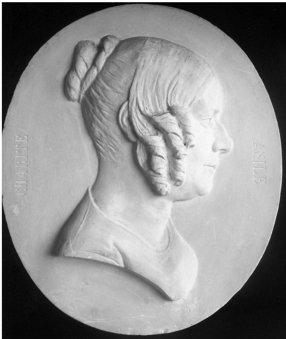
Figura 2. Retrato de dama.