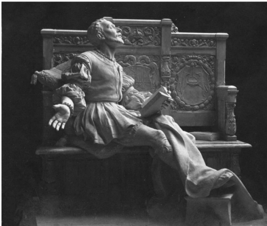
Figura 1. La Conversión de San Ignacio. 1921.