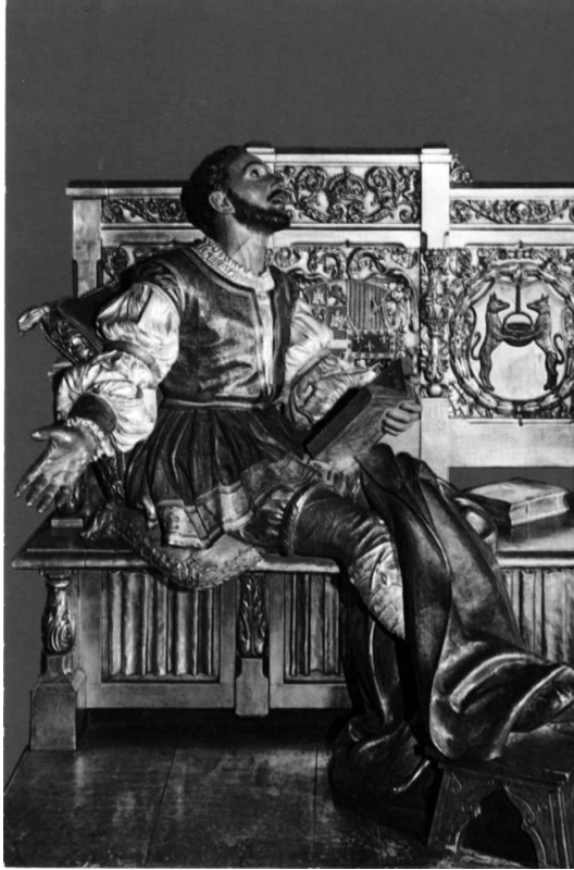
Figura 4. La Conversión de San Ignacio. 1921.