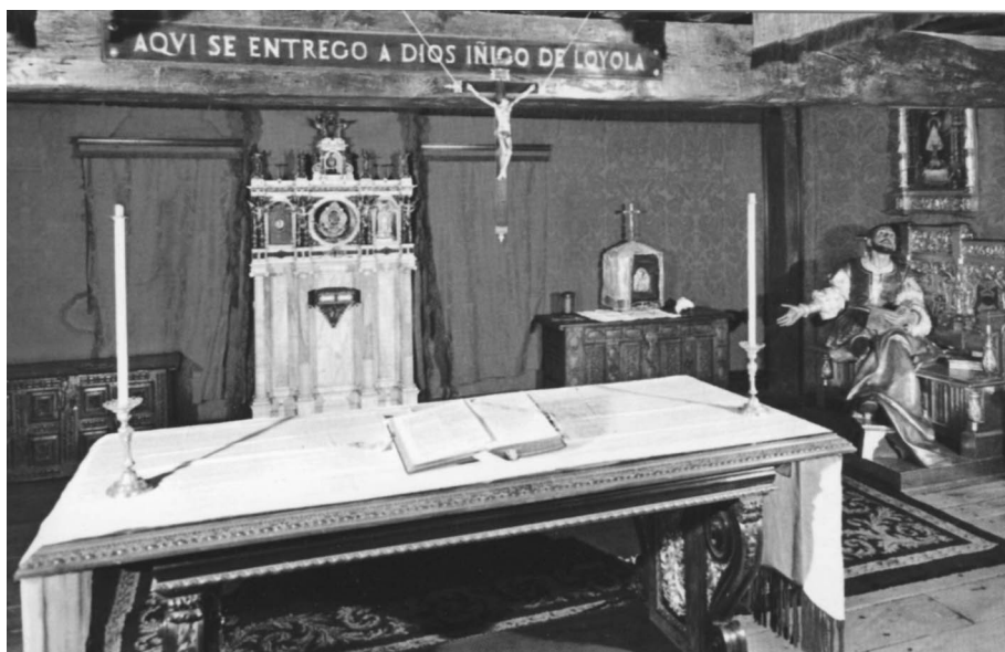
Figura 3. Capilla de la Conversión en la Santa Casa de Loyola.