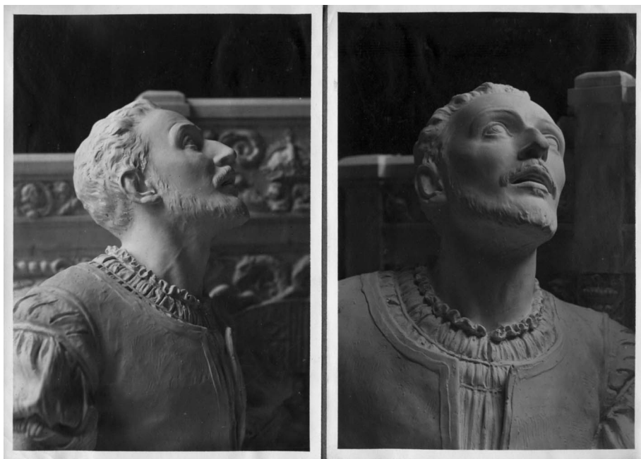
Figura 2. La Conversión de San Ignacio. 1921. Detalles del rostro.