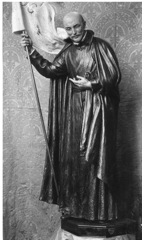
Figura 7. San Ignacio abanderado. Talla definitiva en ébano y limoncillo. 1922. Sala de recepción de peregrinos en el Santuario de Loyola.