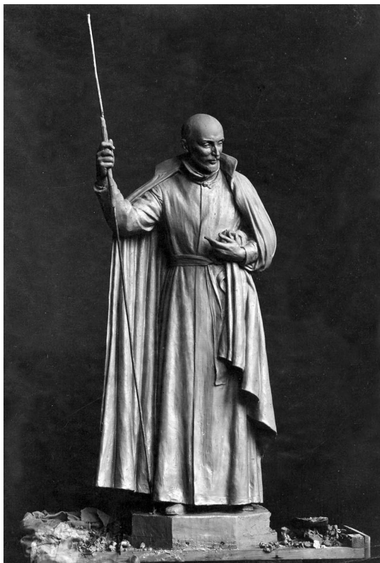
Figura 6. San Ignacio abanderado. Modelo definitivo en barro. 1922.