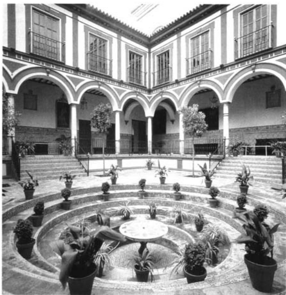
Fig. 1. Hospital de los Venerables. Patio principal