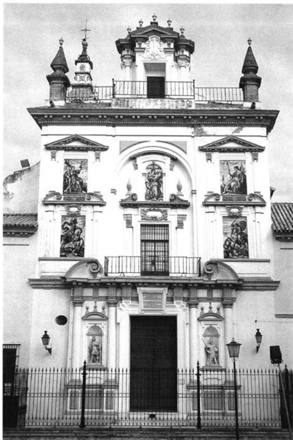
Fig. 3. Iglesia del Hospital de la Caridad. Fachada