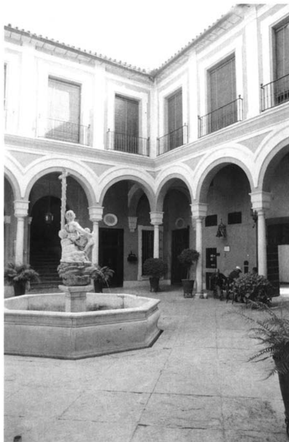
Fig. 4. Patio del Hospital de la Caridad