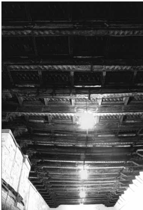
Figura 13. Dependencia claustral conservada en la actual bodega.