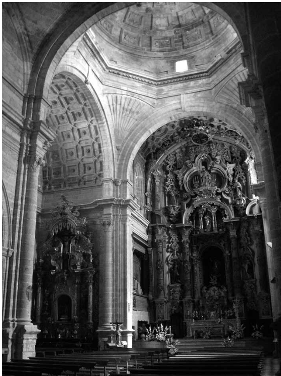
Figura 9. Interior de la iglesia.