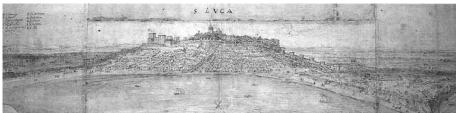
Figura 1. Plano de Sanlúcar de Barrameda, de Antón Van den Wyngaerde, 1567. Ashmolean Museum, Oxford. El convento de Santo Domingo aparece con la letra A, cercano a la costa y rodeado de algunas viviendas.

Fecha de aceptación: 21 de enero de 2011