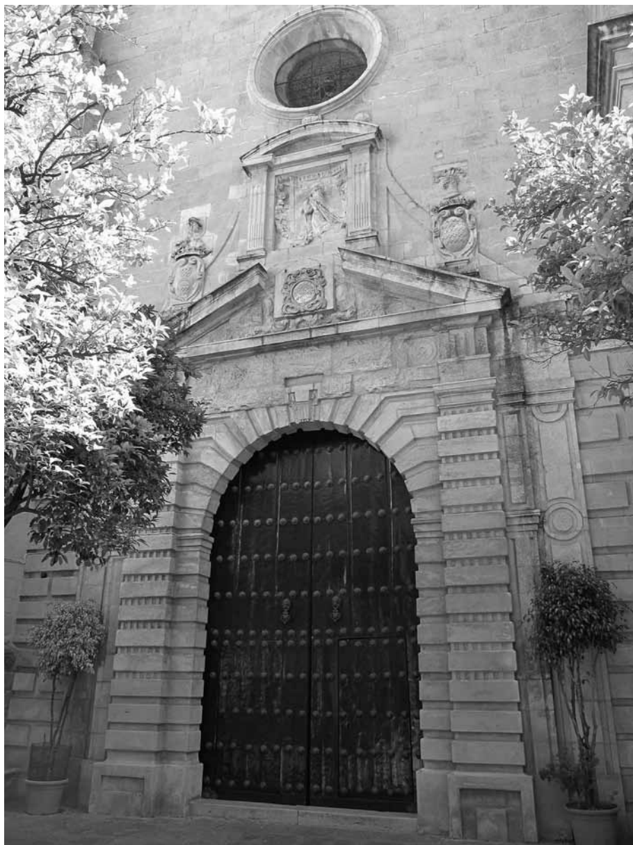
Figura 12. Portada de ingreso.