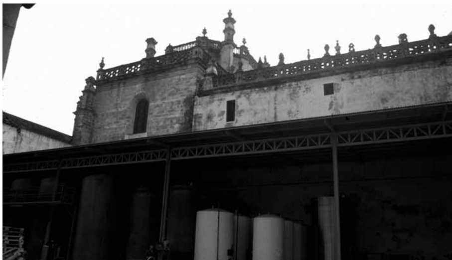
Figura 3. Espacio donde se ubicaba el claustro, hoy convertido en patio de la Bodega Herederos de Argüeso.