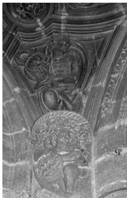
Figura 7. Enjuta de la bóveda del sotocoro. Ménsula de tenante de escudo y figura varonil guerrera.