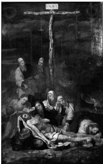
Figura 2. Pedro de Campaña. Piedad , 1556. Museo de Bellas Artes de Cádiz.