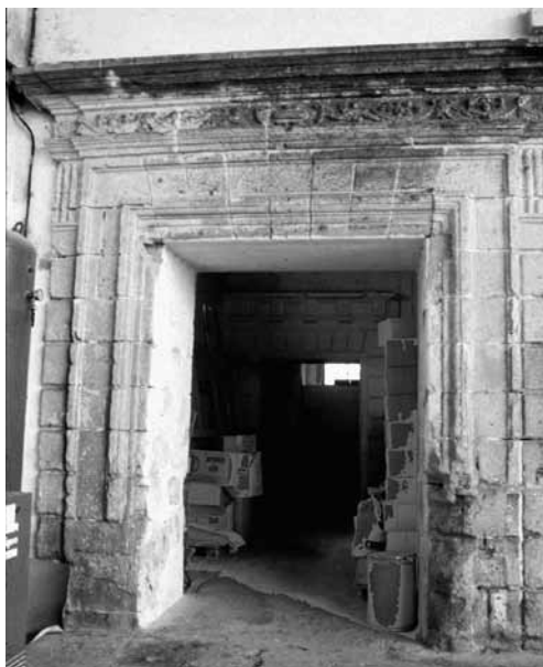
Figura 14. Portadas de cantería conservadas en la actual bodega.