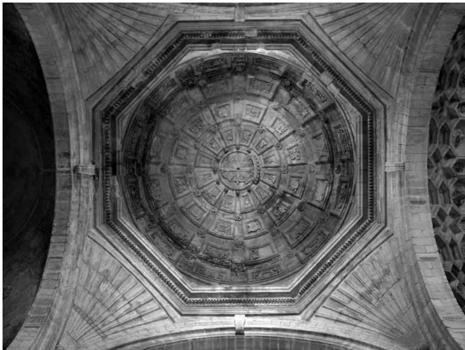
Figura 8. Bóveda del crucero