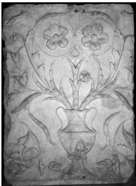
Figura 5. Francisco de Carona. Fragmento marmóreo de la fuente claustral. Ánfora con tallos y rosas.