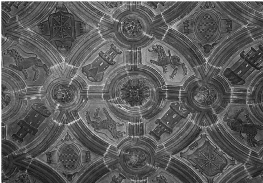
Figura 6. Bóveda del sotocoro. Detalle de la heráldica de la familia fundadora y dominicana.