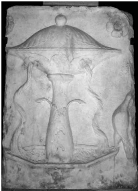
Figura 4. Francisco de Carona. Fragmento marmóreo de la fuente claustral. Fons Vital .