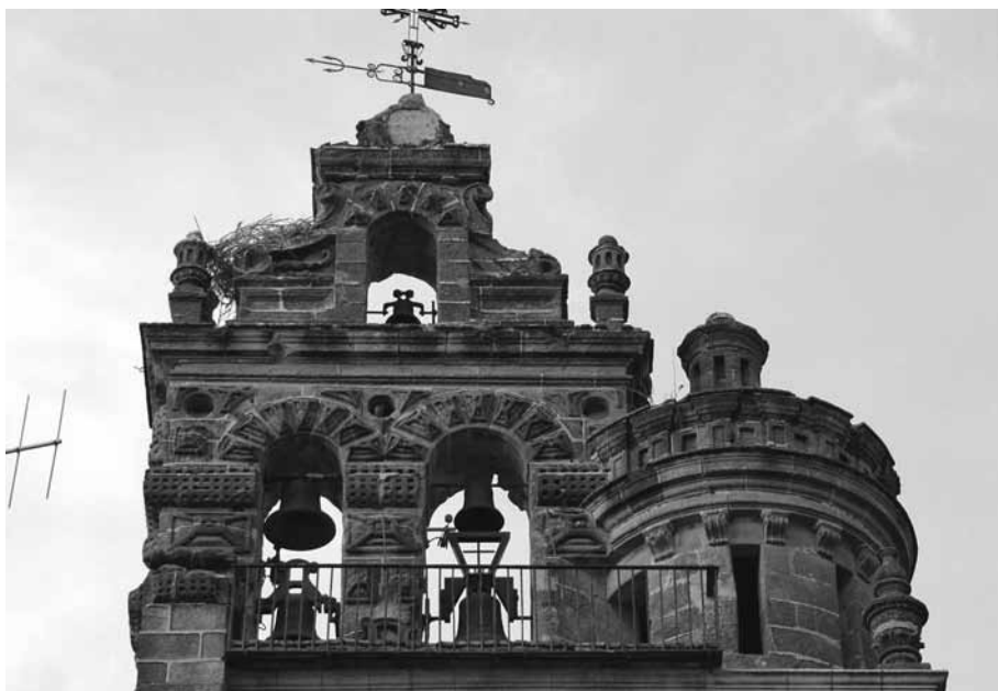
Figura 11. Espadaña y caja circular de la escalera de caracol.