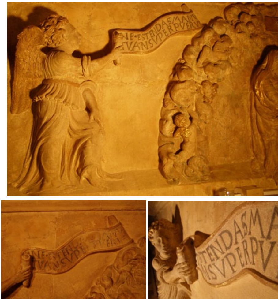
Figura 3 Ángel con filacteria de las palabras pronunciadas por Dios ante el ofrenda de Abraham durante el sacrificio de Isaac su hijo (Gen. 22, 12). Roque de Balduque. Antes y después de la última restauración.