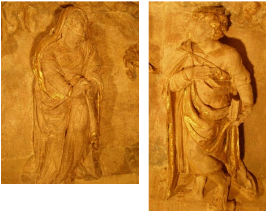
Fig. 6. San María y San Juan, R. de Balduque, Calvario del Cabildo de las Casas Capitulares de Sevilla.