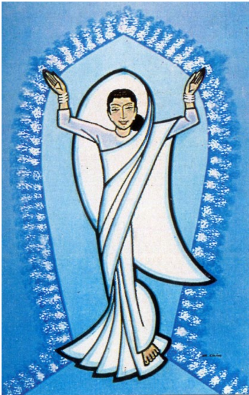
Fig. 2. “Mi espíritu se alegra en Dios”. Sister Claire.