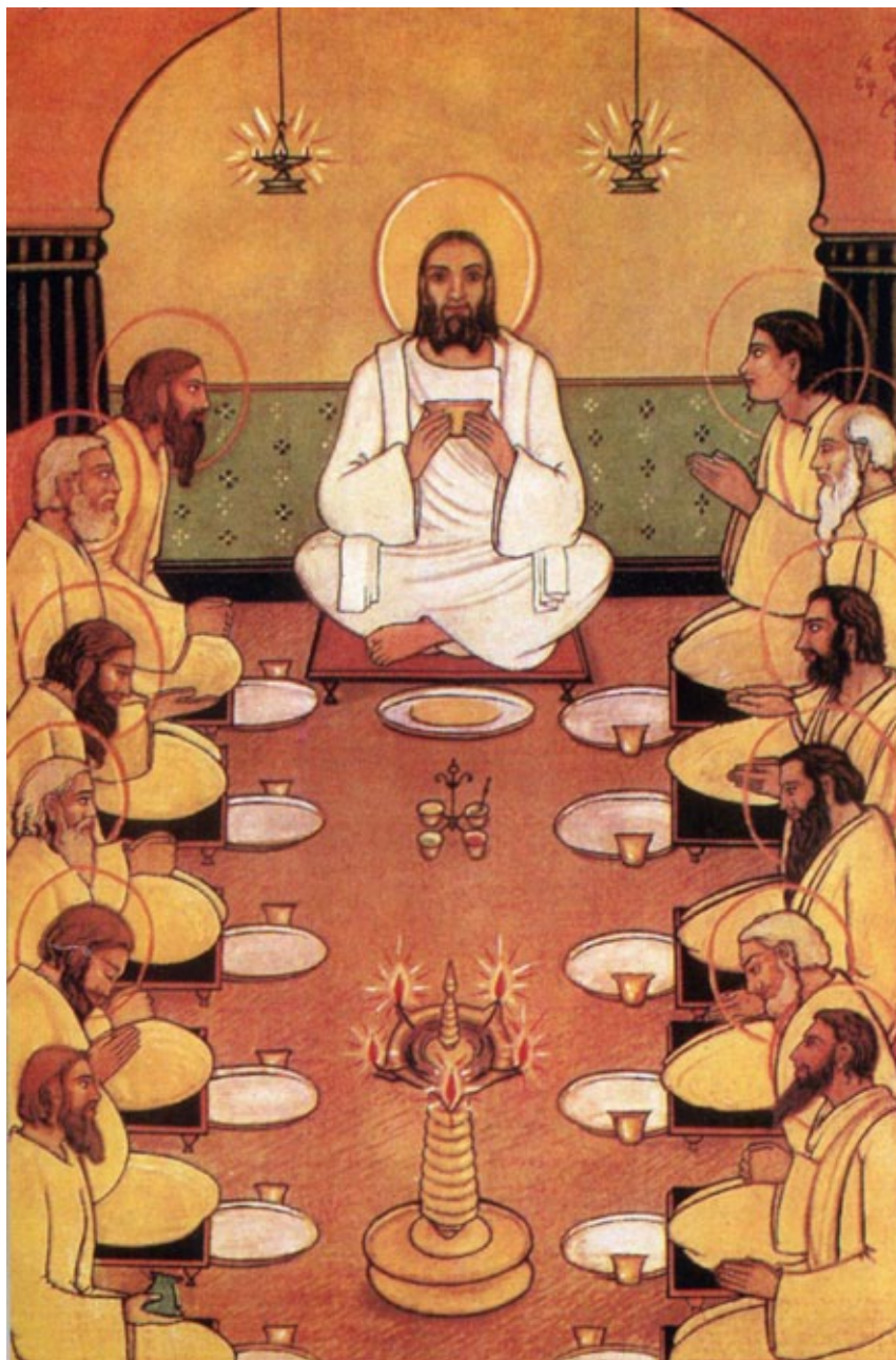
Fig. 1. “La última cena”. Angelo da Fonseca.