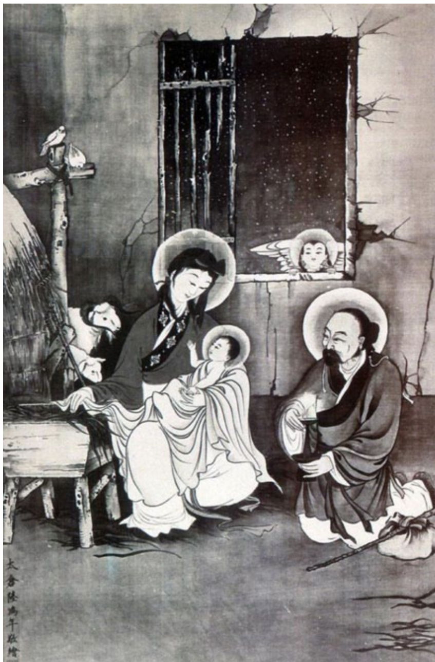
Fig. 4. "El Nacimiento de Cristo". Lu-Hung-Nien.