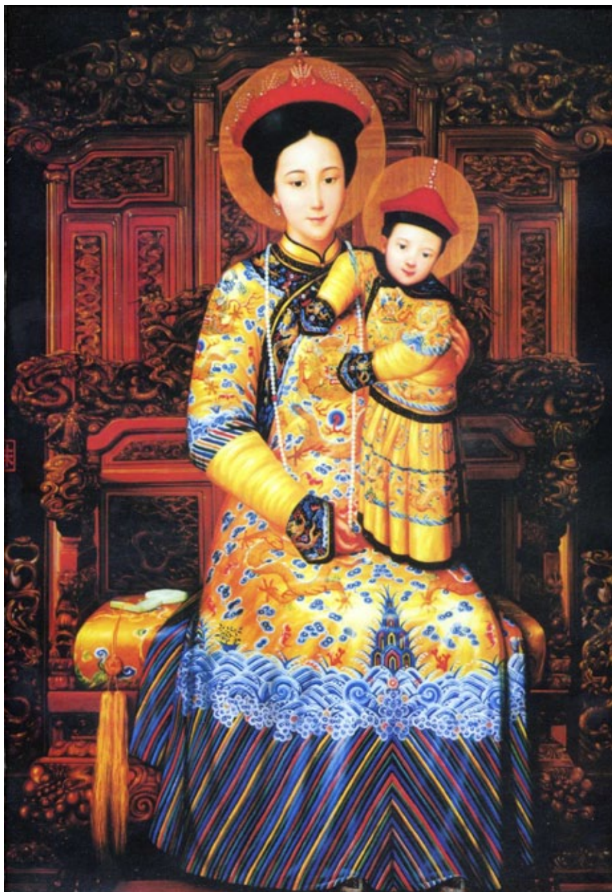
Fig. 5. Virgen con el Niño. Pekín.