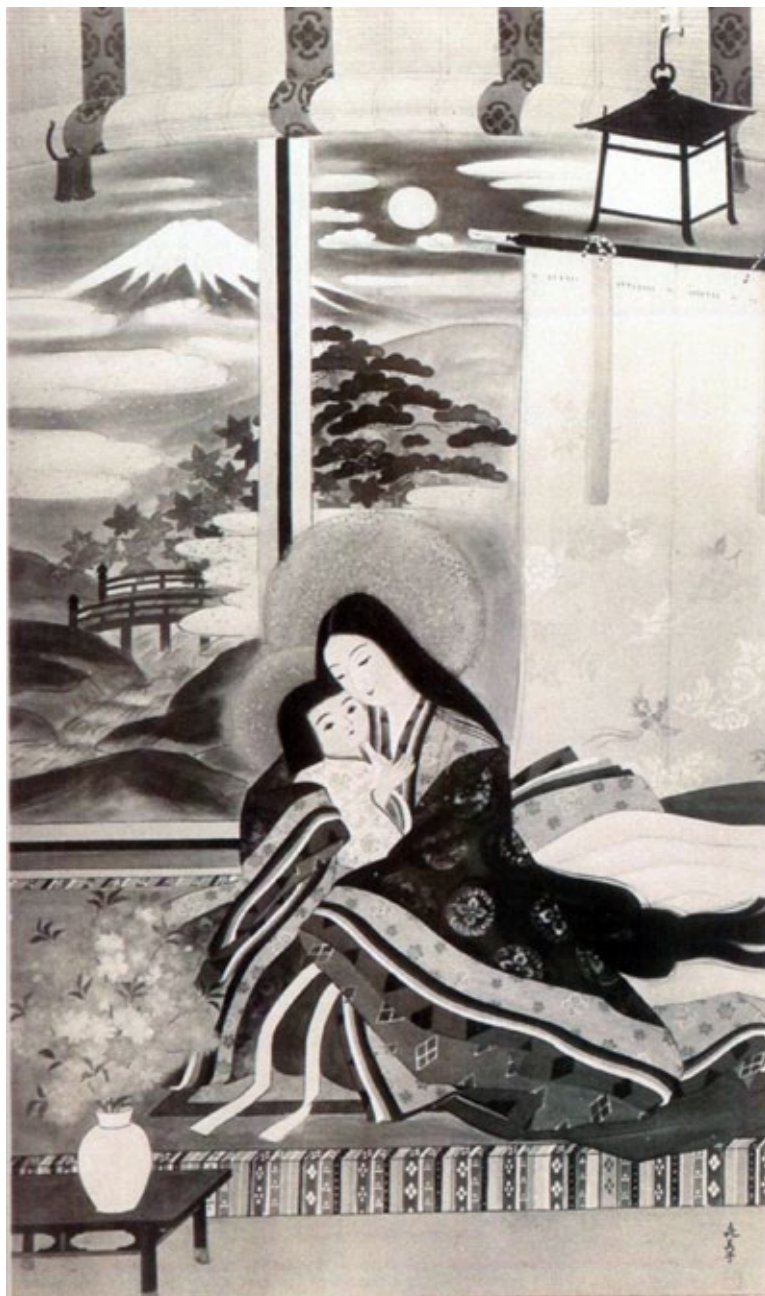
Fig. 7. La Virgen con el Niño en brazos. Teresa Kimiko Koseki.