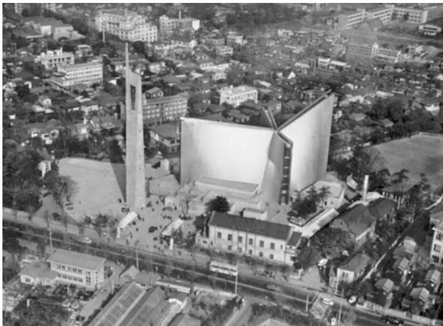
Fig. 9. Vista aérea de la Catedral Católica de Santa María, de Tangne Kenzo.