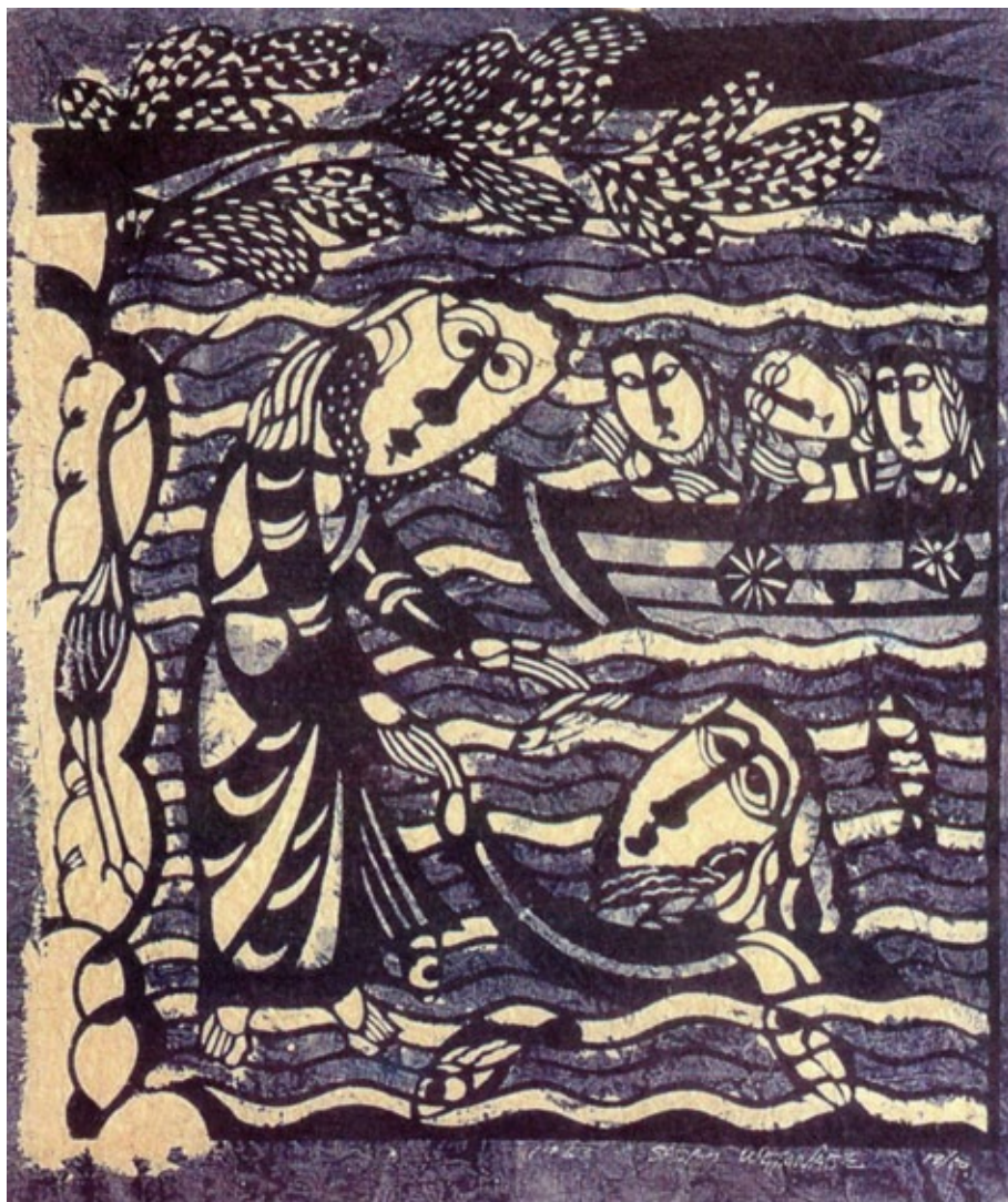
Fig. 8. “Pedro se hunde en las aguas”. Watanabe Sadao.