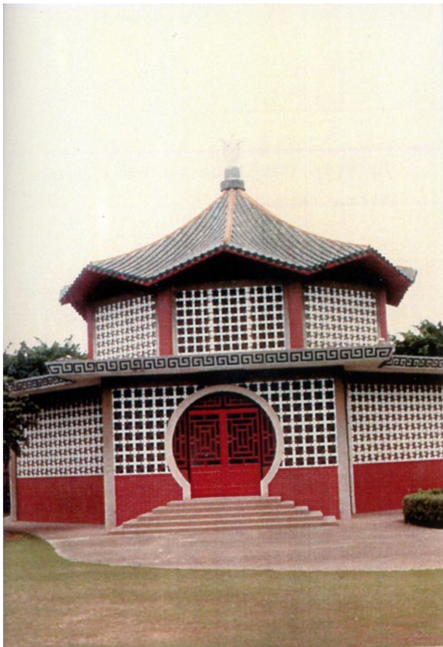
Fig. 6. Iglesia Católica en estilo budista. Hsinchu.