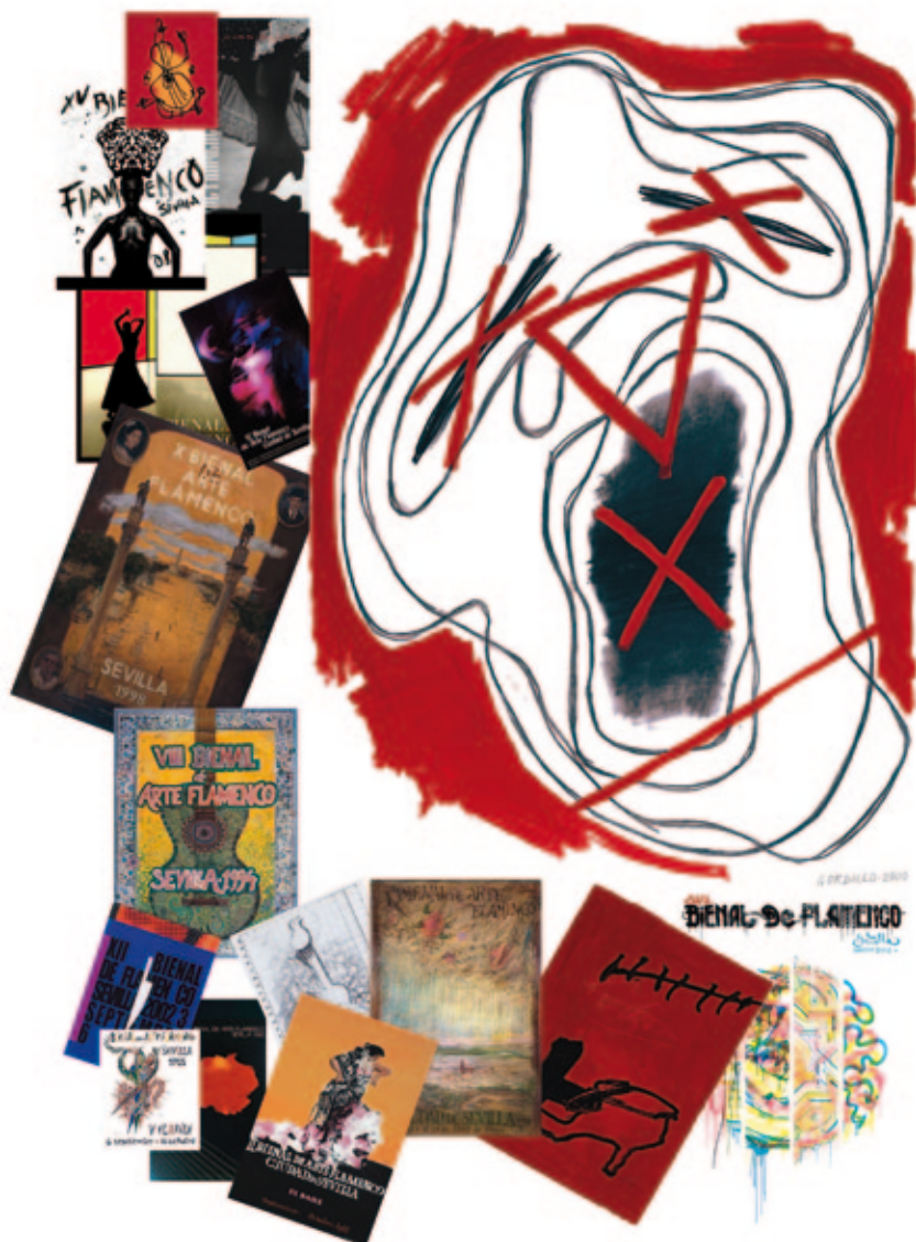
Fig. 5. Composición de carteles de la Bienal de Flamenco de Sevilla, VVAA, 1980-2010, Bienal de flamenco de Sevilla.