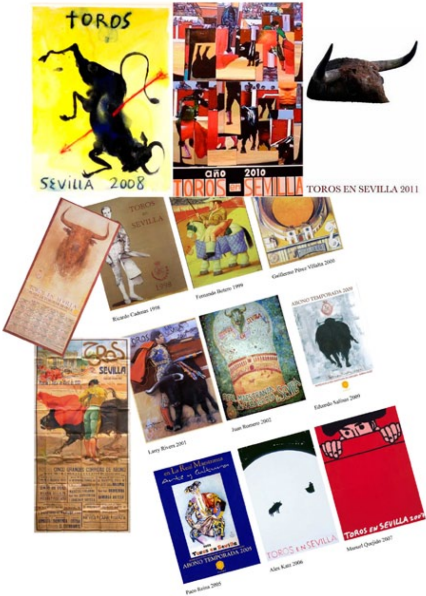
Fig. 4. Composición de carteles de la Real Maestranza de Caballería de Sevilla, VVAA, 1933-2011, Real Maestranza de Caballería de Sevilla.