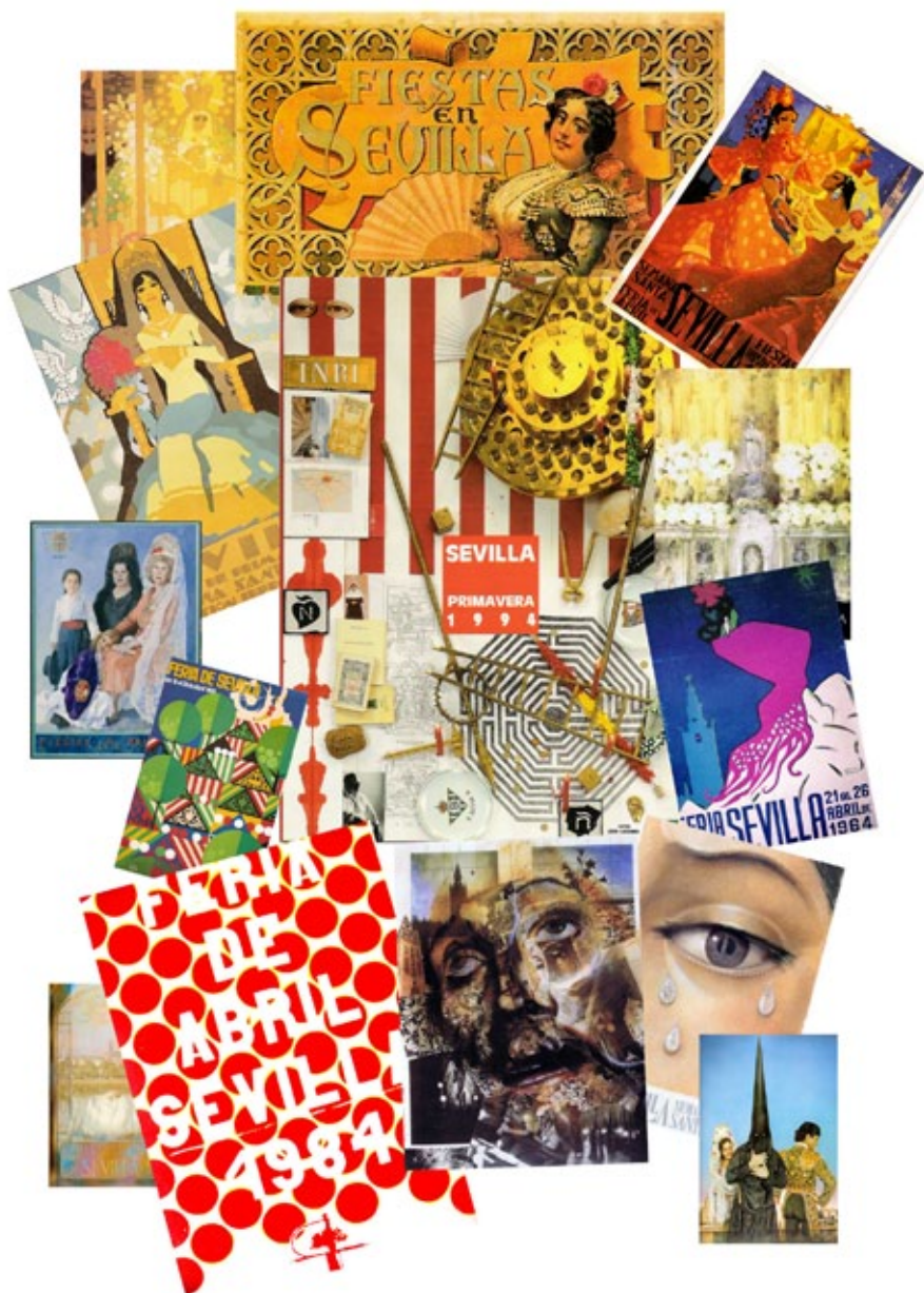
Fig. 3. Composición de carteles de Fiestas de la Primavera, VVAA, 1891-2010, Ayuntamiento de Sevilla.