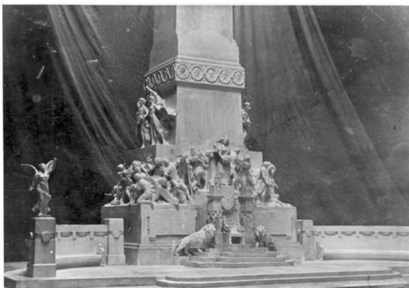
Fig. 4. Segundo proyecto monumento a las Cortes, Constitución y Sitio de Cádiz de L. Coullaut Valera (e.) y R. Martínez Zapatero y R. Sánchez Echevarría (a.a.). Detalles del frente del pedestal.