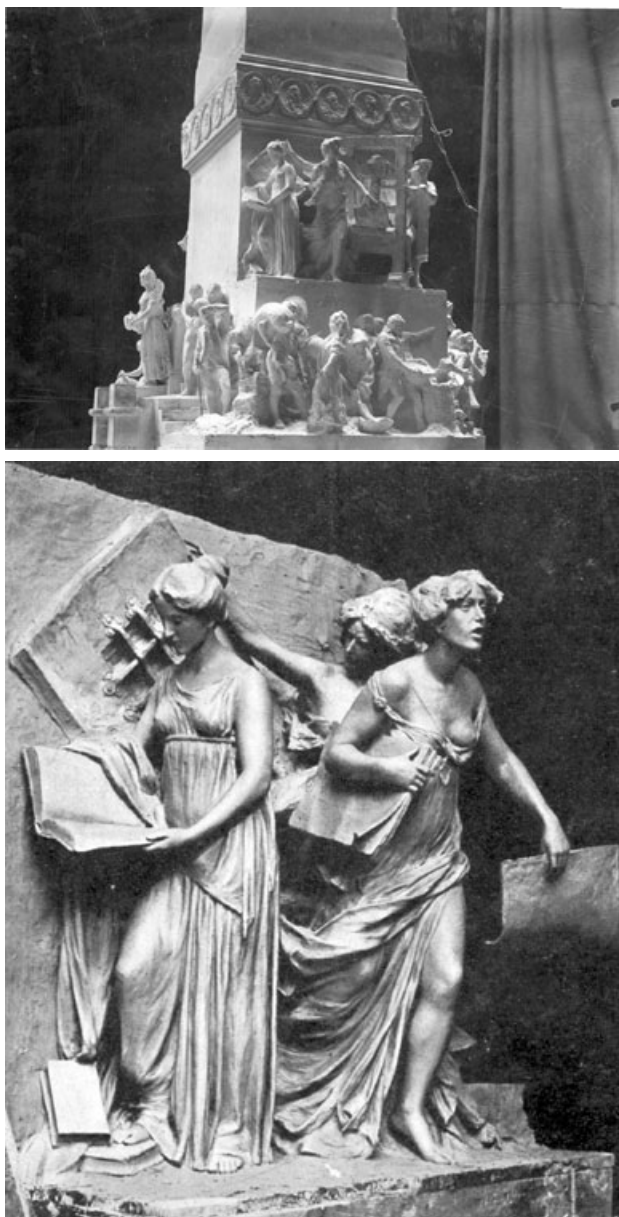
Fig. 6. Segundo proyecto monumento a las Cortes, Constitución y Sitio de Cádiz de L. Coullaut Valera (e.) y R. Martínez Zapatero y R. Sánchez Echevarría (a.a.). Detalle del lateral izquierdo del pedestal y del grupo de la Libertad de Imprenta.