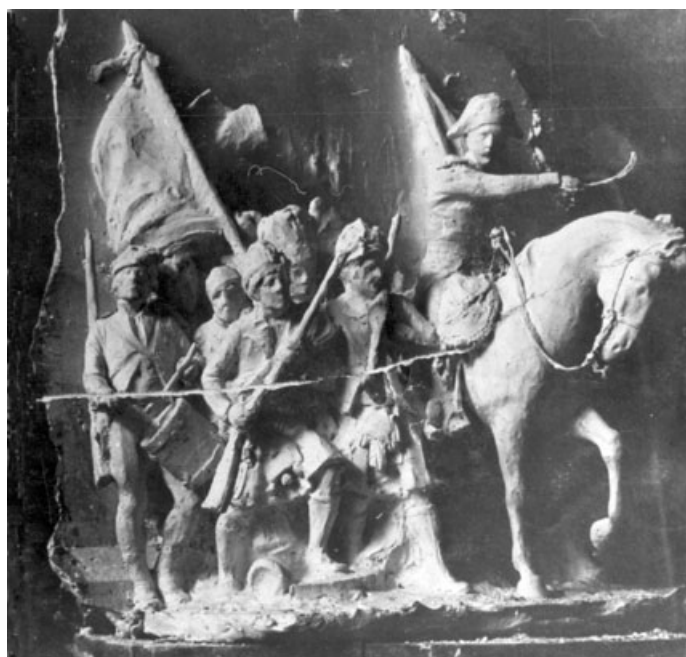
Fig. 5. Segundo proyecto monumento a las Cortes, Constitución y Sitio de Cádiz de L. Coullaut Valera (e.) y R. Martínez Zapatero y R. Sánchez Echevarría (a.a.). Detalles del lateral izquierdo y de la trasera del pedestal, con el grupo de Wellington al frente de las tropas británicas.