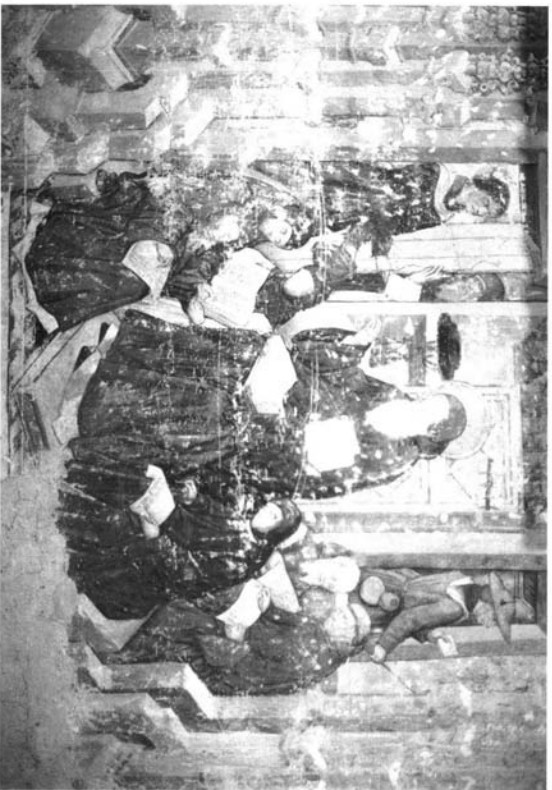
Fig. 2.- San Jerónimo dictando a los monjes. Sala Capitular.