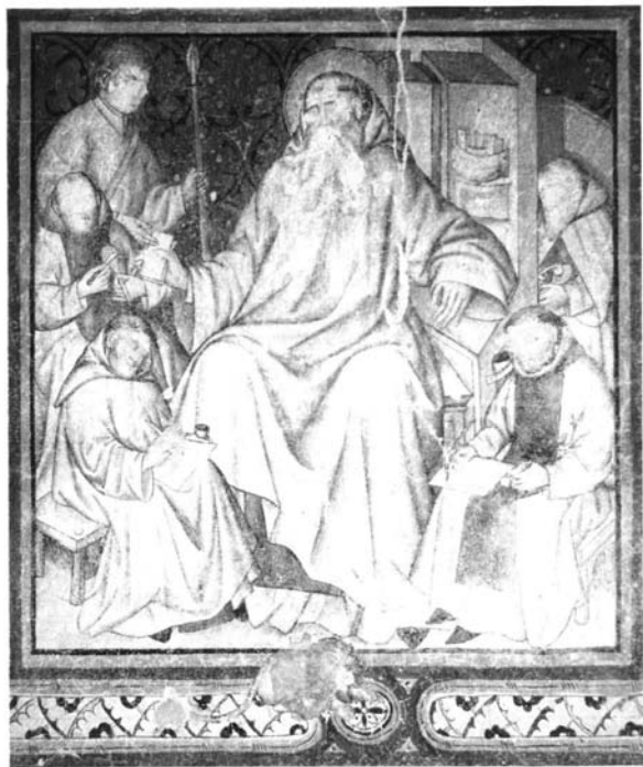
Fig. 1.- San Jerónimo dictando a los monjes. Patio de los Evangelistas.