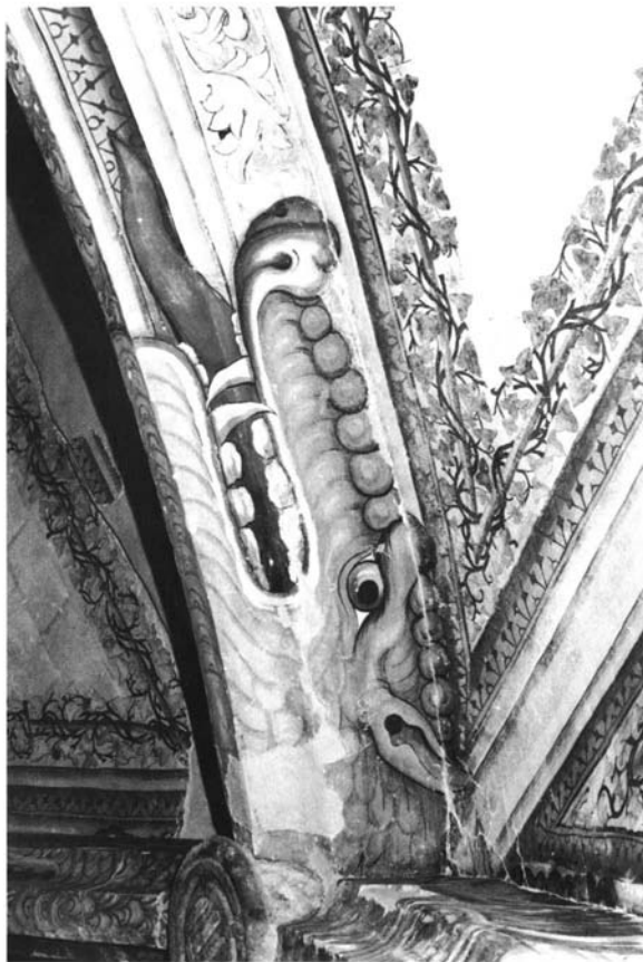
Fig. 7.- Cabeza de dragón. Bóveda gótica de la Sala Capitular.