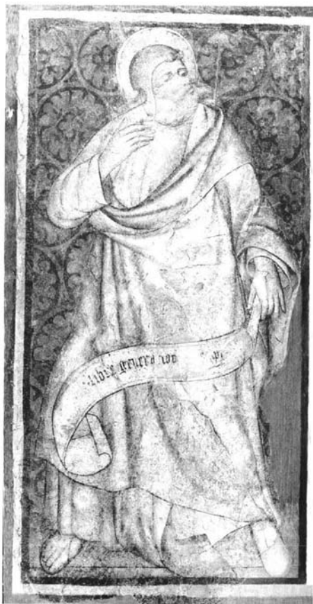
Fig. 4.- San Mateo. Museo Arqueológico de Sevilla.