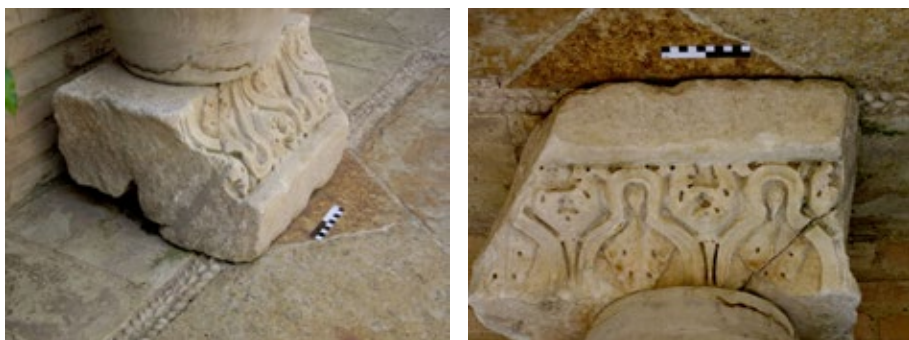
Figura 4. Fragmento de coronamiento de arquitrabe inédito, Córdoba. Colección particular.