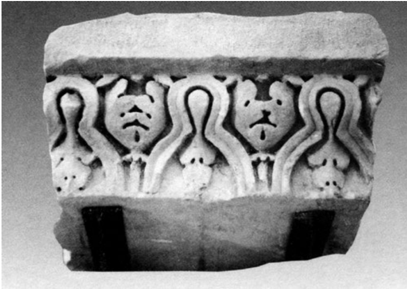
Figura 5. Fragmento de coronamiento de arquitrabe. Museo Arqueológico y Etnográfico de Córdoba. (Márquez, 1998, p.267, lám. 19, Figura27).