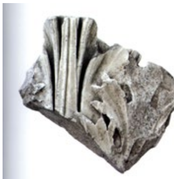
Figura 2. Fragmento de capitel colosal de orden corintio del templo de la calle Morería, Córdoba. Museo Arqueológico y Etnológico de Córdoba. (Peña-Ventura-Portillo, 2011, p. 311, Figura 17).