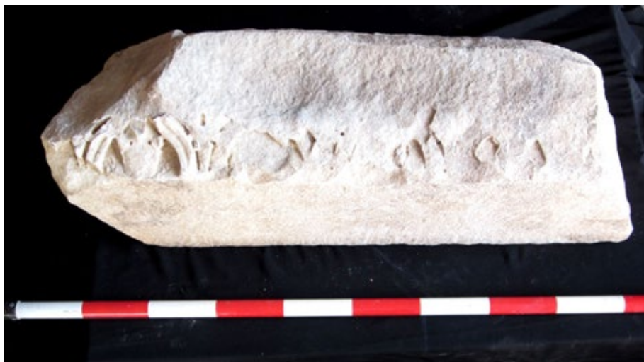
Figura 3. Coronamiento de arquitrabe de grandes proporciones. Museo Arqueológico y Etnológico de Córdoba.