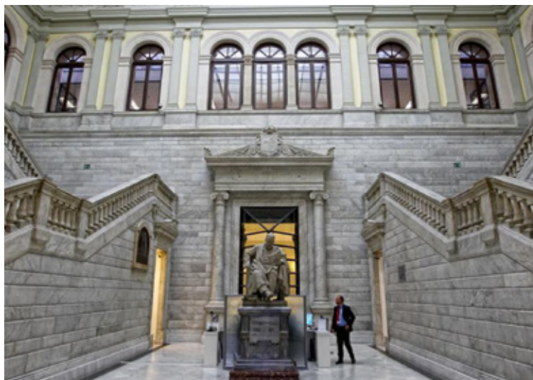
Figura 3. La estatua de Marcelino Menéndez y Pelayo en el vestíbulo de la Biblioteca Nacional.