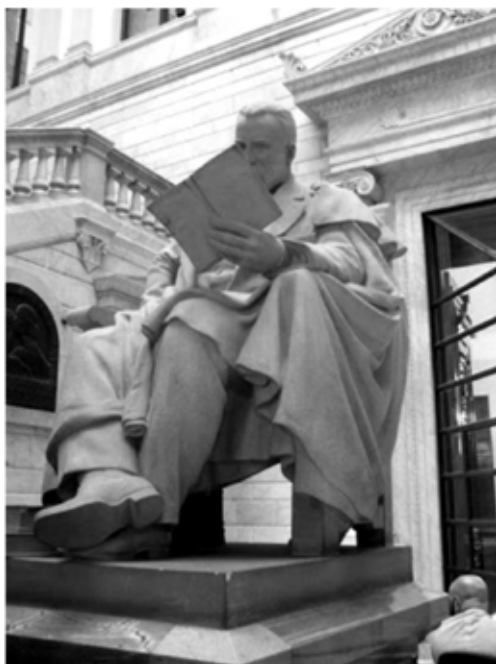
Figura 6. Estatua de Marcelino Menéndez y Pelayo.