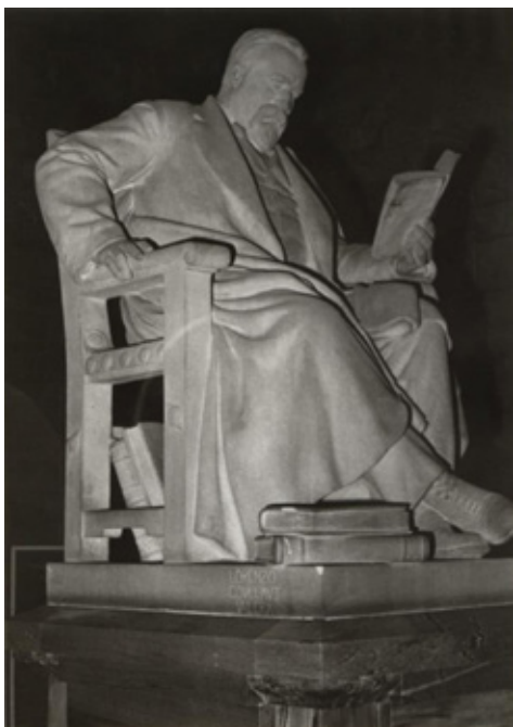
Figura5. Estatua de Marcelino Menéndez y Pelayo.