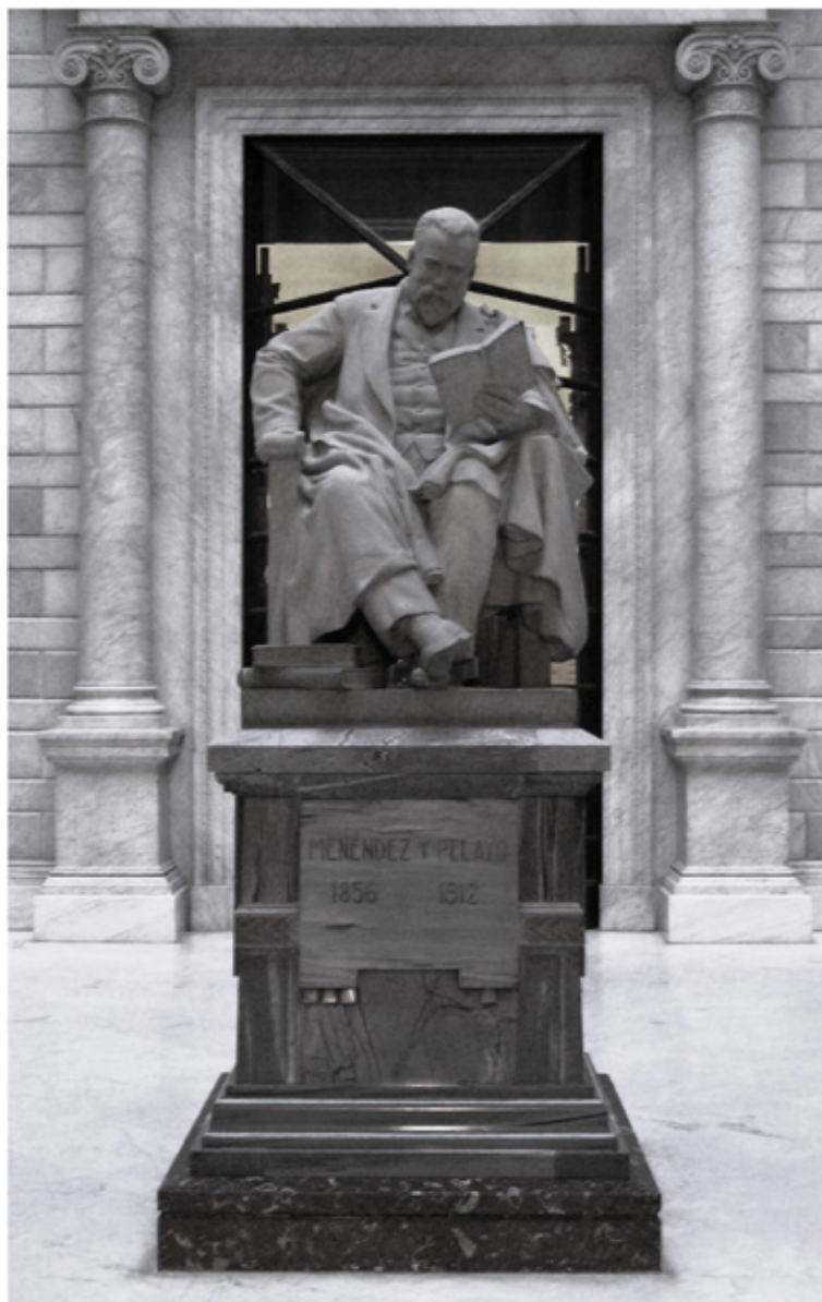
Figura 4. Estatua de Marcelino Menéndez y Pelayo.