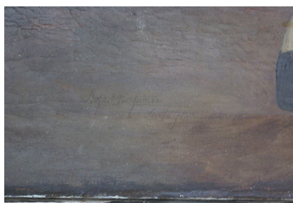
Figura 6. Pareja de majos andaluces. Detalle firma Benjumea.