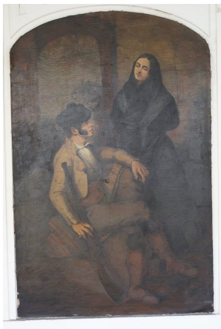
Figura 3. Bandolero y mujer conversando. Rafael Benjumea. 1843. o/l. 2,00 x 1,30 m.