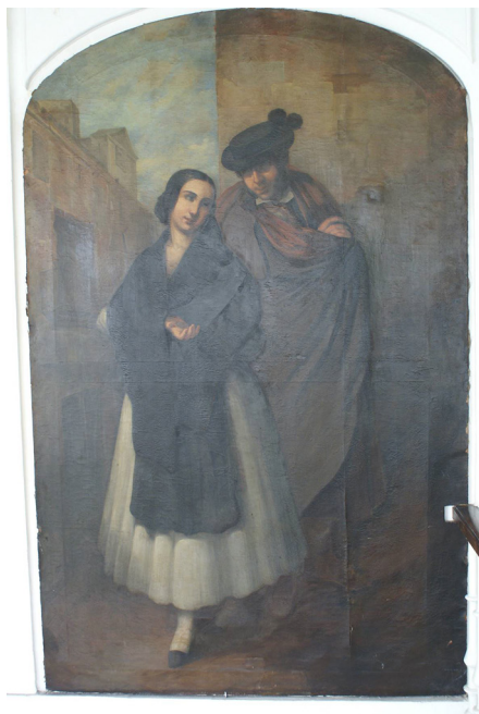
Figura 4. Pareja de majos andaluces. Rafael Benjumea. 1843. o/l. 2,00 x 1,30 m.