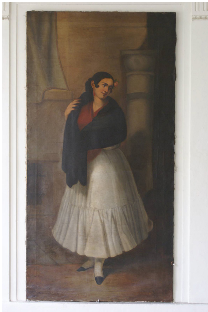
Figura 1. Joven andaluza. Antonio Mensaque. 1843. Óleo sobre lienzo (o/l). 2,10 x 1,10 m.