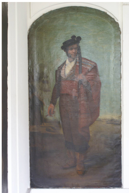
Figura 2. Bandolero. Rafael Benjumea. 1843 o/l. 2,00 x 1,00 m.