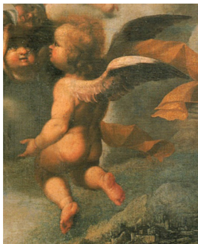
Figura 4. Sebastián de Llanos de Valdés. Detalle de la Inmaculada niña. Sevilla. Col. particular.