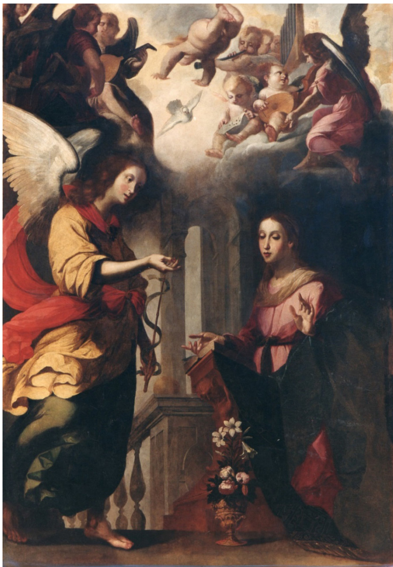
Figura 1. Sebastián de Llanos Valdés. Anunciación. Cádiz. Real Capilla de Nuestra Señora del Pópulo.