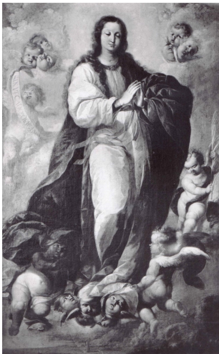
Figura 2. Sebastián de Llanos de Valdés. Inmaculada. Sevilla. Col. particular.