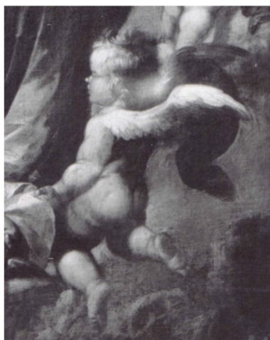
Figura 3. Sebastián de Llanos de Valdés. Detalle de la Inmaculada. Sevilla. Col. particular.