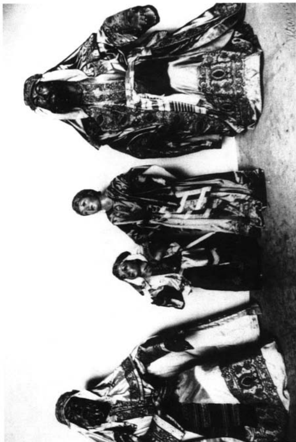
Lámina 2: Hebreos de la Sagrada Entrada de Jesús en Jerusalén. Año 1805. Los dos niños son del siglo XVIII.