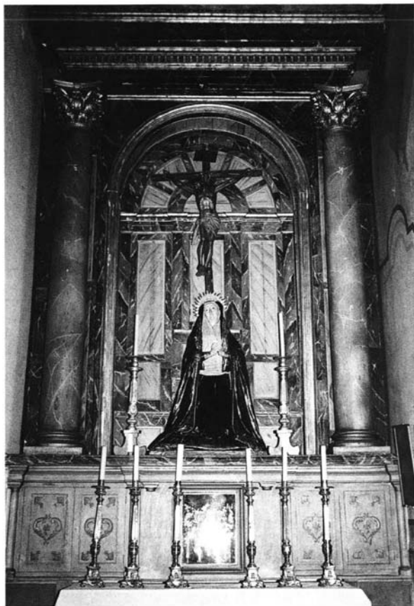
Lámina 5: Caja central del retablo de Jesús Nazareno. Parroquia de Santa Genoveva, Sevilla.