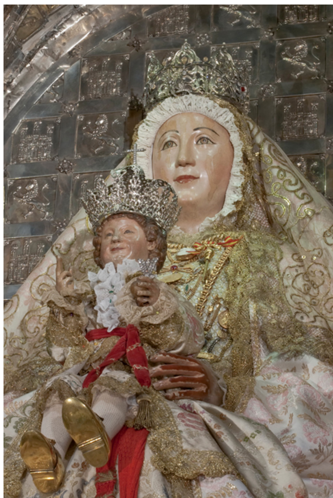
Figura 7. Virgen de los Reyes y Niño con sus coronas de 1873 y 1889; marca de la corona del Niño atribuida a Felipe Lecaroz. Altar de la Virgen de los Reyes, capilla Real, catedral de Sevilla.