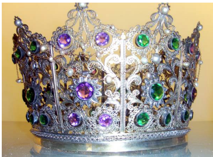
Figura 6. Manuel González de Rojas, 1889. Corona de filigrana dorada y piedras francesas de la Virgen de los Reyes.