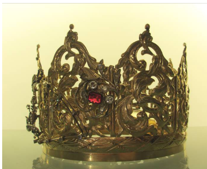
Figura 4. José Lecaroz, 1873. Corona de la Virgen de los Reyes. Catedral de Sevilla, capilla Real.