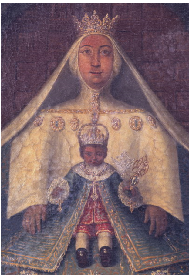
Figura 1. Pormenor del ajuar suntuario de la Virgen con el broche del águila y pluma del Niño en una pintura anónima del siglo XVII, conservada en la sala capitular de la capilla Real de Sevilla. INV. N° 4109101110746.000.

Fecha de aceptación: 28 de noviembre de 2014