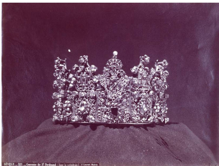
Figura 3. Corona de la Virgen de los Reyes sustraida el 1 de abril de 1873. Jean Laurent, 1872 (© Madrid, Museo Nacional de Artes Decorativas).