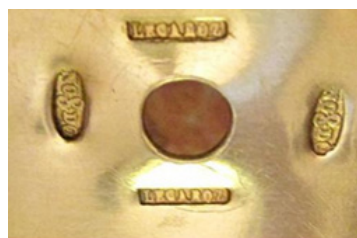
Figura 5. Detalle de la corona de José Lecaroz con las joyas añadidas en la segunda mitad del siglo XX; marcas de 1873 (© Teresa Laguna y Catedral de Sevilla).