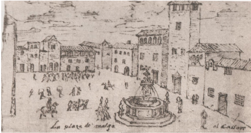
Figura 1. Plaza Mayor de Málaga. Dibujo de Anton van den Wyngaerde. (c. 1564).