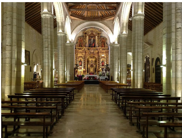
Figura 2. Interior. Nave central. Hernán Ruiz III. 1577-1591.