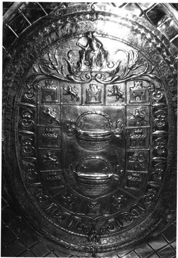
Lámina 3. Escudo del frontal primitivo del Santuario de Ntra. Sra. de la Caridad.