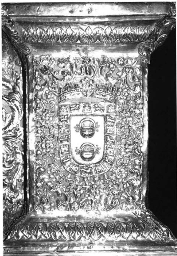
Lámina 2. Baldaquino procesional de Ntra. Sra. de la Caridad. Escudo de los Guzmanes en el pedestal de las columnas.