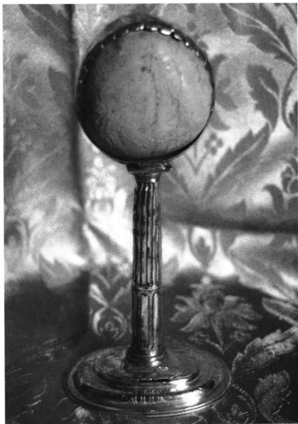
Lámina 4. Relicario del "Chino milagroso".