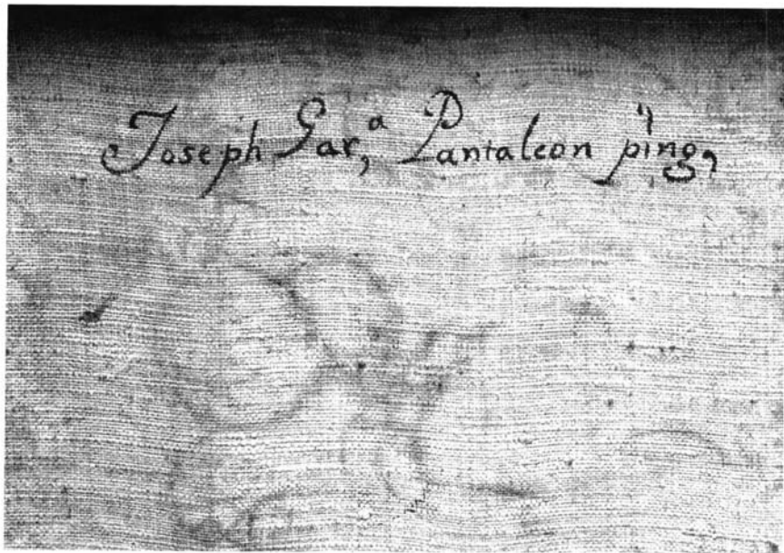
Fig. 4 Detalle: (Reverso del lienzo de la Fig. 2). Inscripción: "Joseph García Pantaleón. pingo".