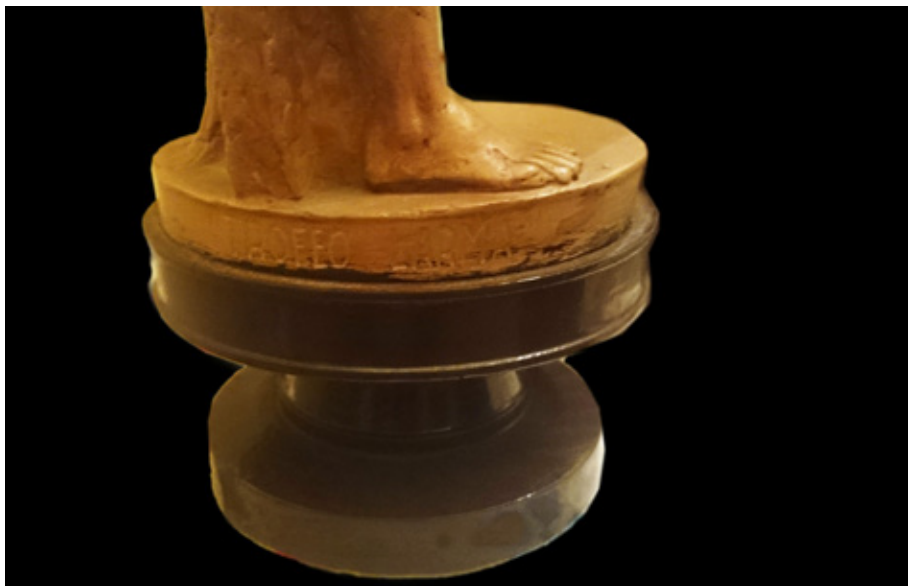
Figura 3. Juan de Ávalos, Trofeo Larma (título), colección Marroco, Sevilla.