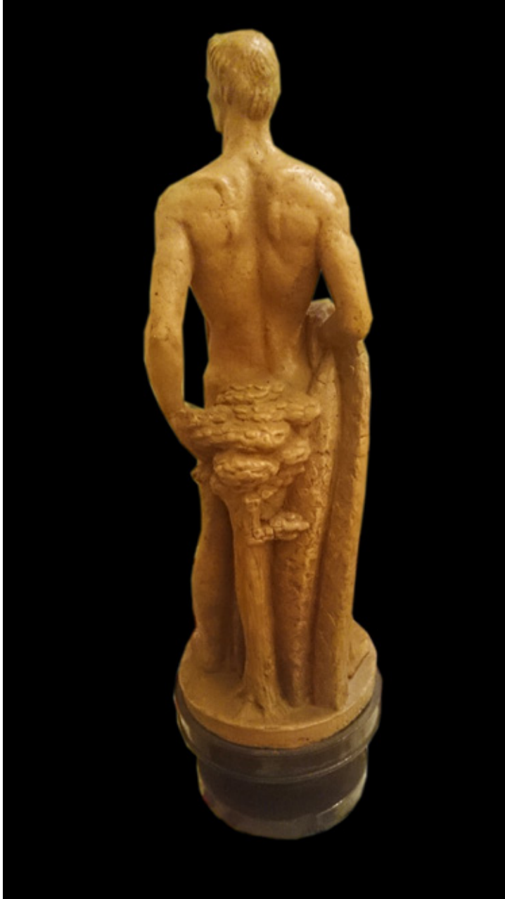
Figura 4. Juan de Ávalos, Trofeo Larma (vista posterior), colección Marroco, Sevilla.