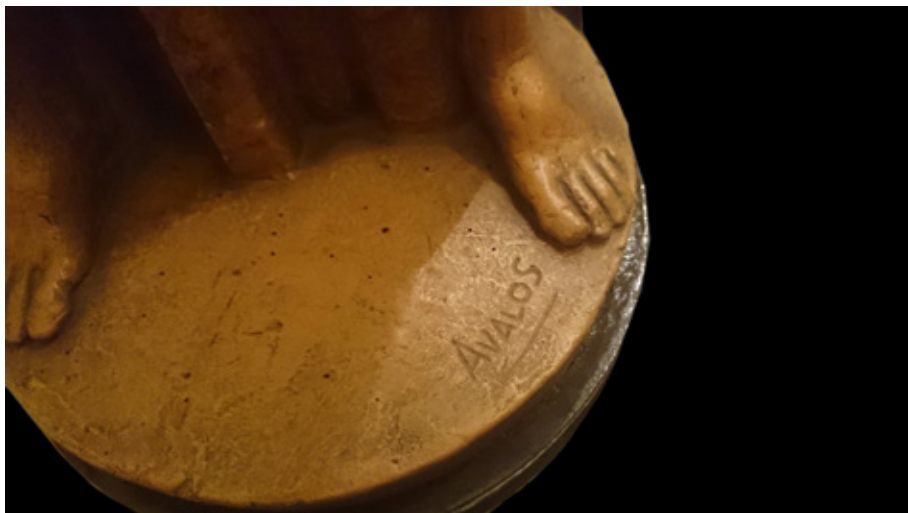
Figura 2. Juan de Ávalos, Trofeo Larma (firma), colección Marroco, Sevilla.