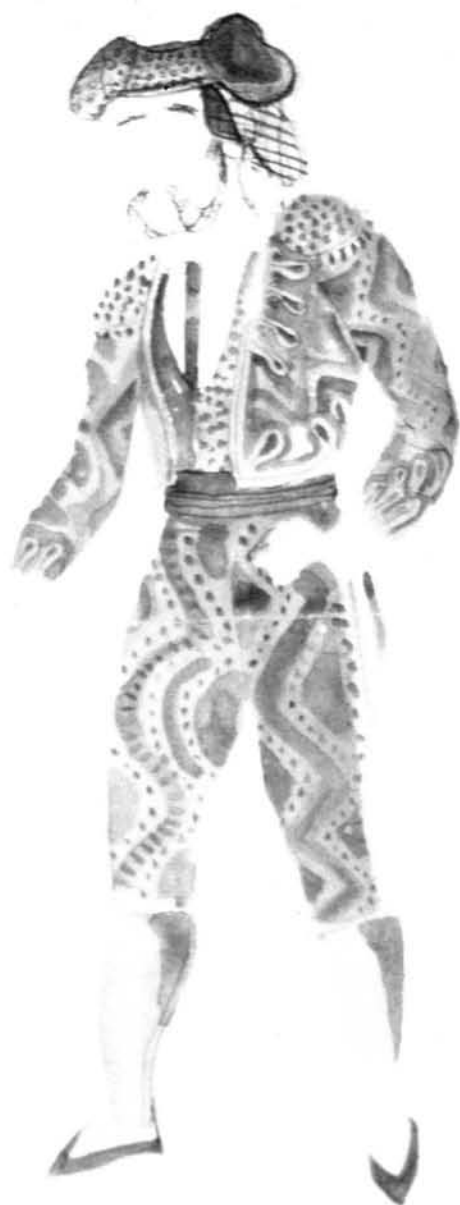
Diseño del figurín para el proyecto de Pilar Miró de la ópera "Carmen".