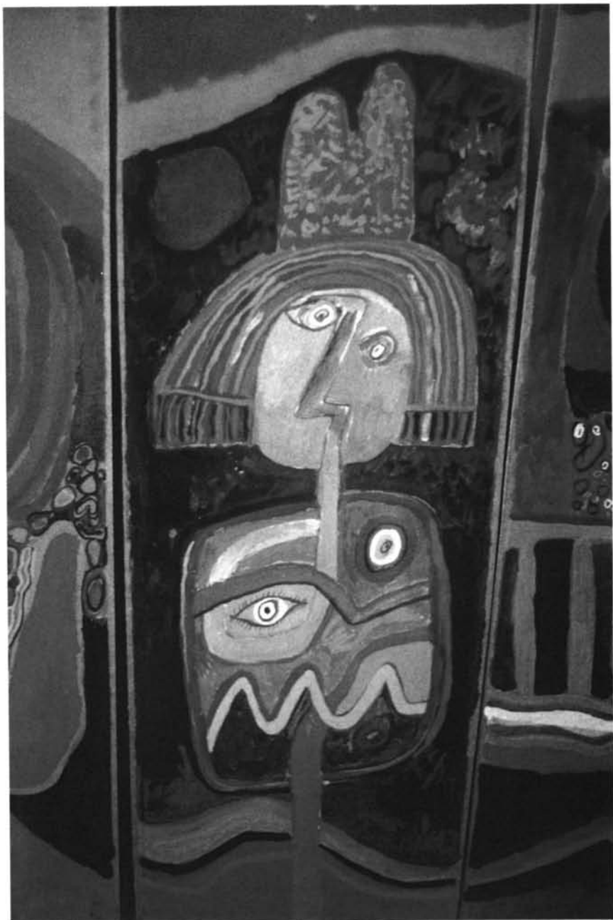
Detalle de "El Día".