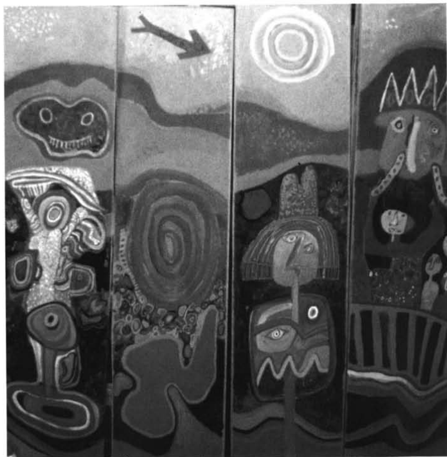
Decorado para la obra de Fernando Arrabal "La Coronación" estrenada en París en 1965. Escena del biombo que representa "El Día".