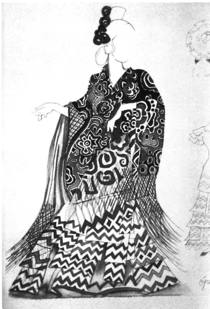
Diseño del figurín para el proyecto de Pilar Miró de la ópera "Carmen".