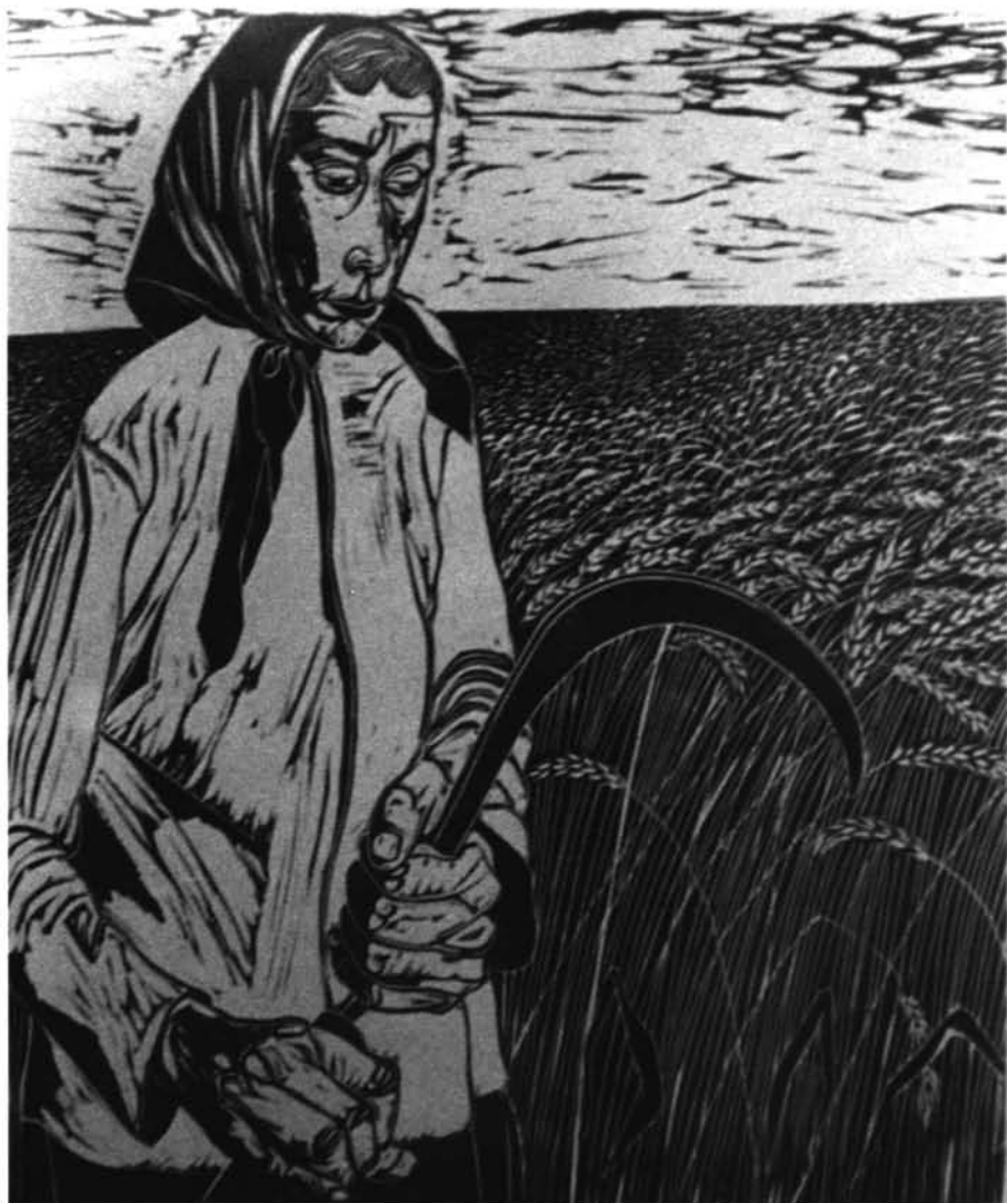
Fig. 1: Campesina. 1960. Linóleo. 25 x 30 cms.