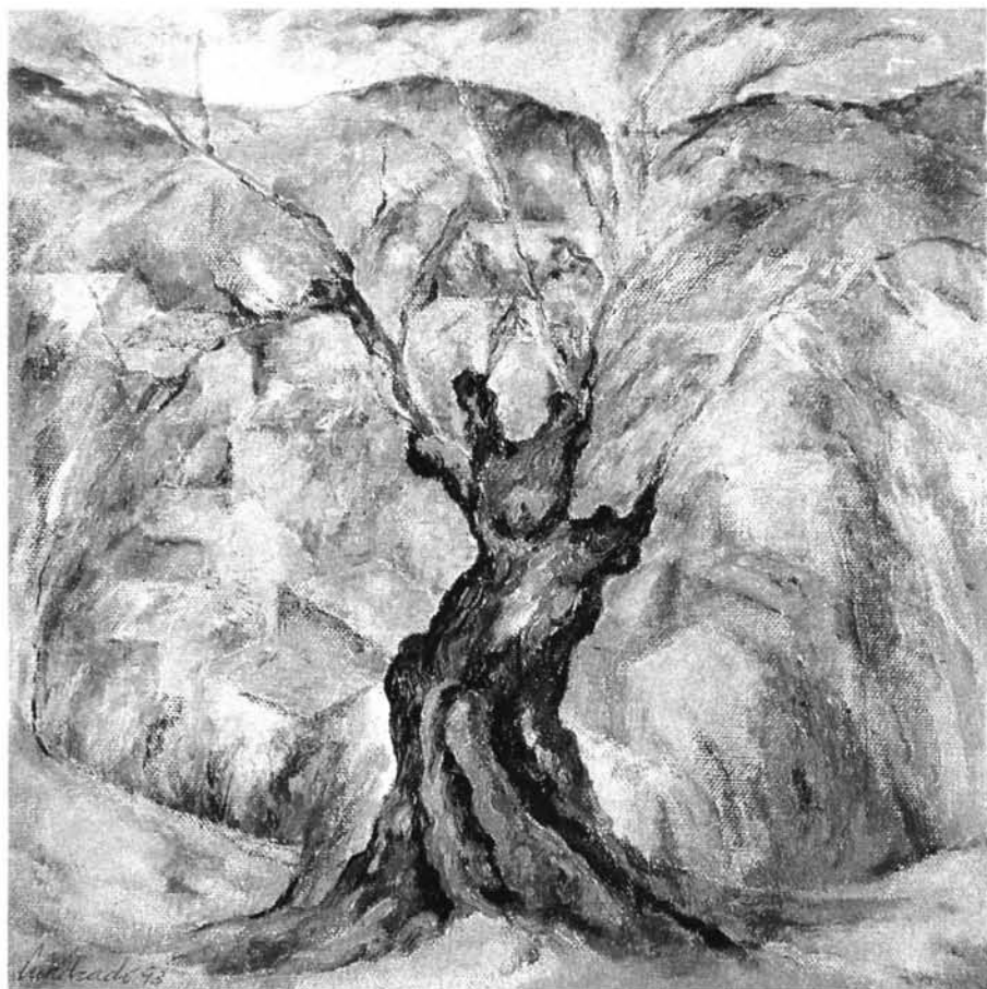
Fig. 5: Fuenteheridos. 1993. Óleo sobre lienzo. 73 x 100 cms.