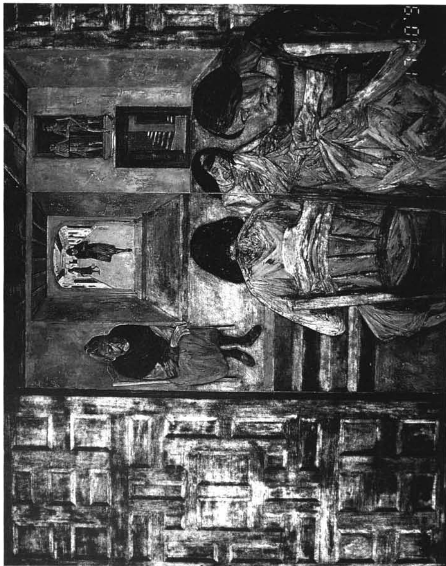
Fig. 3: Las costureras, 1965, Tabla, 145 x 180 cms.