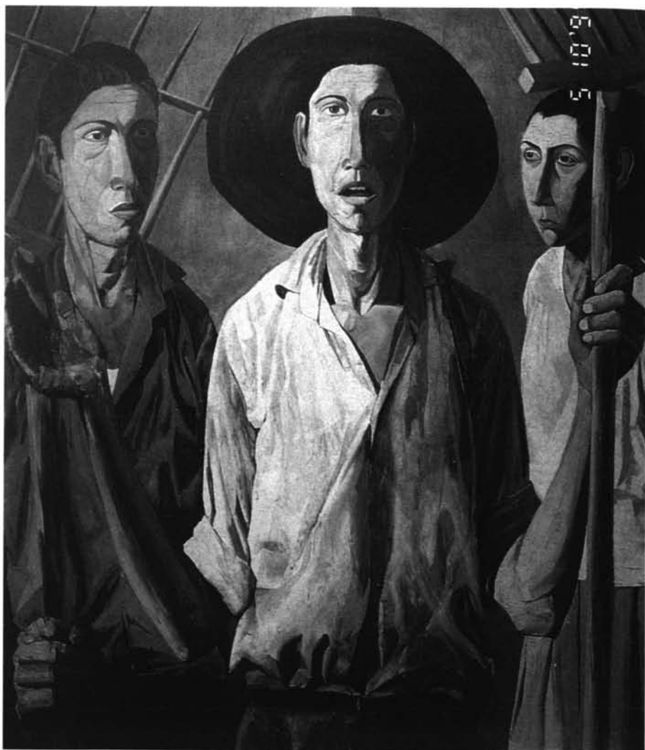
Fig. 2: Pan y Trabajo. 1960. Tabla. 122 x 140 cms.